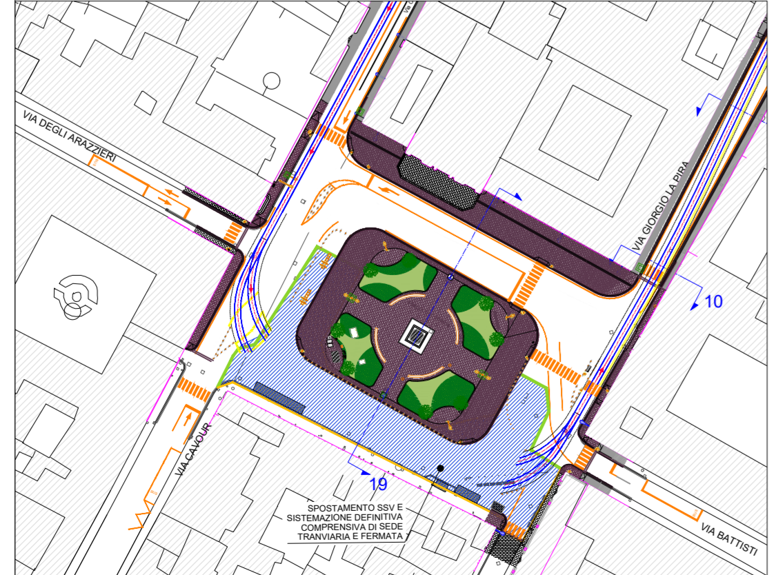
VACS LOTTO II - CONTEMPORANEITA' FASE 3.1b