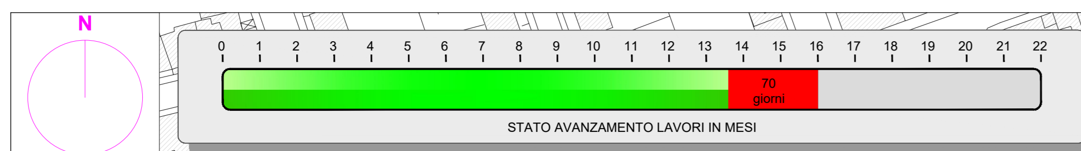
VACS LOTTO II - CONTEMPORANEITA' FASE 3.1b