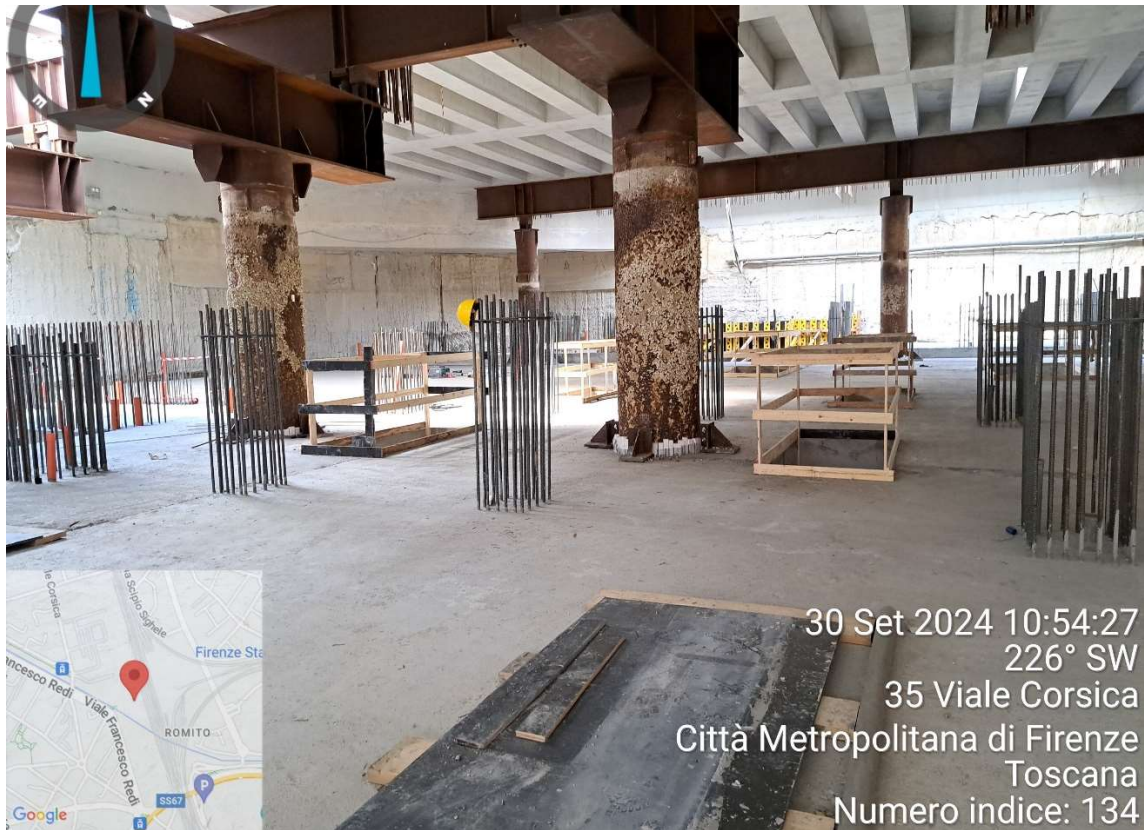
Figura 1 - Stazione AV