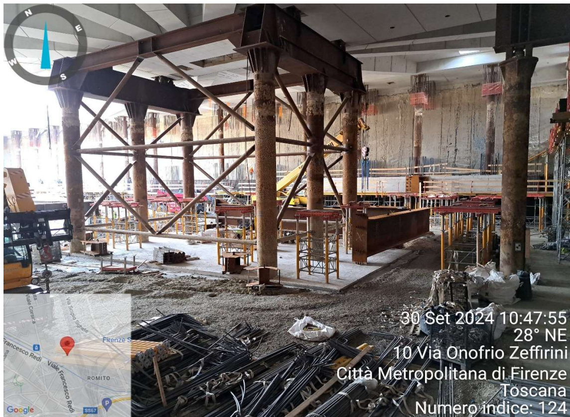
Figura 2 - Stazione AV