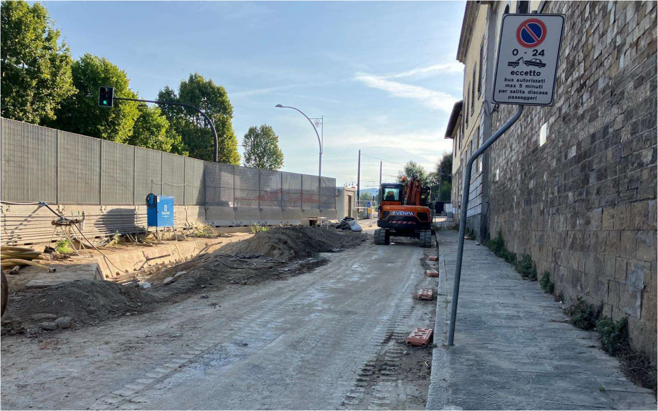
Figura 10 - Fortezza Area 3