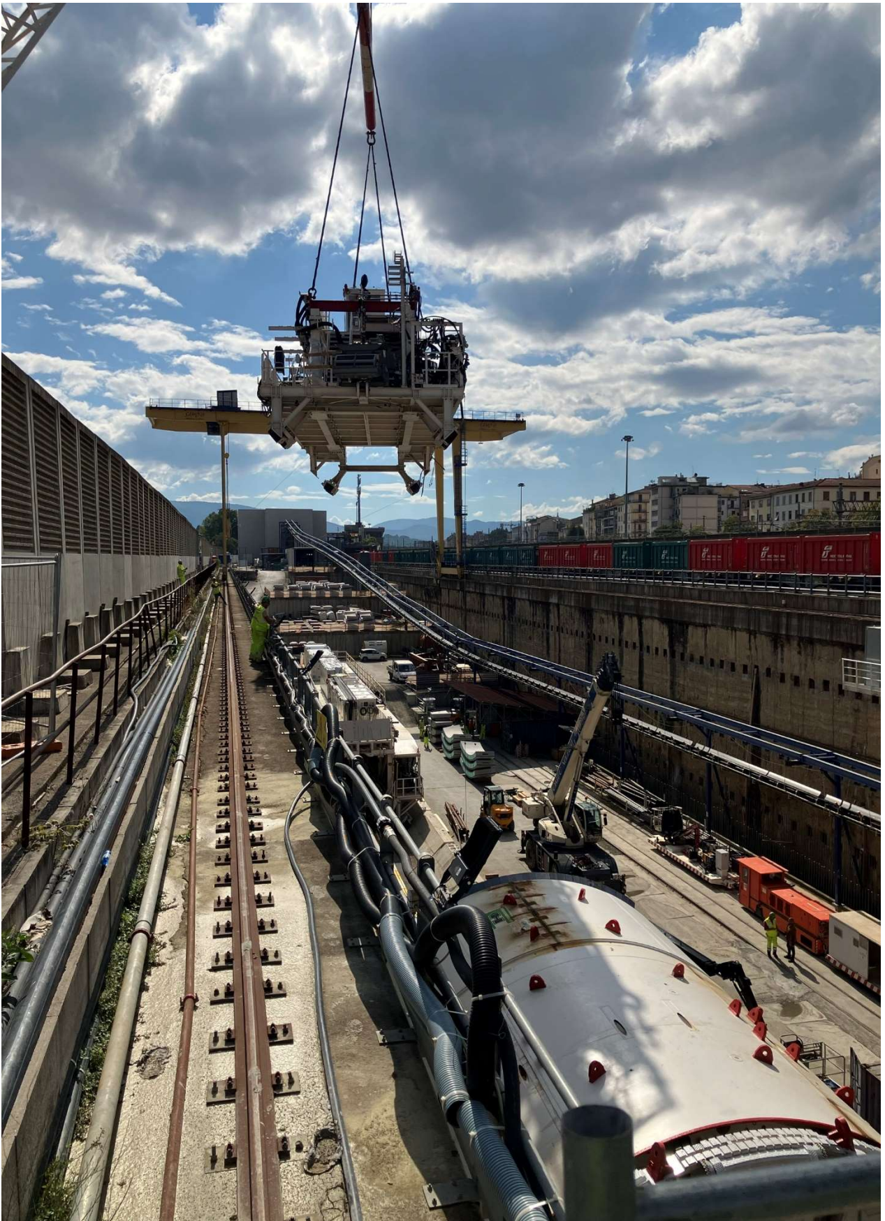
Figura 5 – Campo di Marte