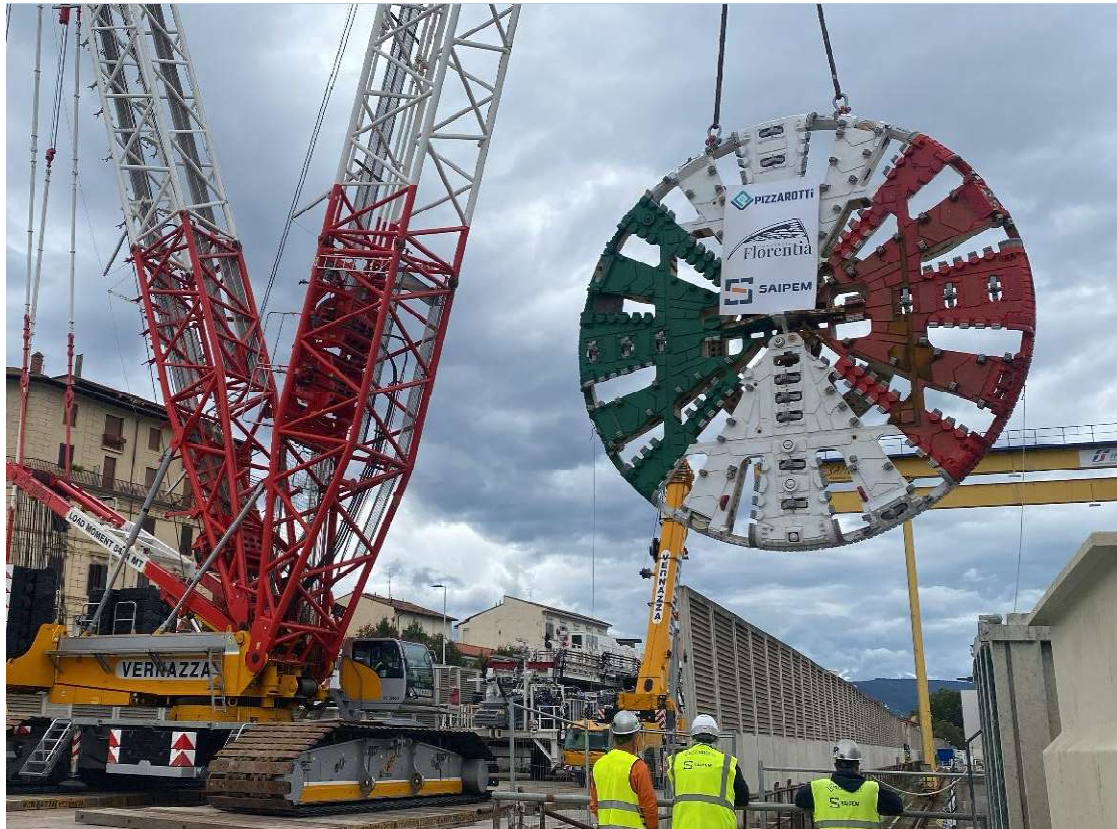
Figura 4 - Campo di Marte