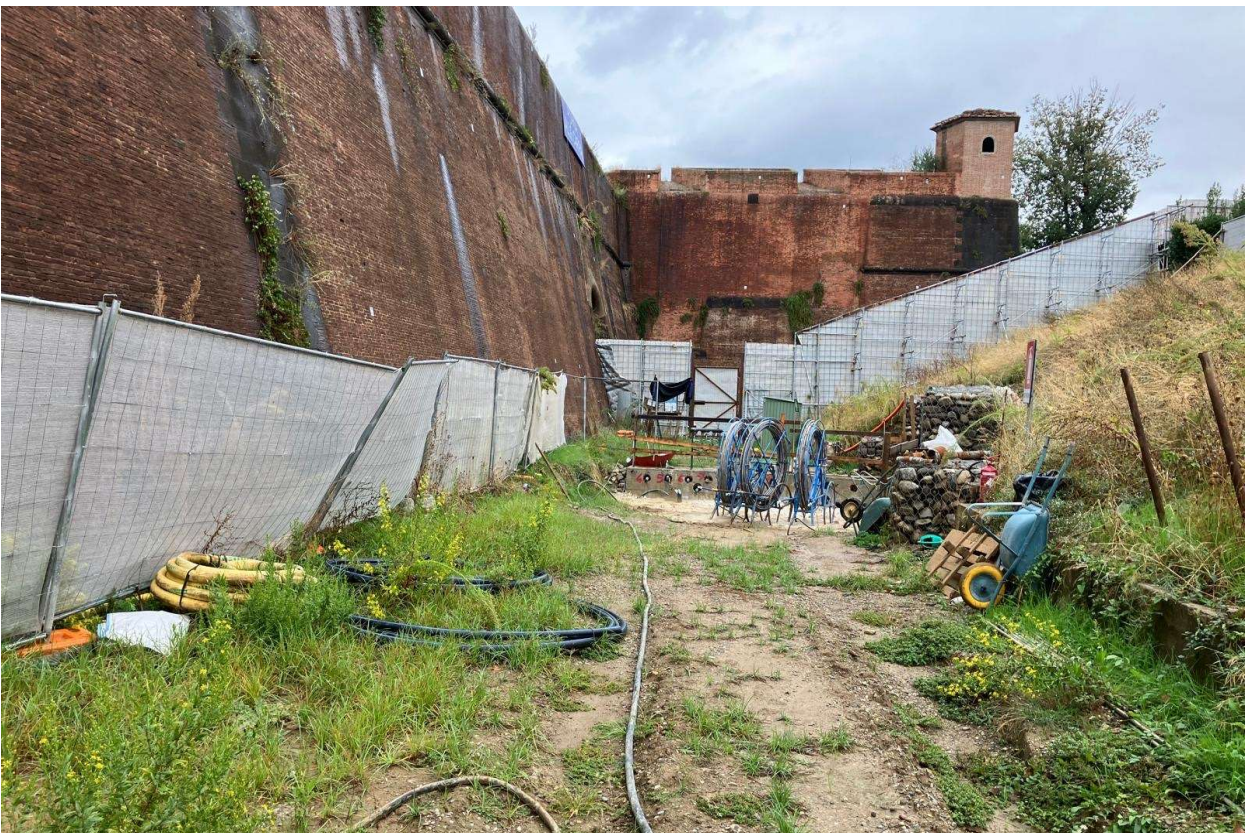
Figura 9 - Fortezza Area 2