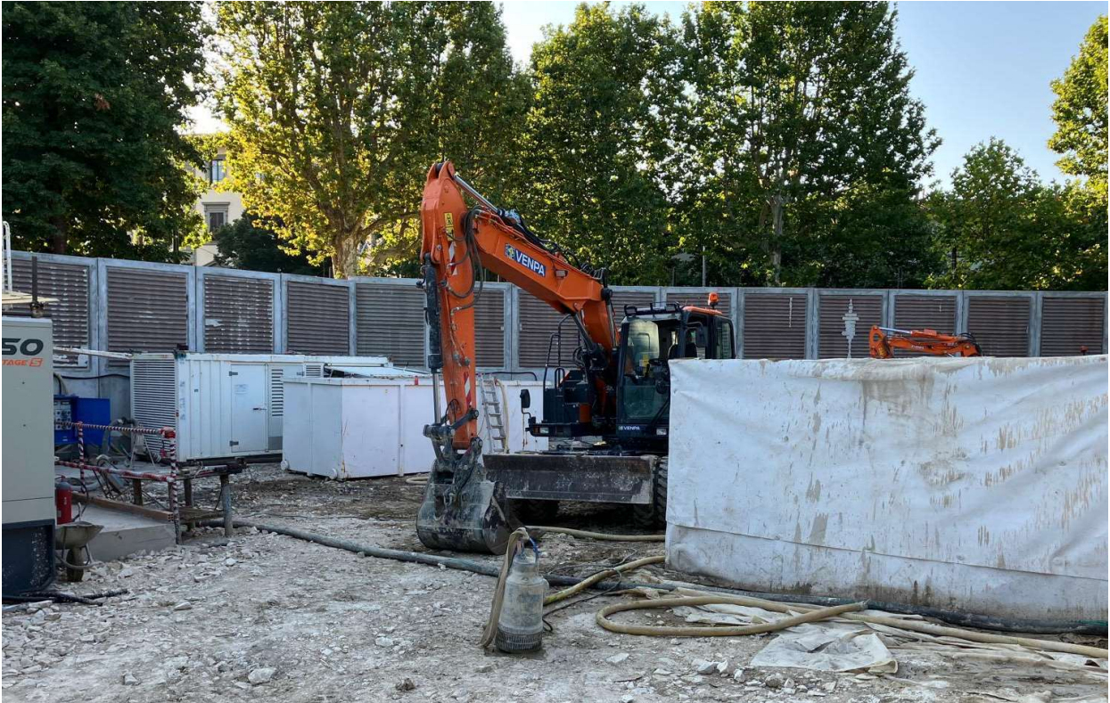
Figura 8 - Fortezza Area 1