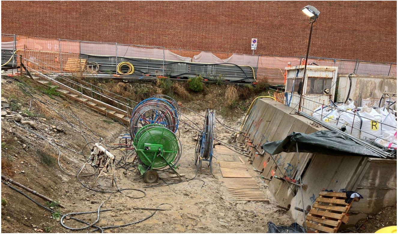
Figura 11 - Fortezza Area 4