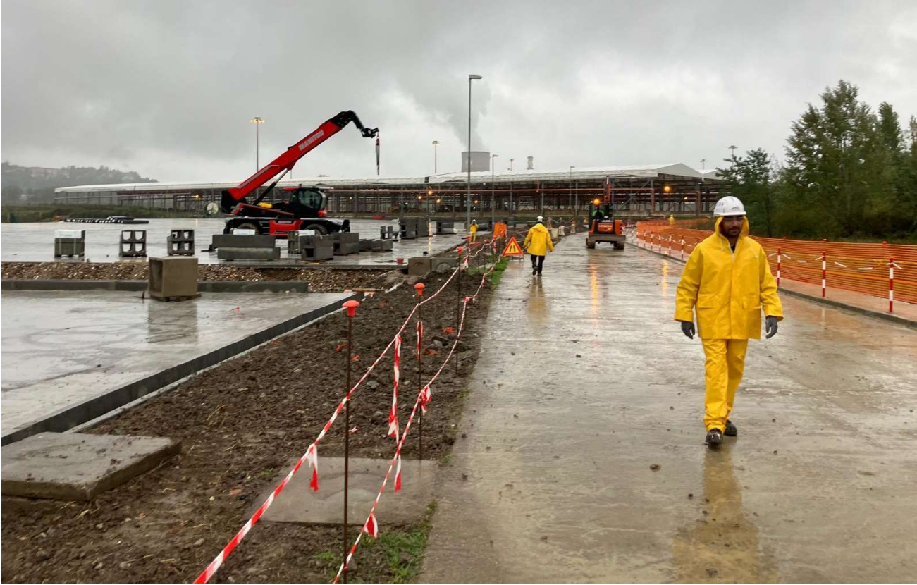
Figura 7 – Santa Barbara