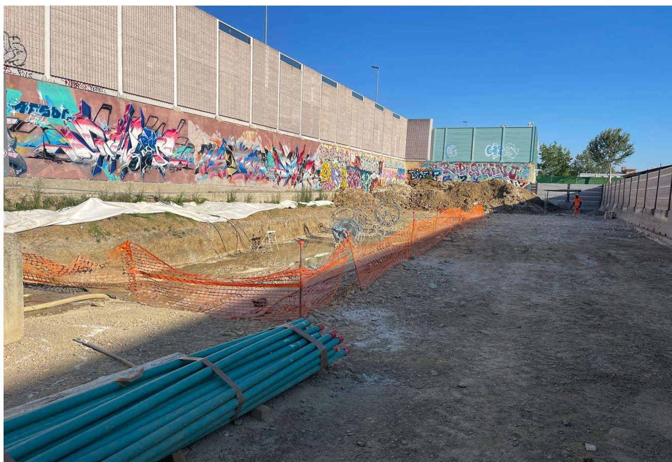
Figura 15 - Ottone Rosai