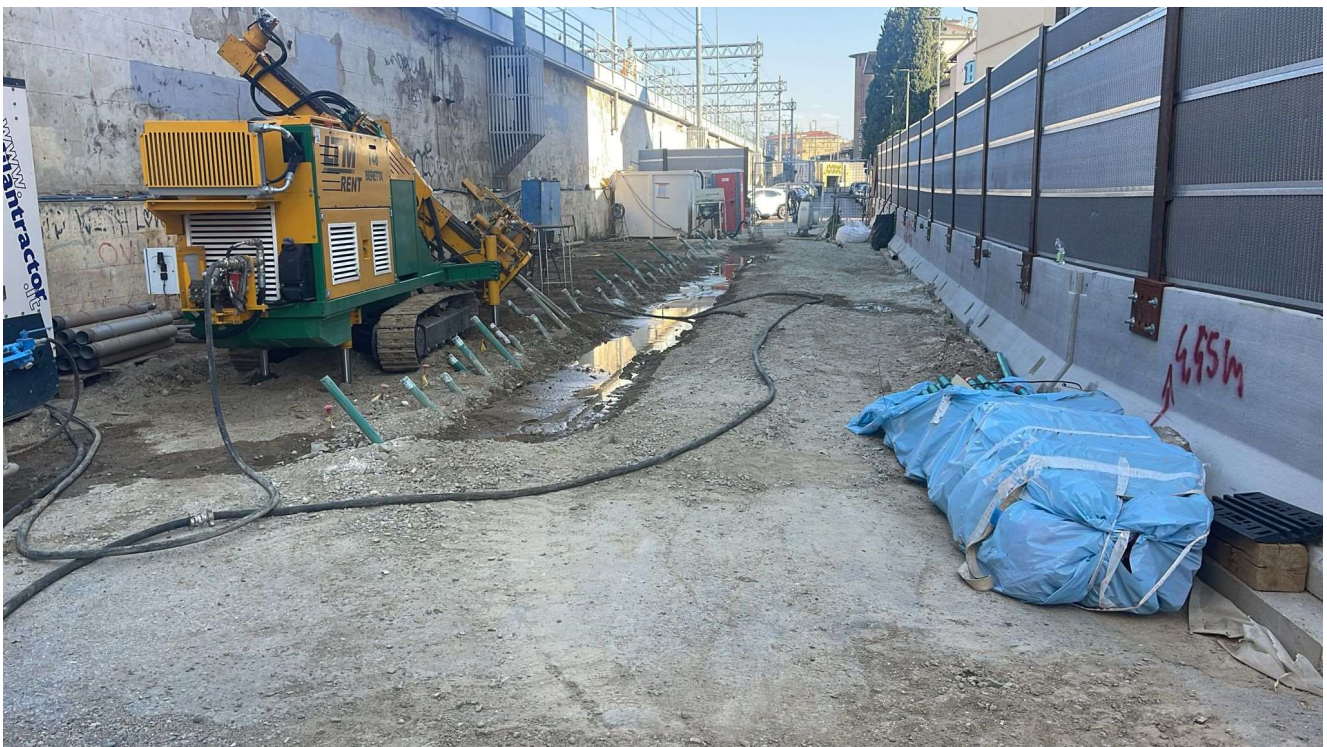
Figura 13 - Via delle Ghiacciaie