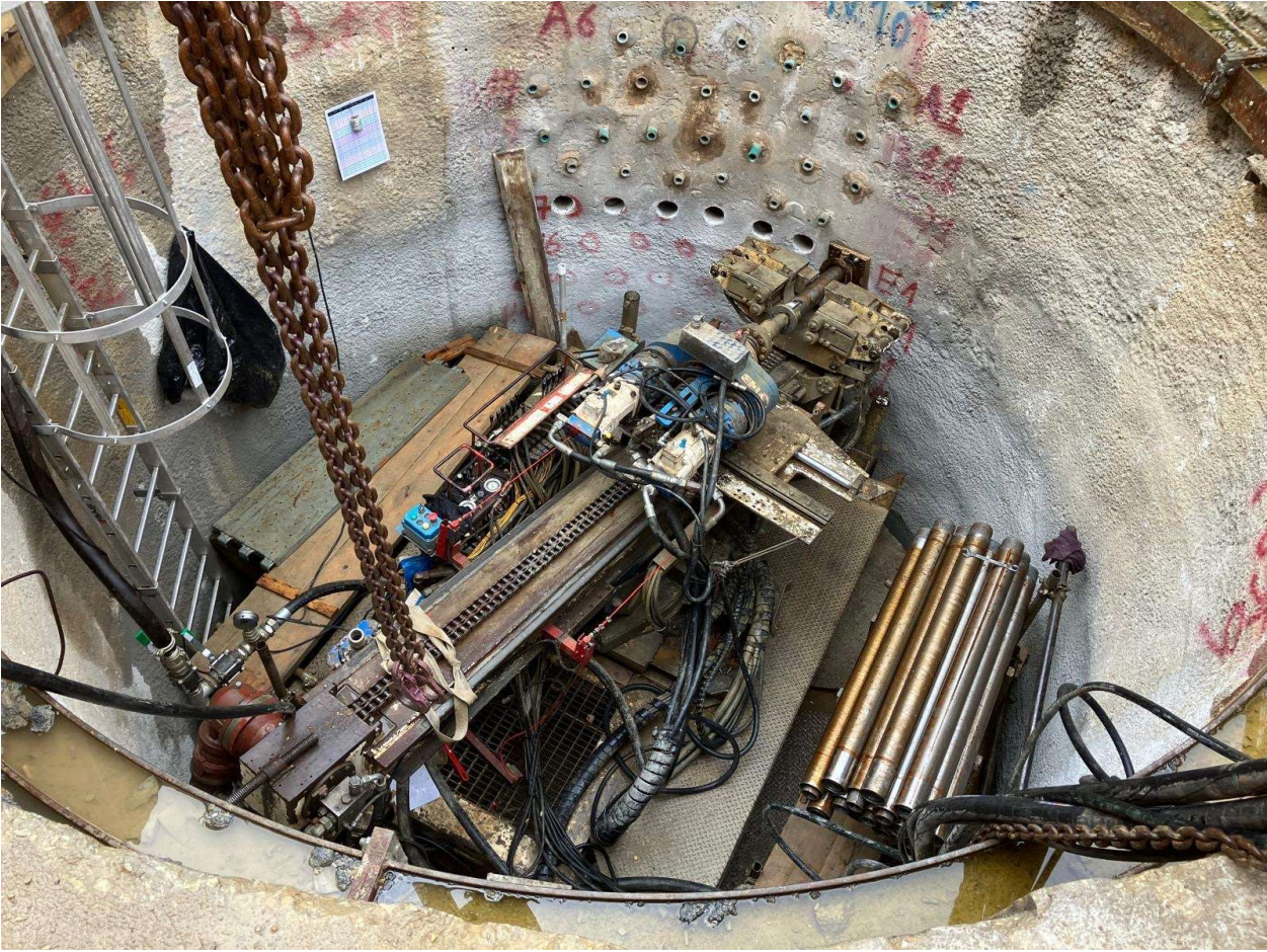
Figura 12 - Pozzo Via Cittadella