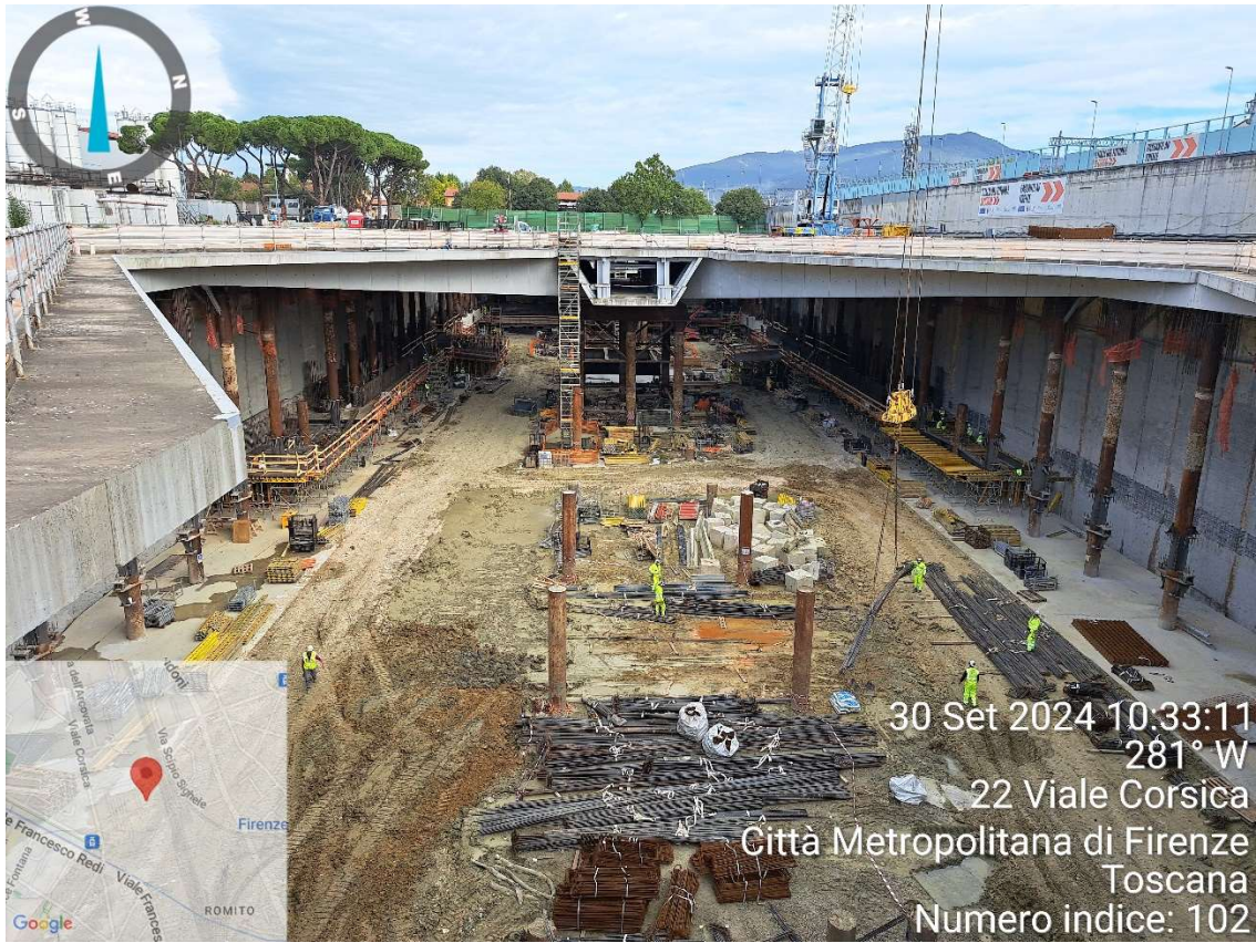
Figura 3 - Stazione AV