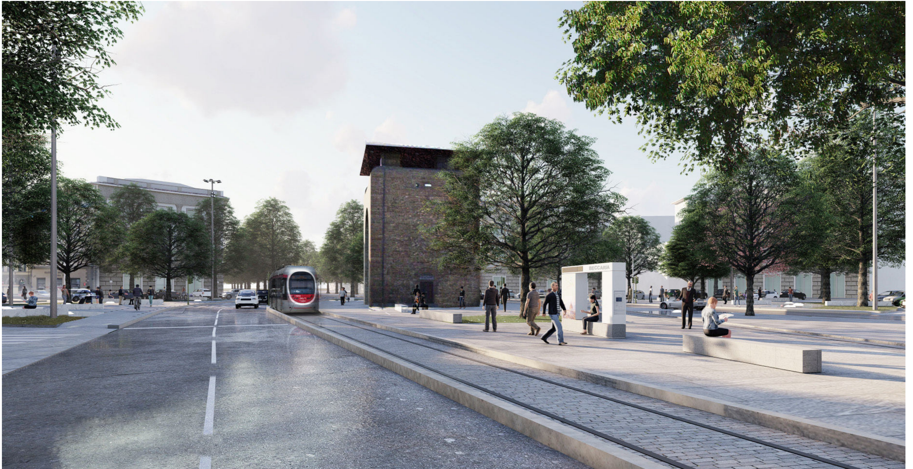
Piazza Beccaria | Render 2 - stato progetto revisionato