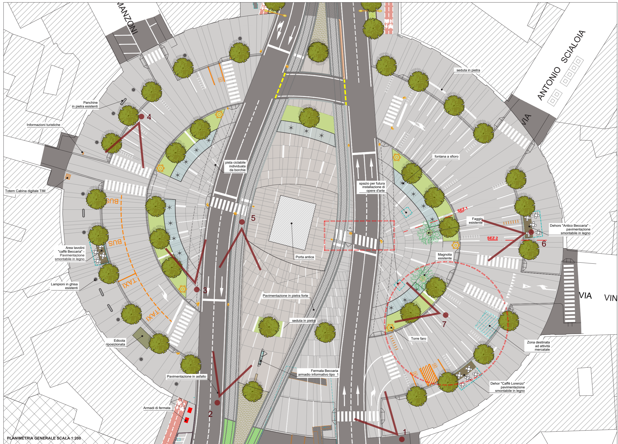
Piazza Beccaria | Planimetria - stato di progetto revisionato