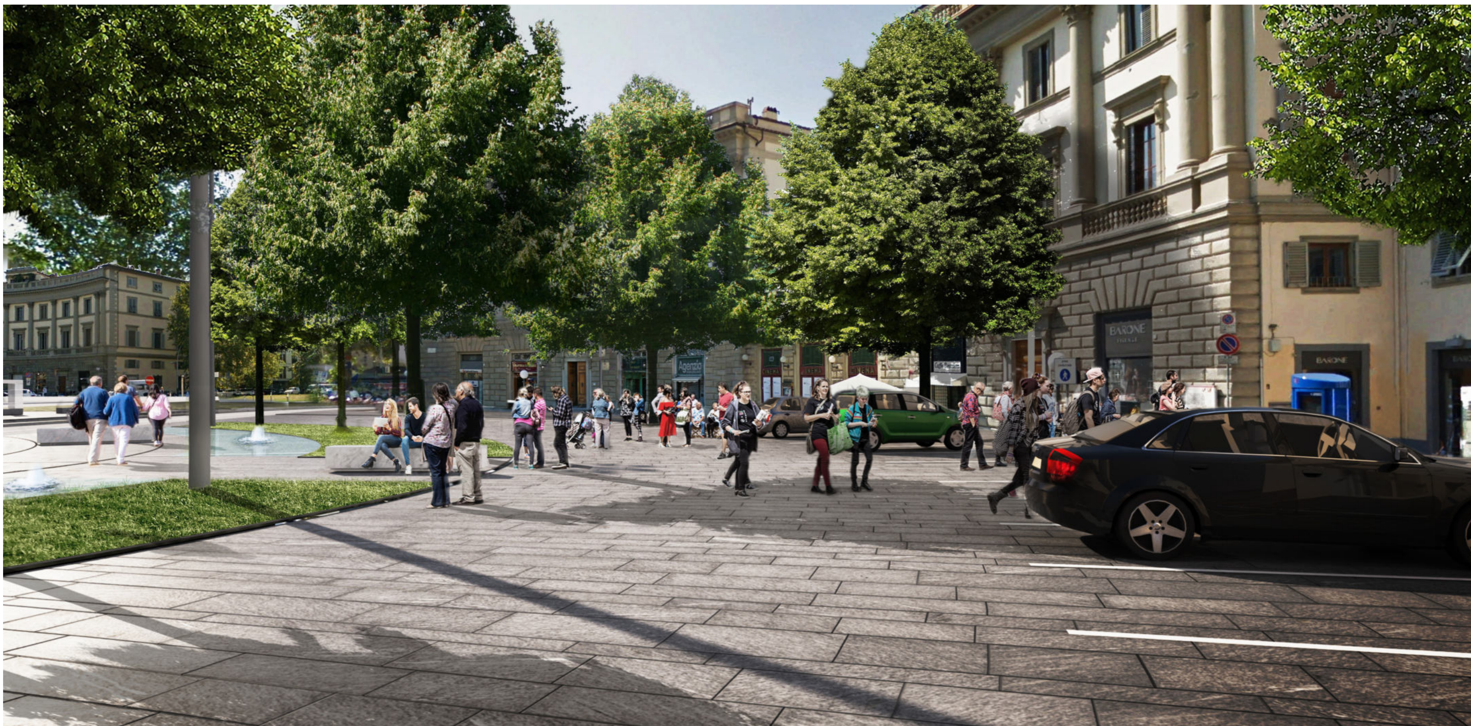
Piazza Beccaria | Render 4 - stato progetto revisionato