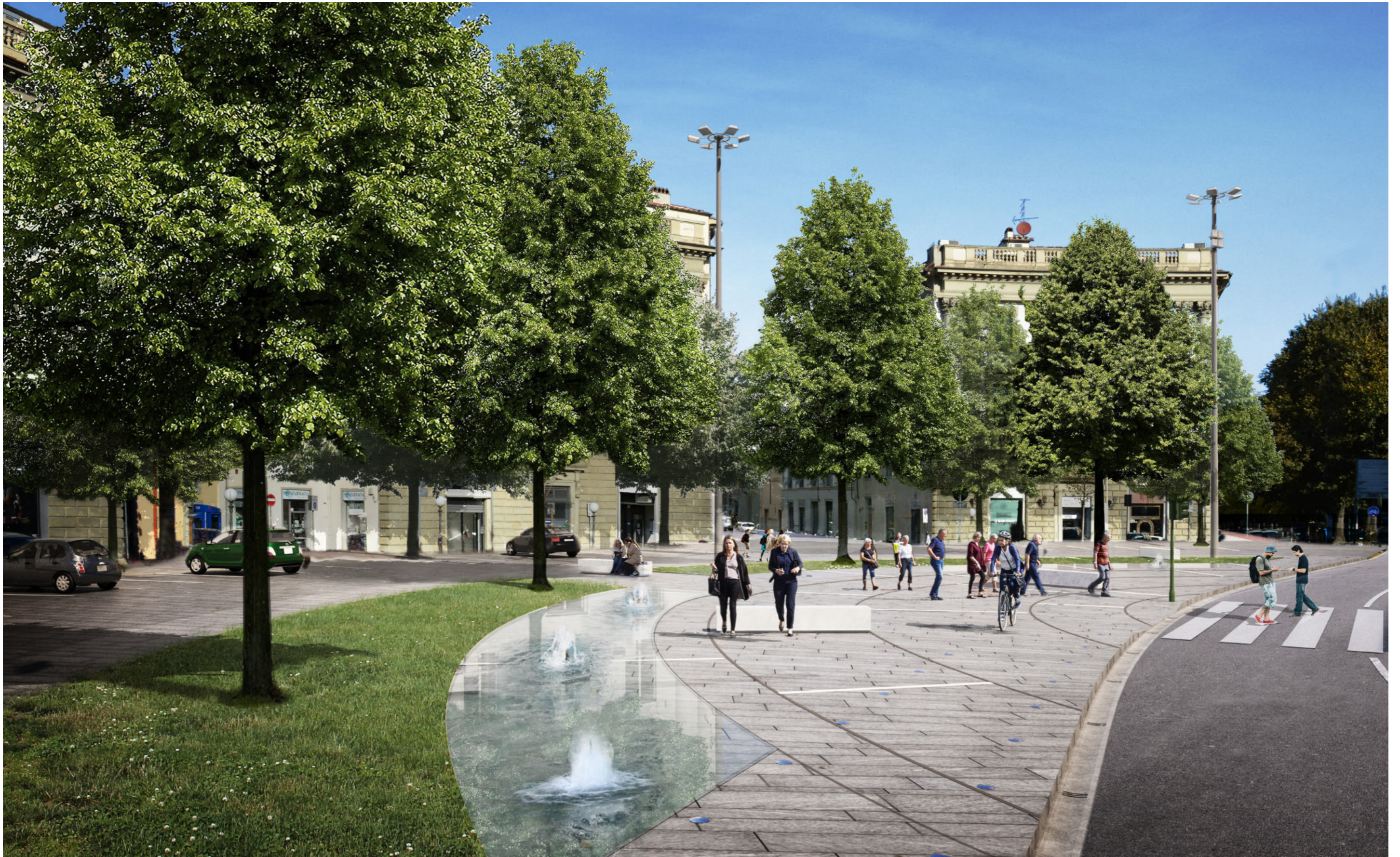
Piazza Beccaria | Render 3 - stato progetto revisionato