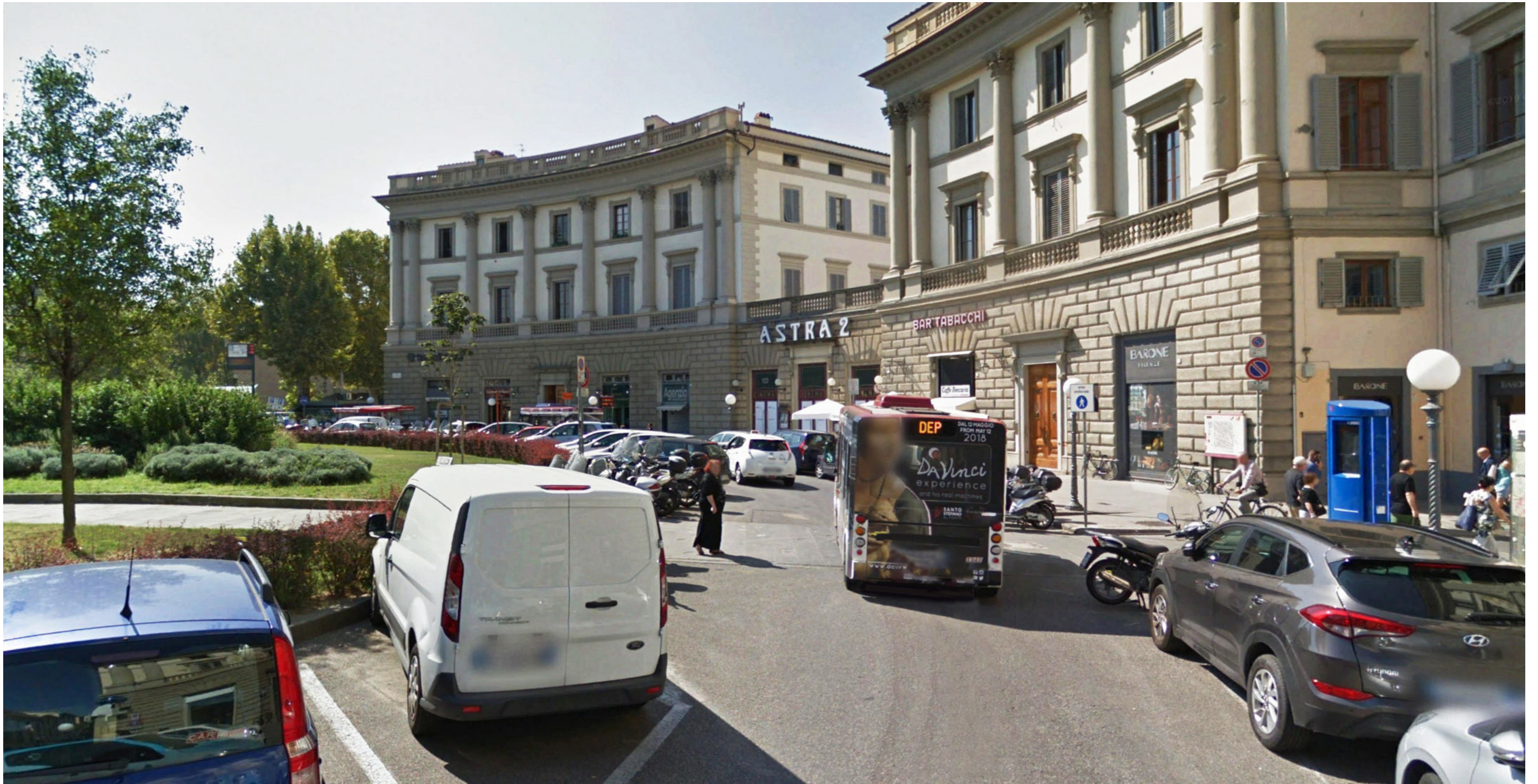
Piazza Beccaria | Foto 4 - stato attuale