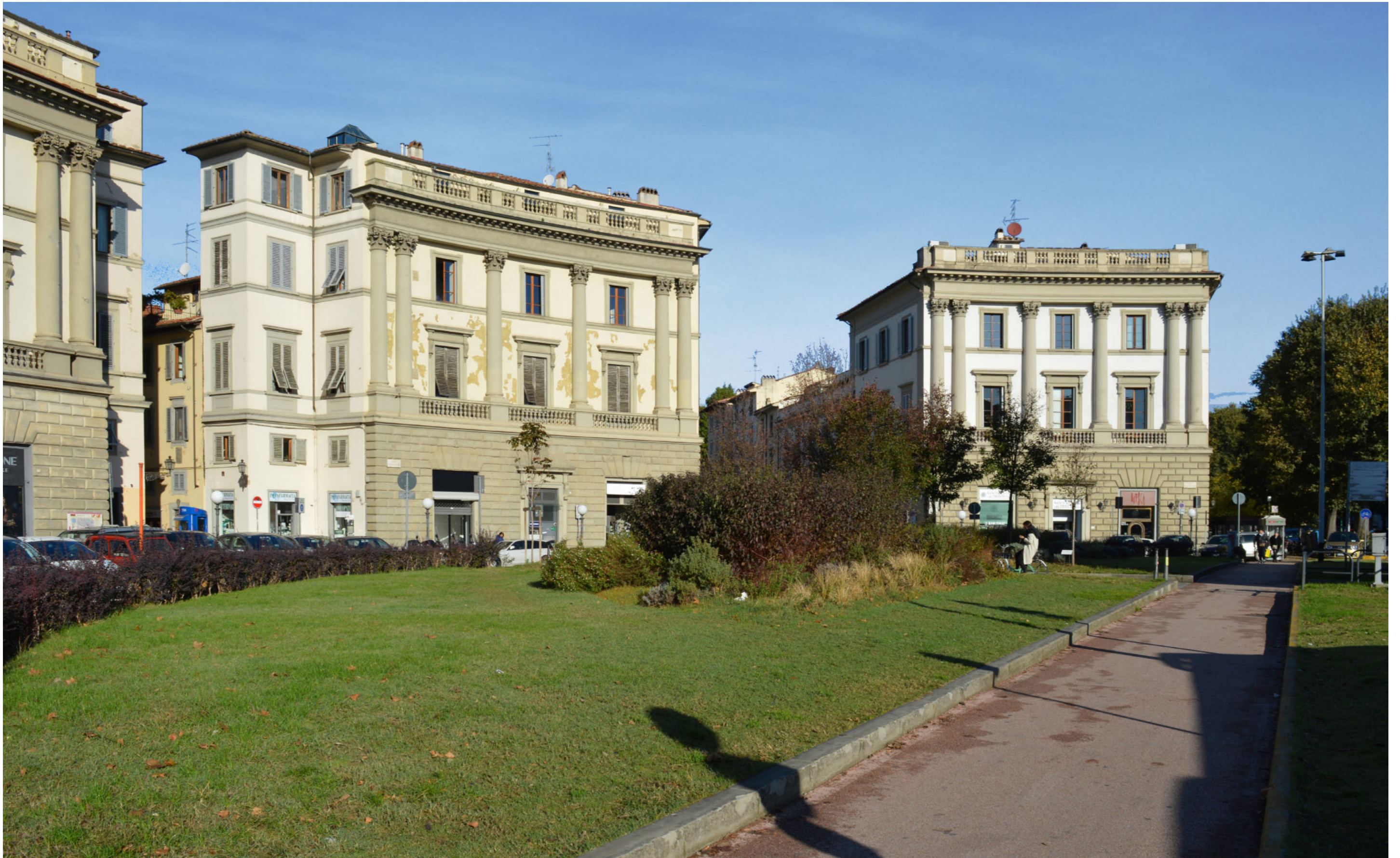
Piazza Beccaria | Foto 3 - stato attuale