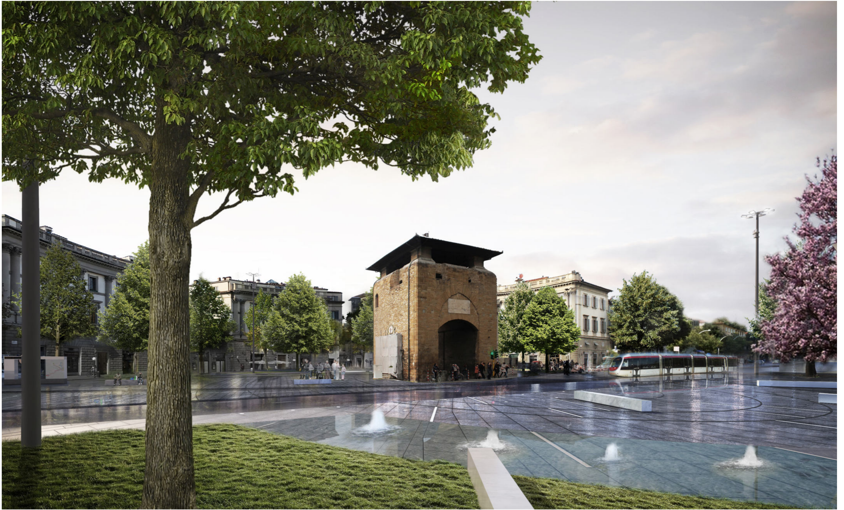
Piazza Beccaria | Render 7 - stato progetto revisionato