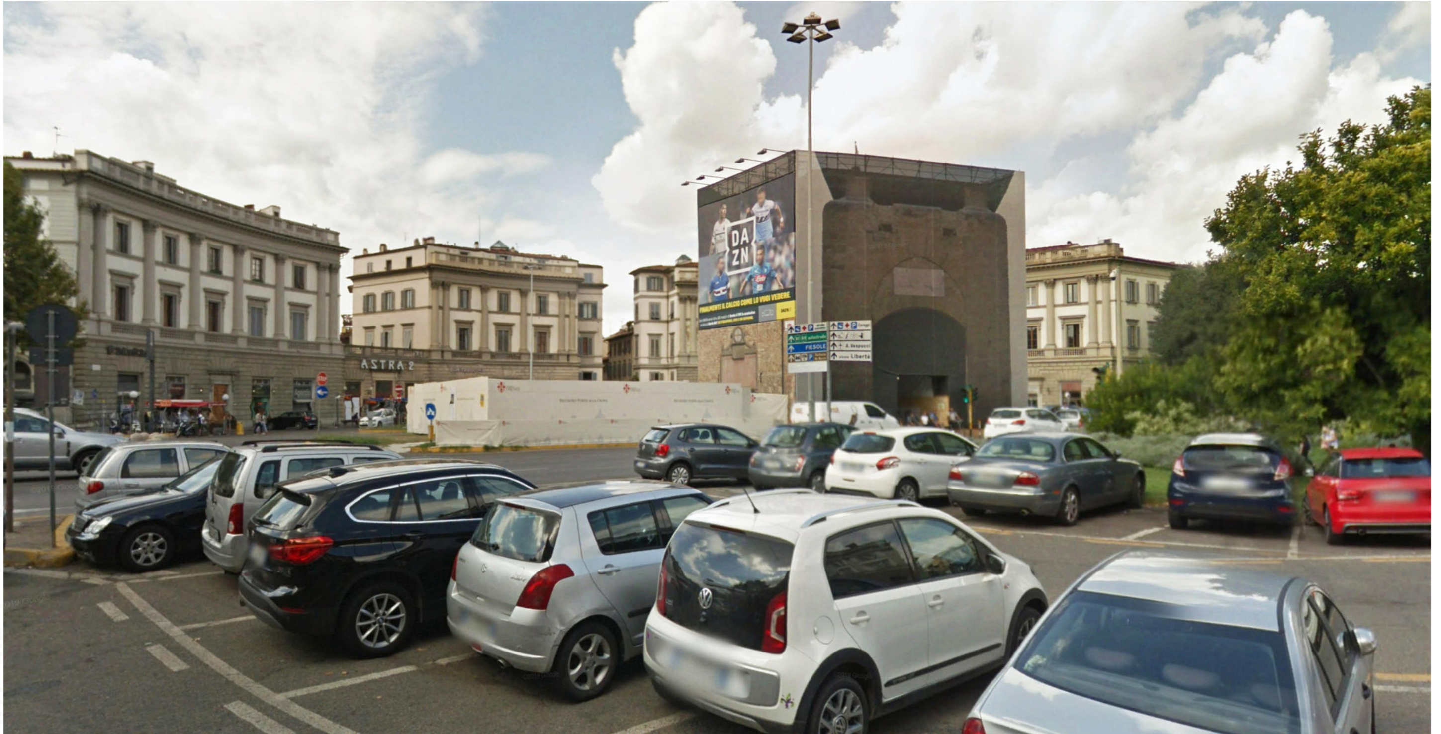
Piazza Beccaria | Foto 7 - stato attuale