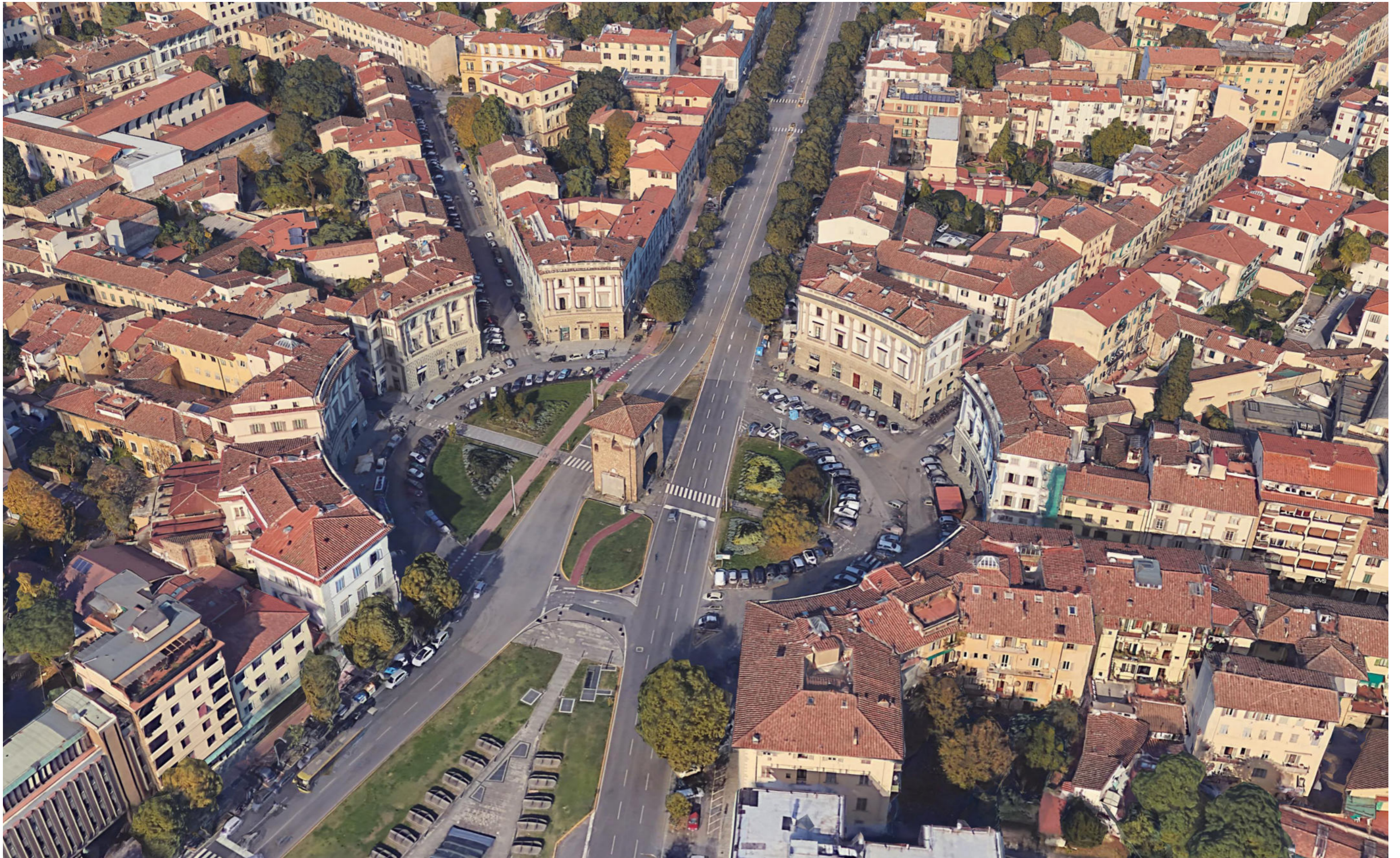
Piazza Beccaria | Immagine a volo 1 - stato attuale