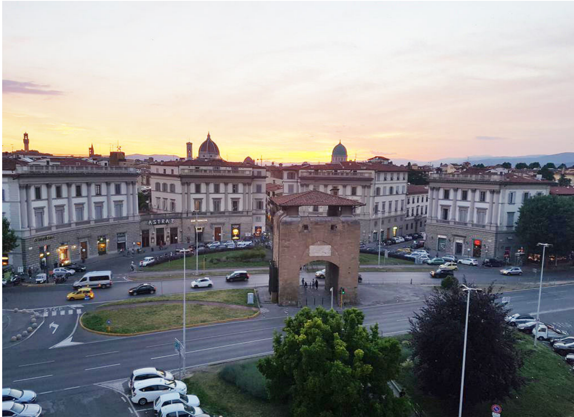
Piazza Beccaria | Foto 6 - stato attuale