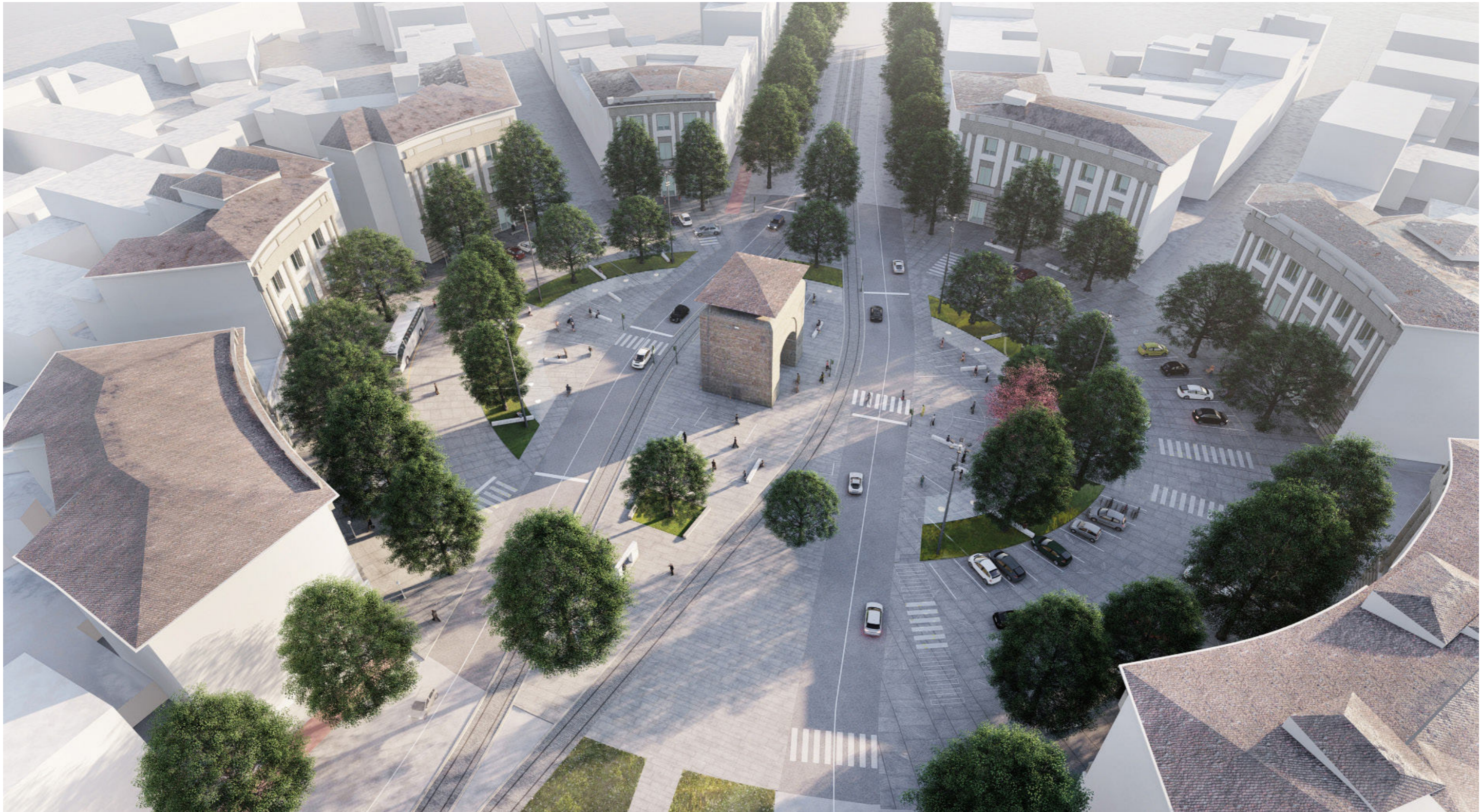
Piazza Beccaria | Render a volo 1 - stato progetto revisionato