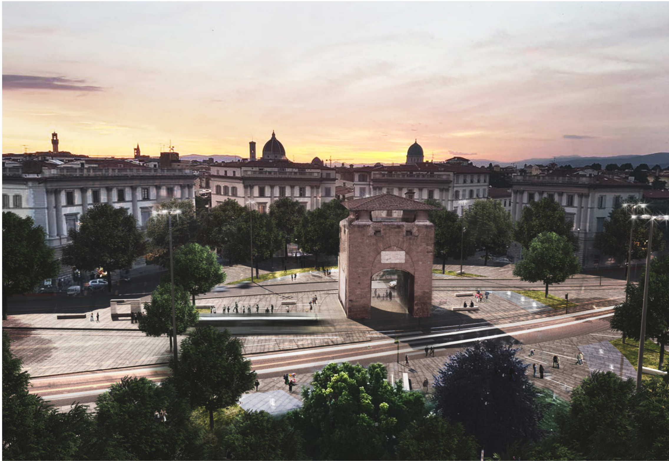
Piazza Beccaria | Render 6 - stato progetto revisionato