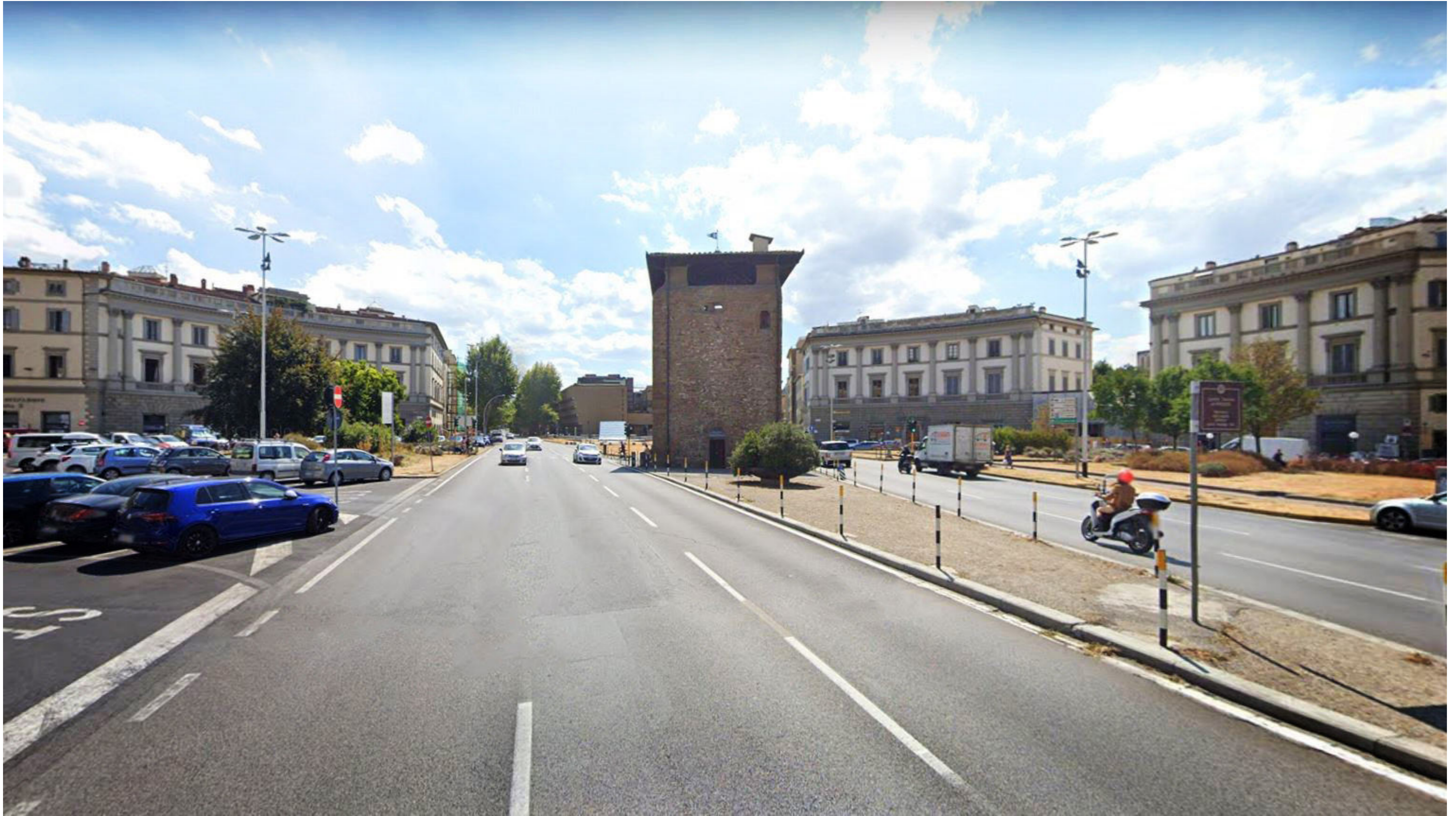
Piazza Beccaria | Foto 2 - stato attuale