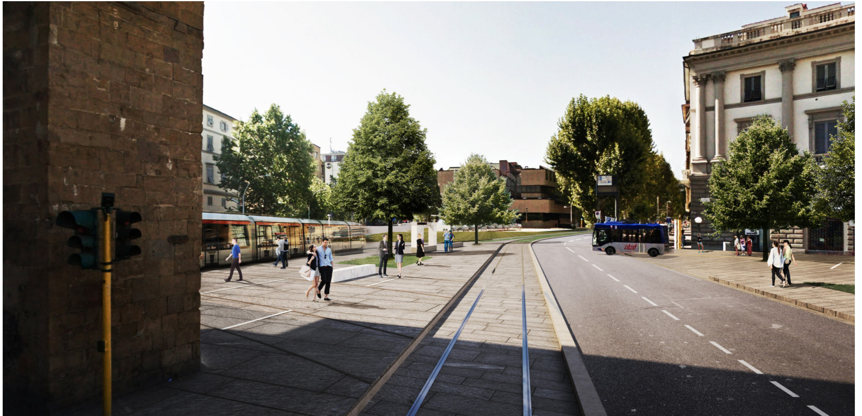
Piazza Beccaria | Render 5 - stato progetto revisionato