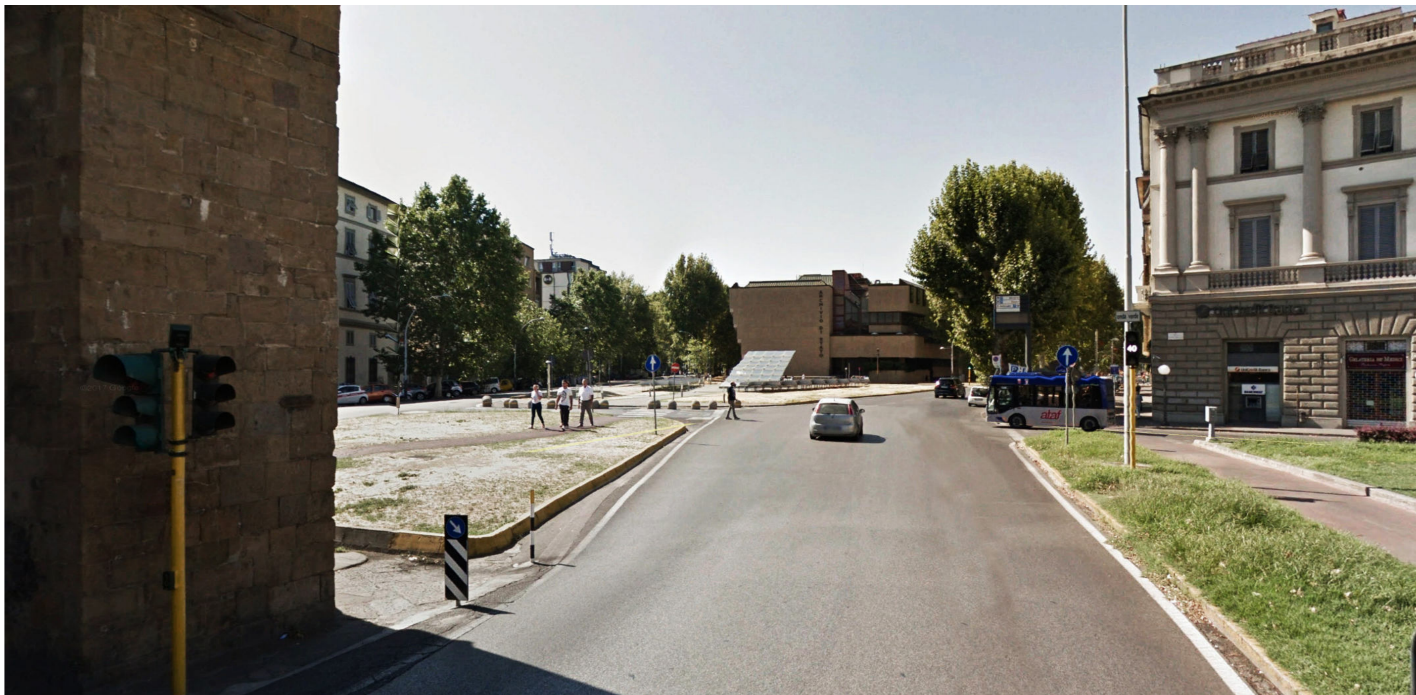
Piazza Beccaria | Foto 5 - stato attuale