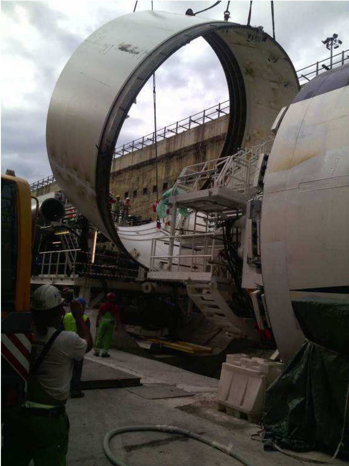
Foto 2 - Montaggio TBM