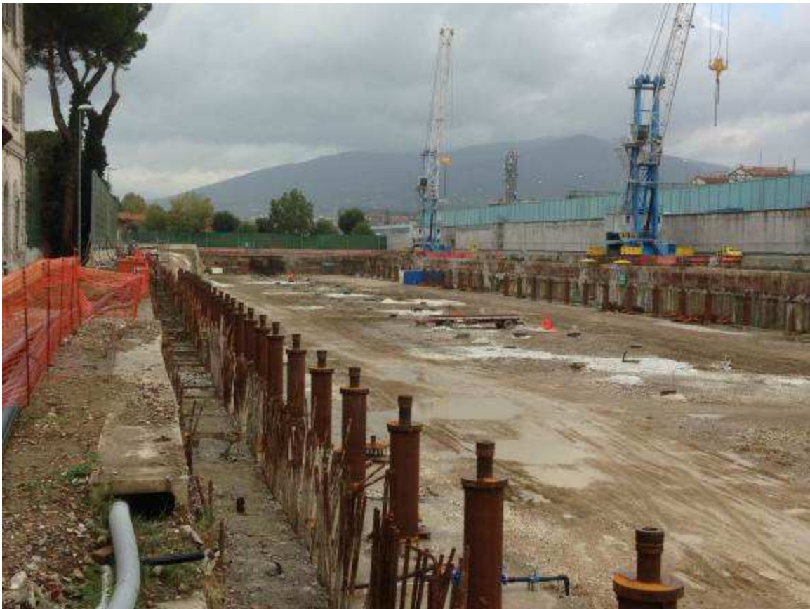
Foto 1 - Posa carpenterie metalliche a sostegno del Solaio Piano Terra