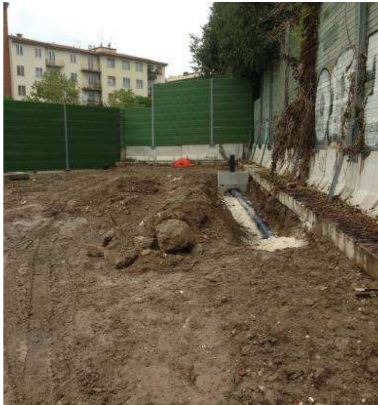
Foto 2 - Impianto di aggotamento acque