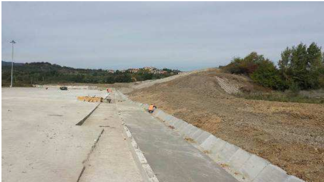
Foto 10 - Completamento Terminal Bricchette