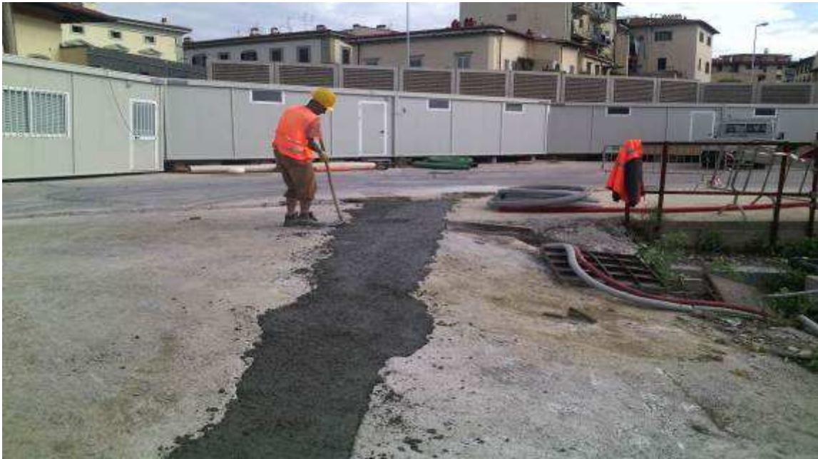
Foto 5 - Regimazione acque al di sopra del pozzo lancio Fresa