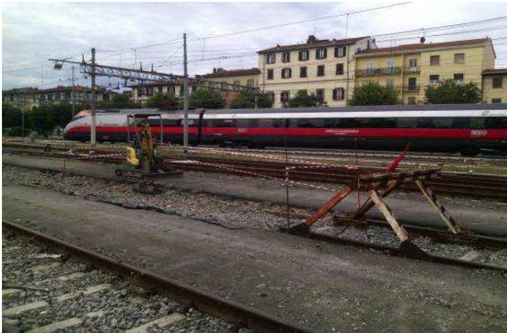
Foto 7 - Adeguamento del Raccordo Ferroviario di Campo di Marte