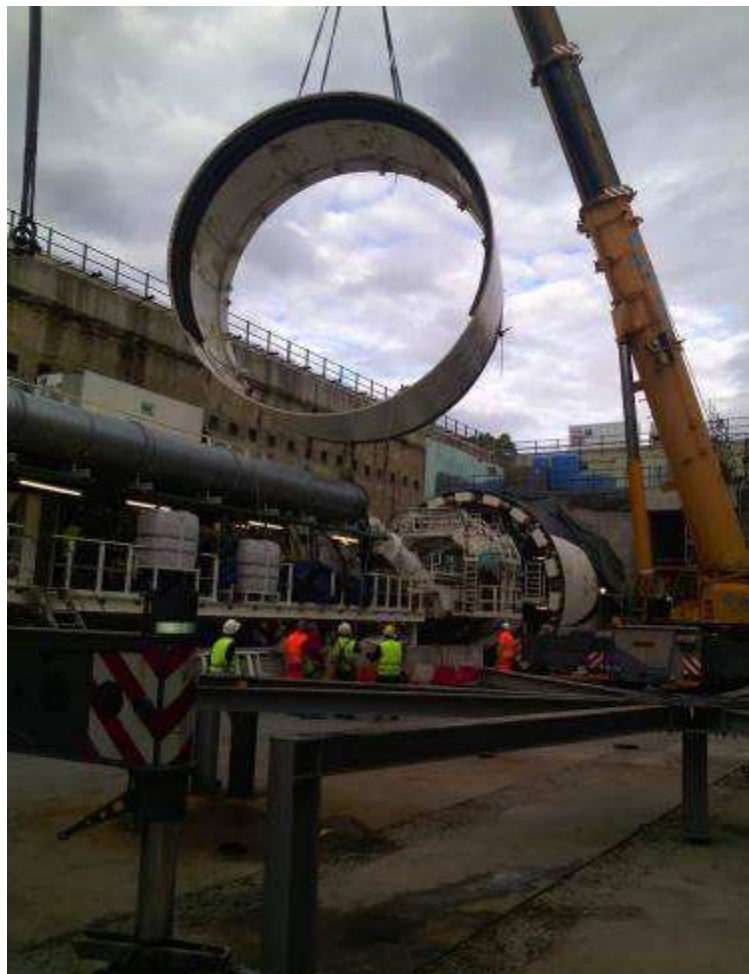
Foto 1 - Montaggio TBM