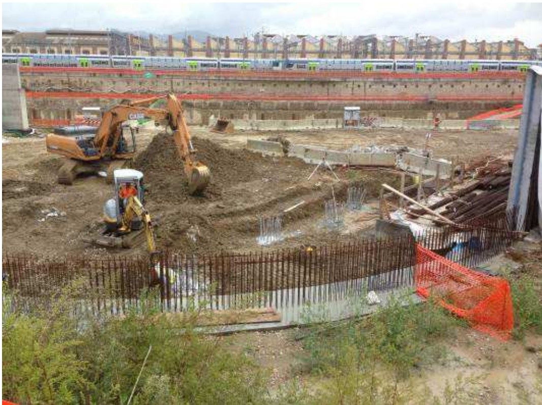
Foto 3 - Pulizia teste pali di fondazione rampa Kiss&Ride