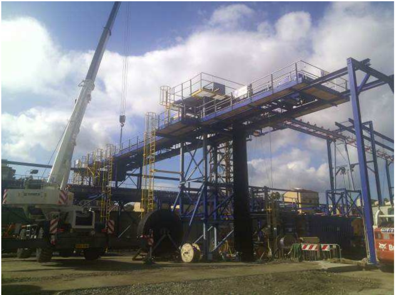
Foto 1 - Montaggio TBM