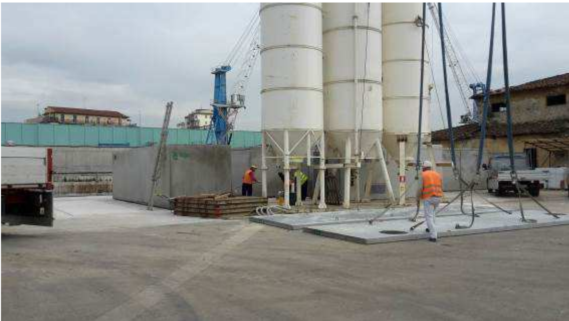
Foto 3 - Impianto di aggotamento acque