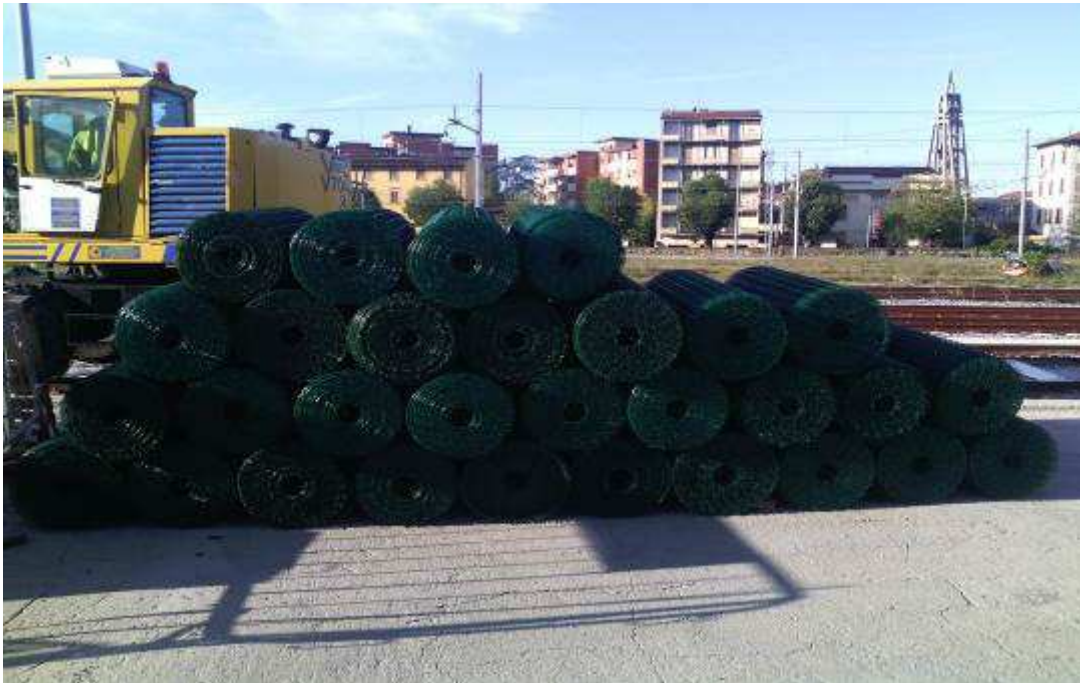
Foto 5 - Adeguamento del Raccordo Ferroviario di Campo di Marte