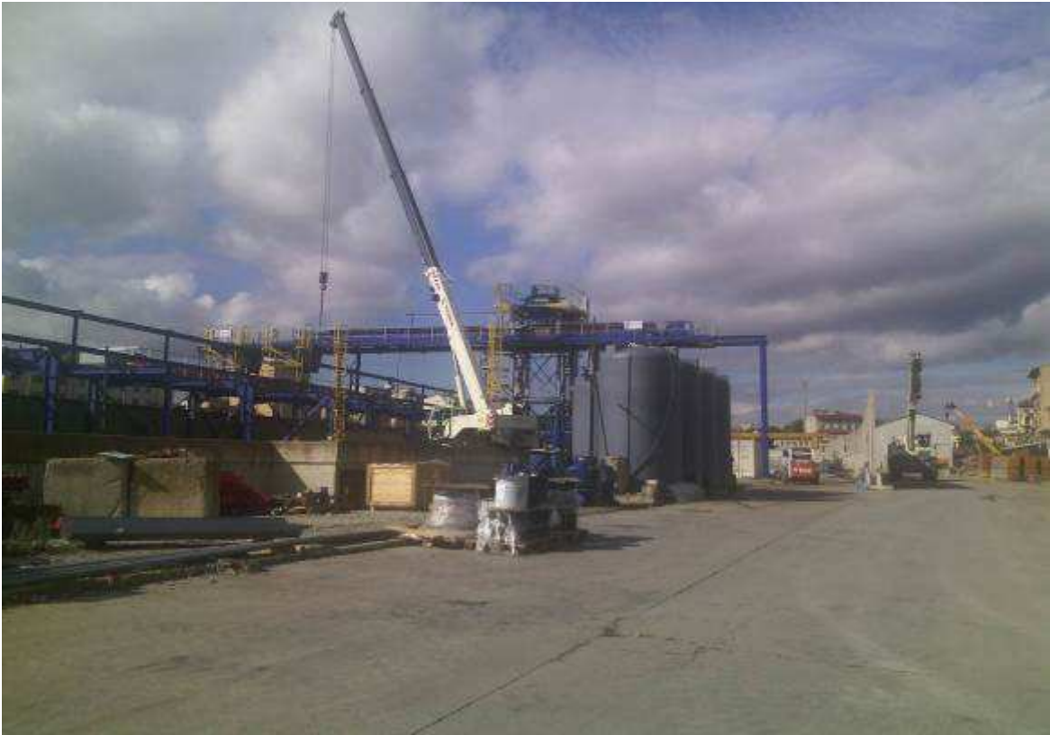
Foto 2 - Montaggio TBM