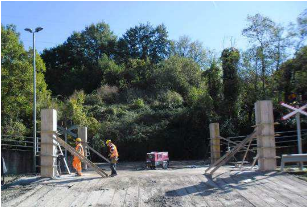
Foto 7 – Raccordo Ferroviario Terminal Bricchette – Cancelli attraversamento ENEL