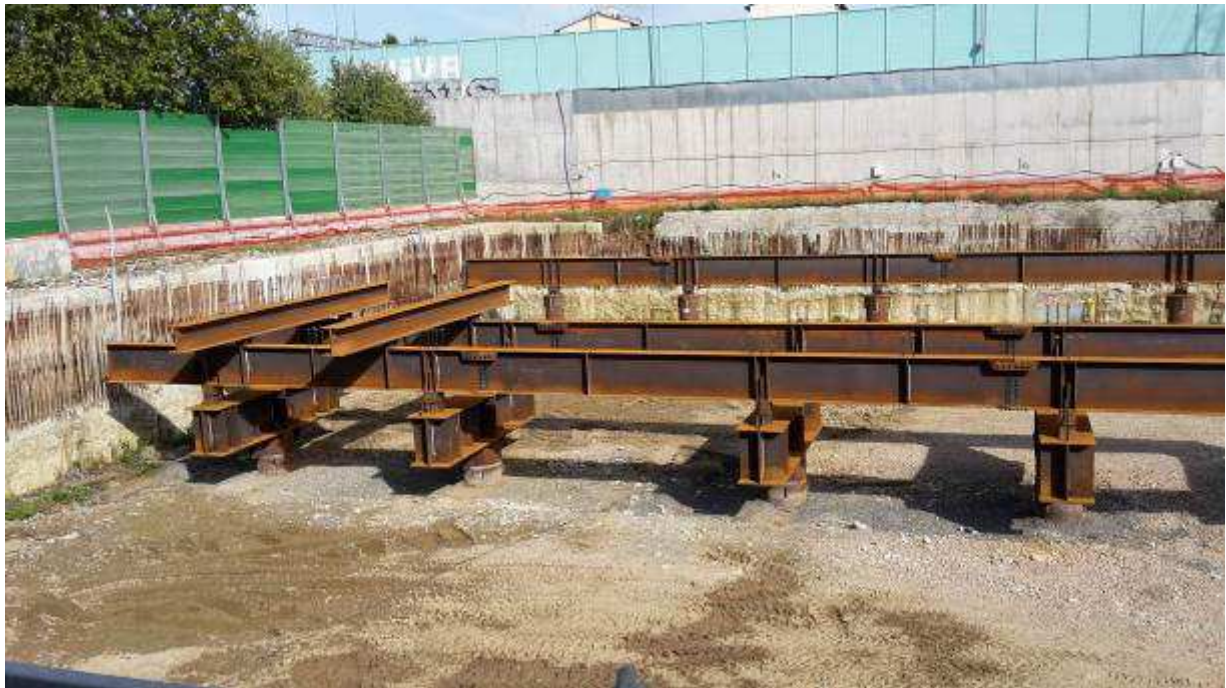
Foto 1 - Posa carpenterie metalliche a sostegno del Solaio Piano Terra