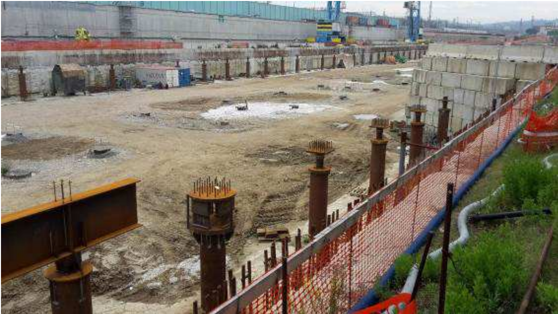
Foto 2 - Posa carpenterie metalliche a sostegno del Solaio Piano Terra