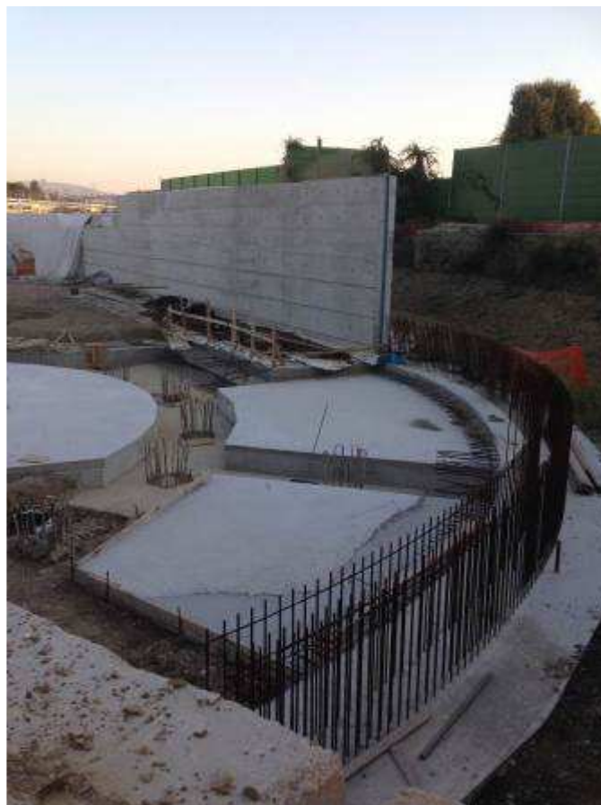
Foto 5 - Pulizia teste pali fondazione rampa Kiss&Ride e magronature