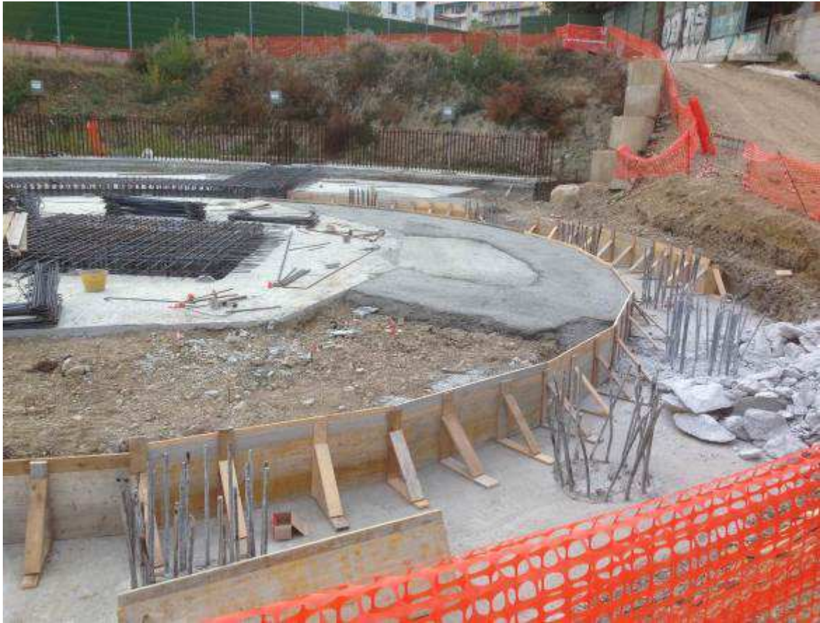
Foto 2 - Sottofondazioni rampa Kiss&Ride