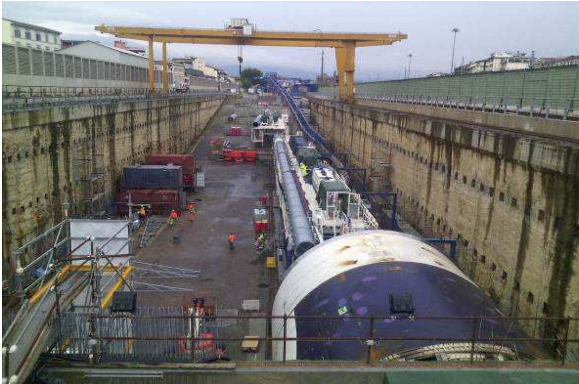
Foto 2 - Montaggio TBM