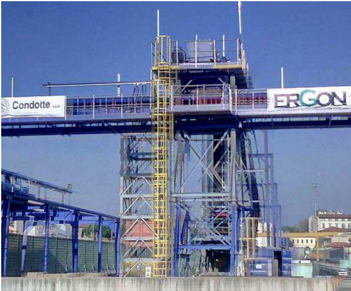
Foto 1 - Montaggio TBM