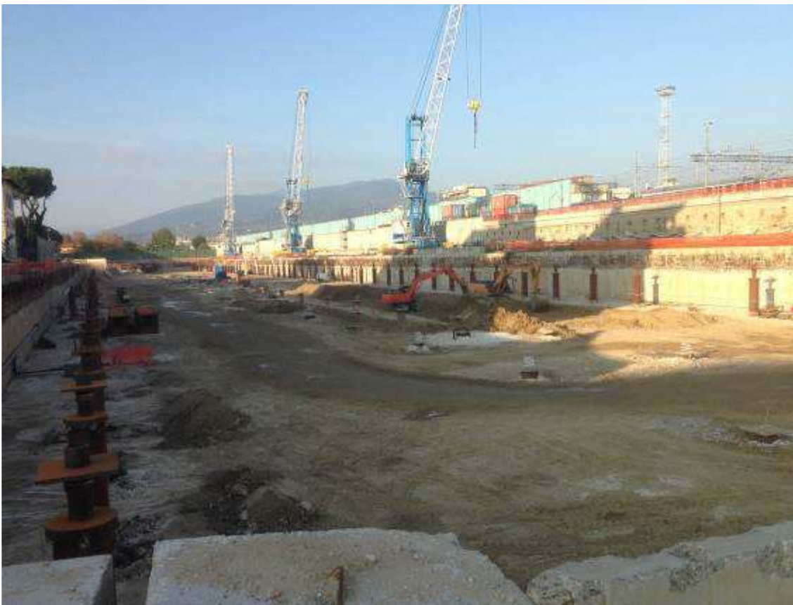
Foto 1 - Scavi approfondimento interni al Camerone di Stazione AV