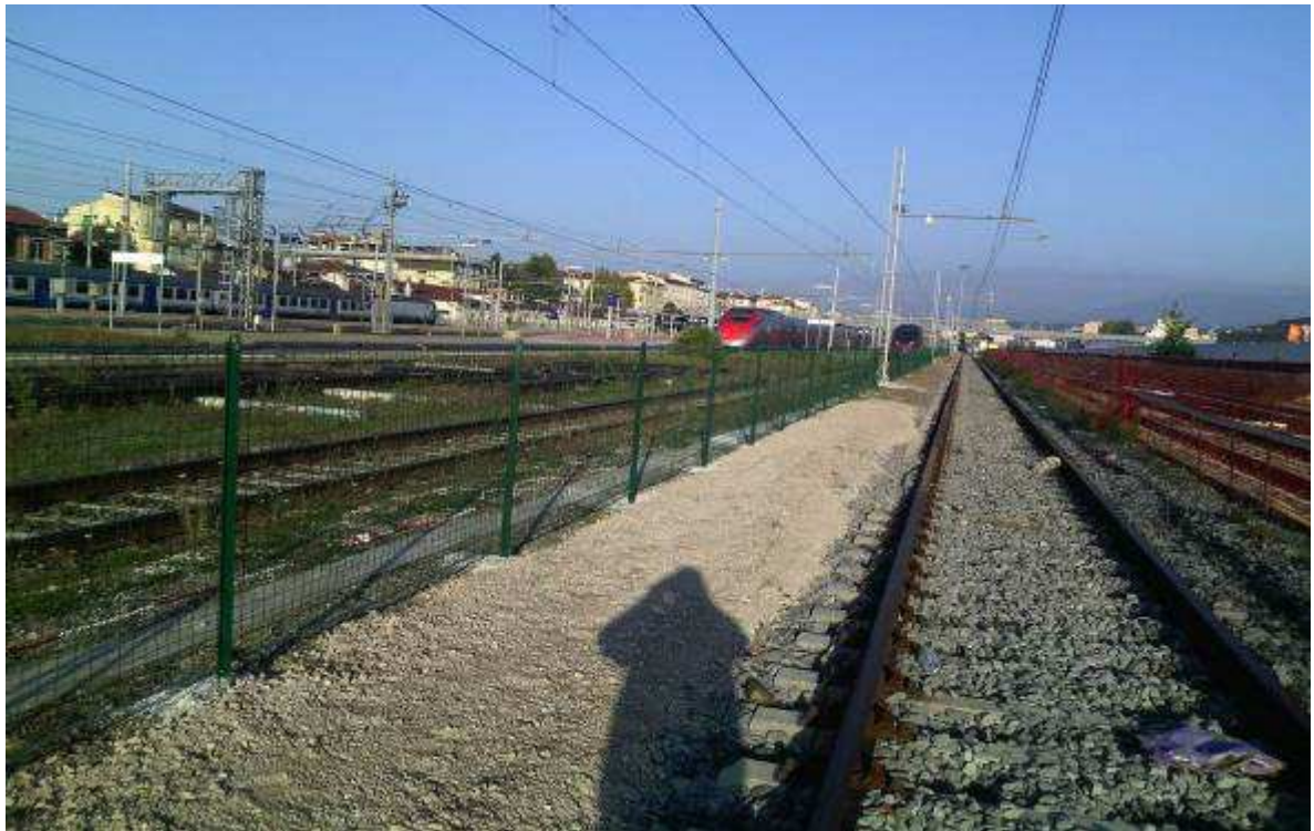
Foto 5 - Adeguamento del Raccordo Ferroviario di Campo di Marte