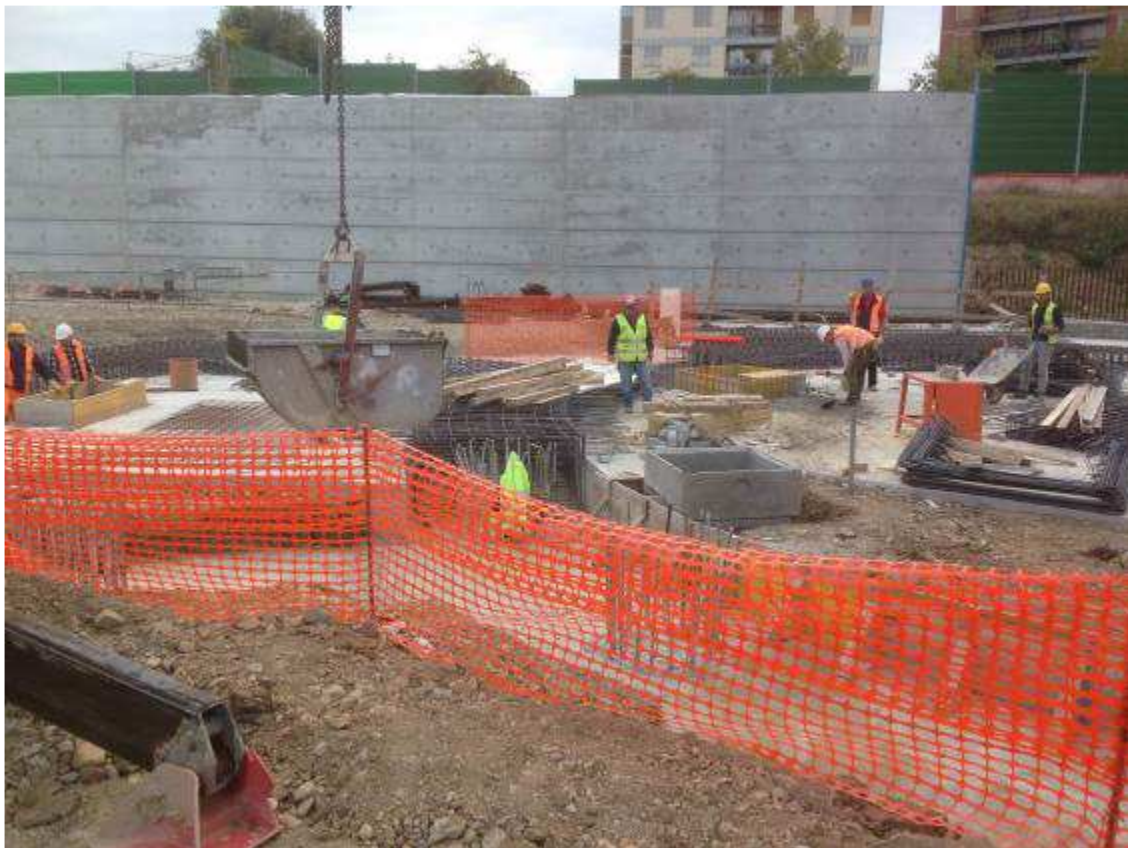
Foto 3 - Posa Armature Fondazione rampa Kiss&Ride