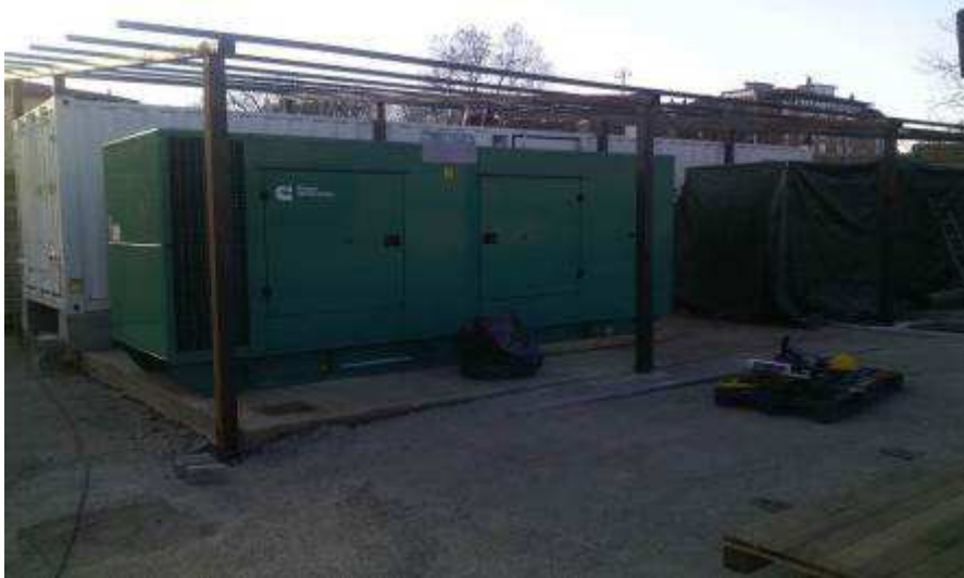
Foto 2 – Collegamento gruppi elettrogeni d'emergenza zona Pratellino