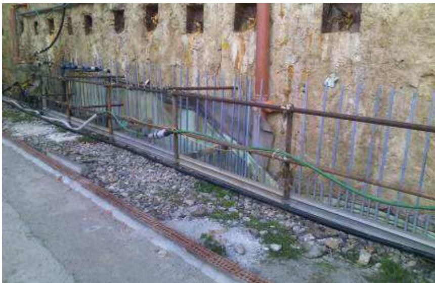
Foto 4 - Messa in sicurezza parapetti e controllo