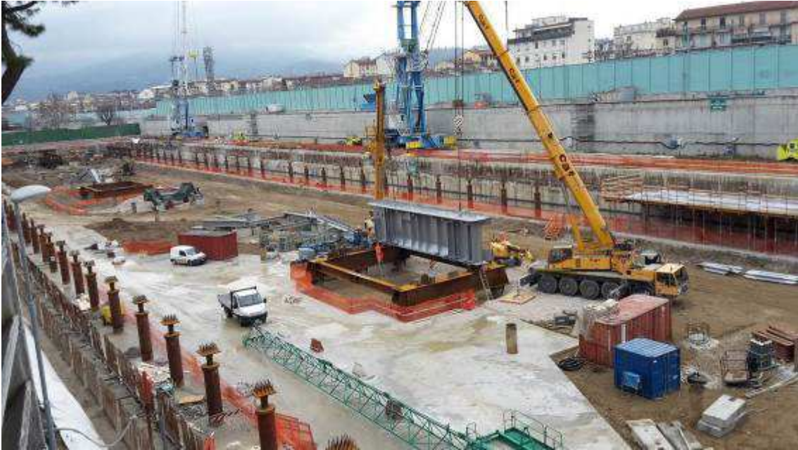
Foto 4 – Montaggio carpenterie metalliche Solaio Piano Terra - Cassone asse 17