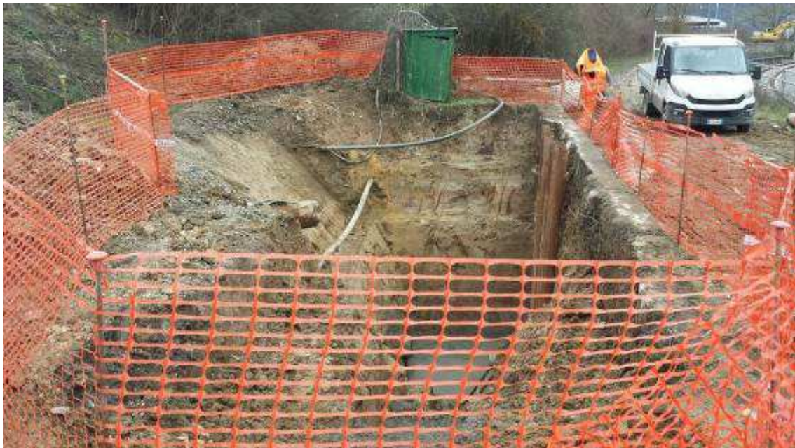
Foto 6 – Risoluzione interferenza antincendio Enel - Pozzetto di arrivo