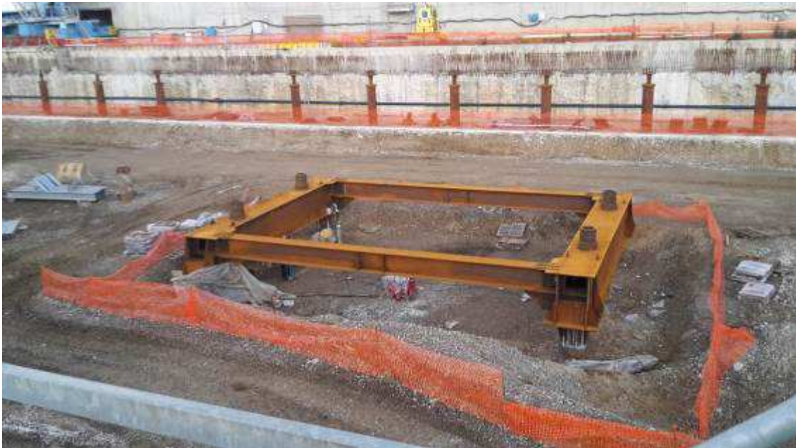
Foto 5 – Montaggio carpenterie metalliche Solaio Piano Terra - Strutture Provvisorie asse 9