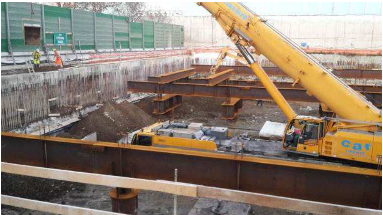
Foto 1 – Taglio del cordolo guida esterno dei diaframmi Camerone di Stazione AV