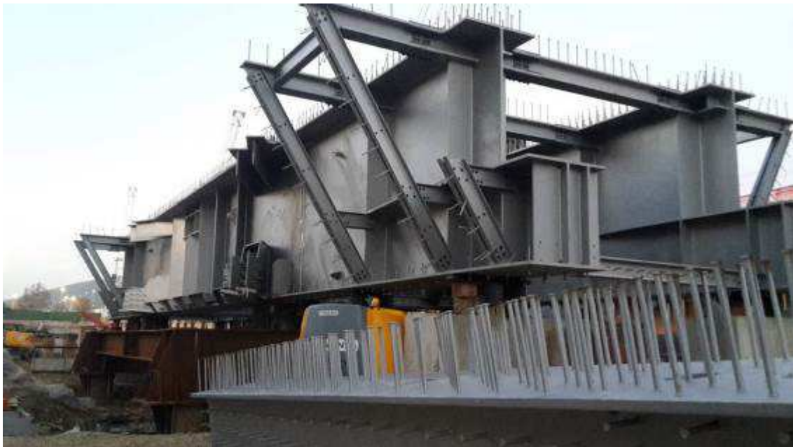
Foto 3 – Montaggio carpenterie metalliche Solaio Piano Terra - Cassone asse 25