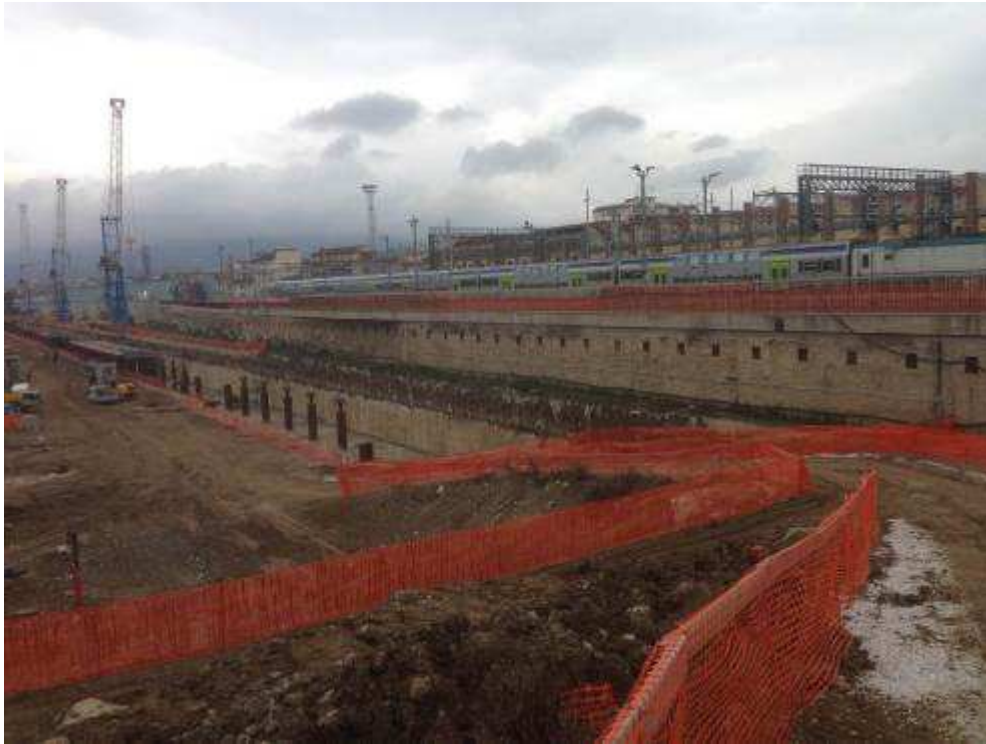
Foto 2 – Scapitozzatura della testa dei diaframmi Camerone di Stazione AV