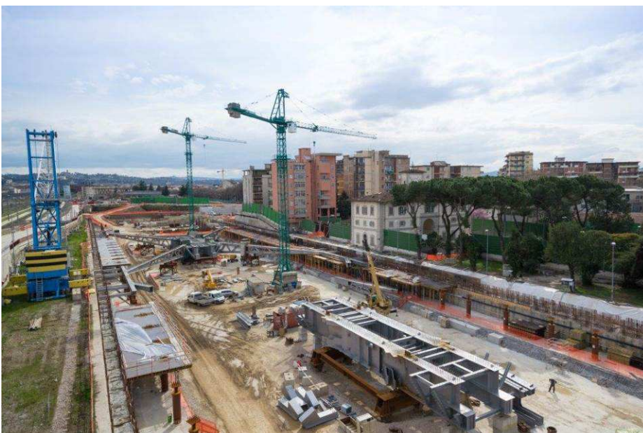
Foto 4 – Montaggio carpenterie metalliche Solaio Piano Terra – Ventagli asse 17 e 25