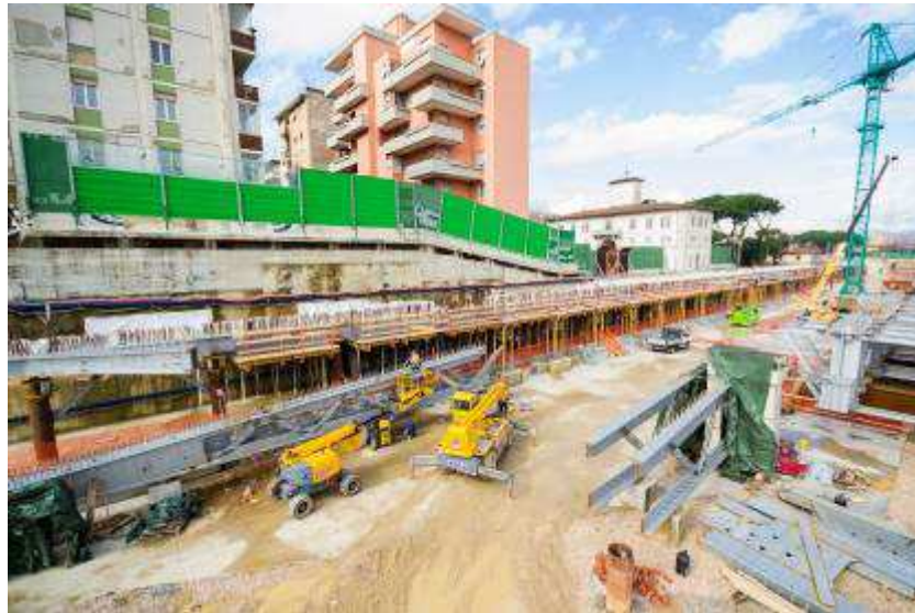
Foto 5 – Montaggio banchinaggi per getto trave cuscino Ventaglio asse 25 lato OVEST