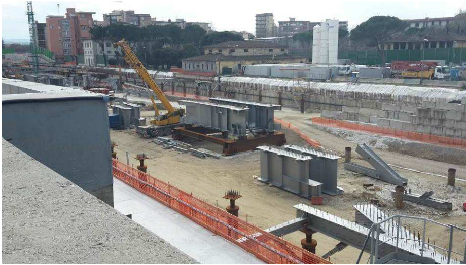
Foto 2 – Montaggio carpenterie metalliche Solaio Piano Terra – Cassone asse 9