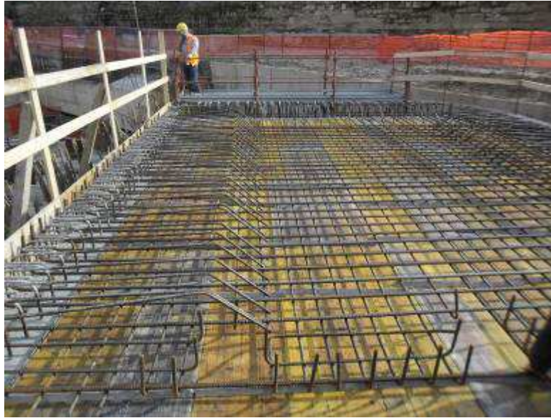
Foto 8 – Realizzazione vasca di accumulo acque meteoriche presso la Rampa K&R