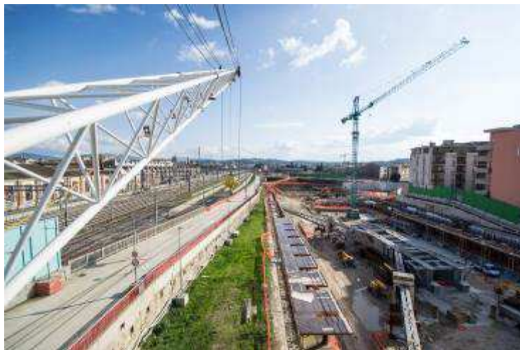
Foto 6 – Montaggio banchinaggi per getto trave cuscino Ventaglio asse 25 lato EST