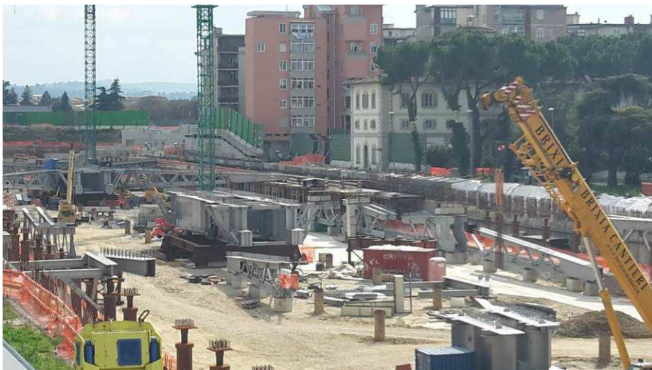
Foto 3 – Montaggio carpenterie metalliche Solaio Piano Terra – Cassone asse 17