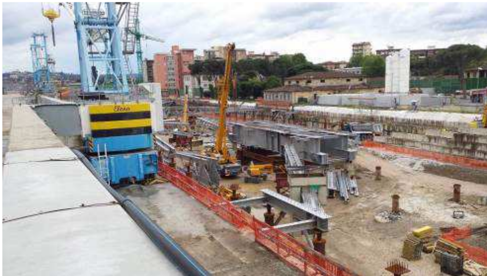
Foto 3 – Montaggio carpenterie metalliche Solaio Piano Terra – Cassone asse 9