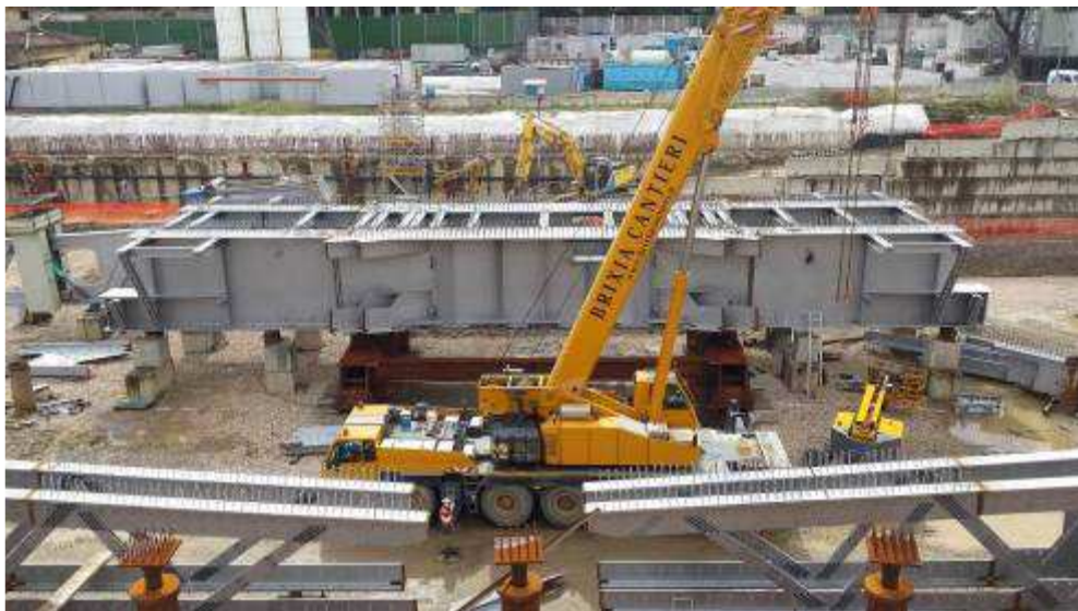
Foto 4 – Montaggio carpenterie metalliche Solaio Piano Terra – Ventaglio asse 9