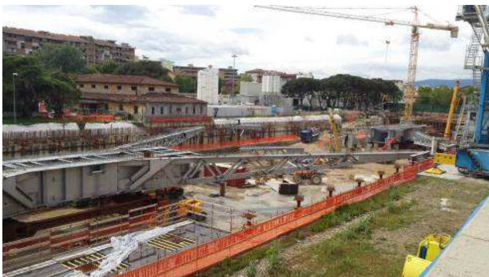
Foto 5 – Montaggio carpenterie metalliche Solaio Piano Terra – Ventaglio asse 17 e 9