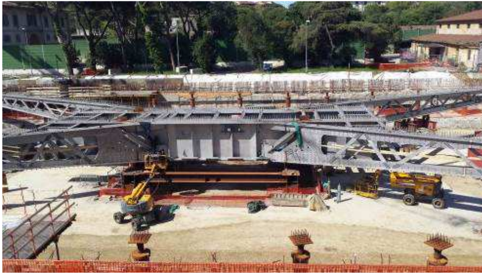
Foto 6 – Montaggio carpenterie metalliche Solaio Piano Terra – Ventaglio asse 17