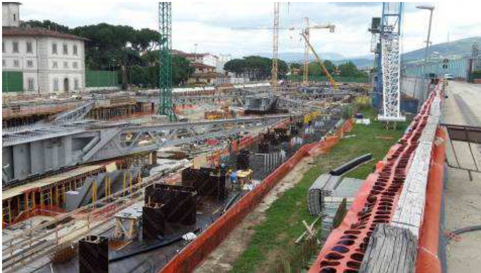
Foto 5 – Banchinaggio e Montaggio armatura Trave cuscino Fili 21-29 lato Est