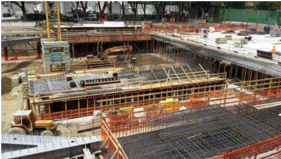
Foto 3 – Banchinaggio e montaggio armatura Cassone centrale Filo 4-5