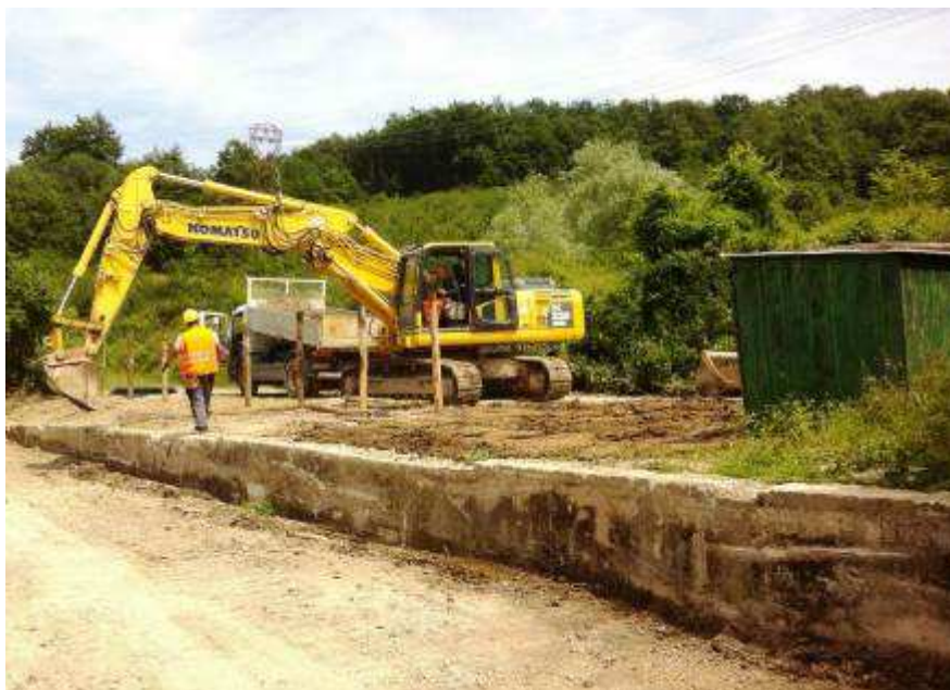
Foto 2 – sistemazione dell'area del Pozzetto di arrivo dello spingitubo – Risoluzione interferenza ENEL