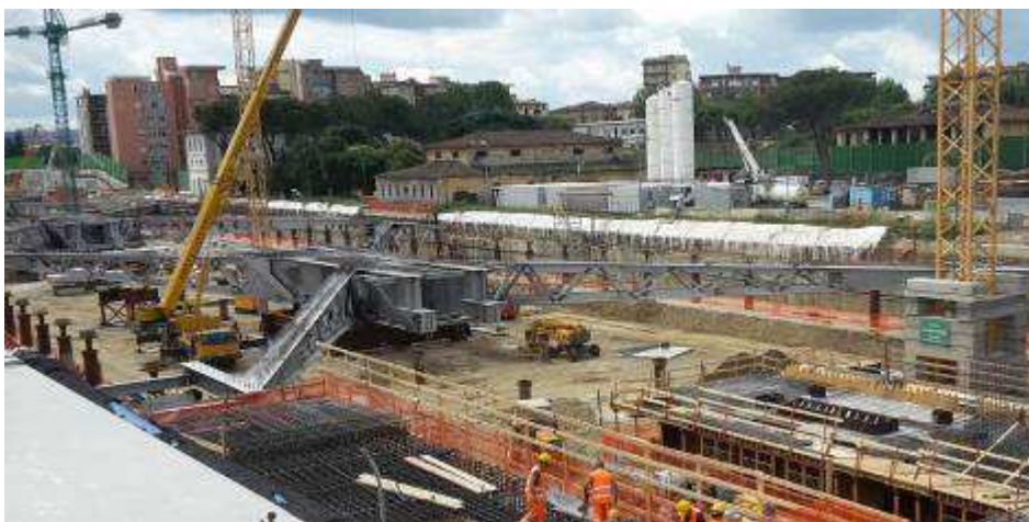
Foto 4 – Montaggio carpenterie metalliche Solaio Piano Terra – Cassone asse 9