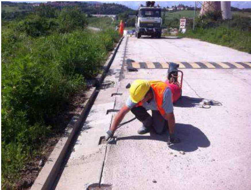
Foto 1 – Interventi per la Risoluzione della NC170 – Sigillatura con piastre di ancoraggio