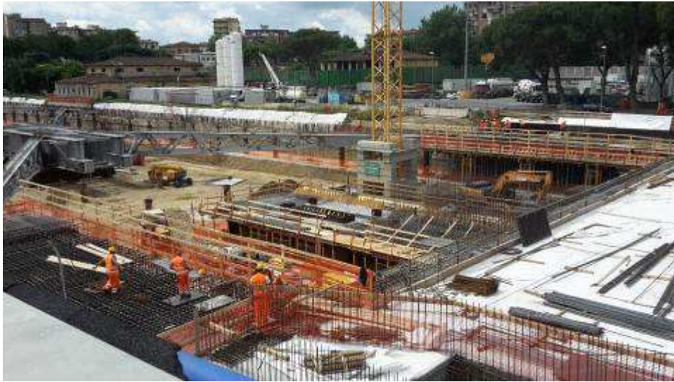
Foto 2 – Banchinaggio e montaggio armatura Trave cuscino Filo 4-5