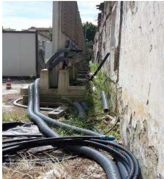
Foto 15 – Attività relative ai pozzi di continuità di falda – posa tubazioni