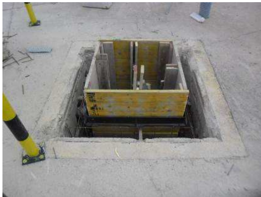
Foto 2 – Interventi per la Risoluzione della NC250 – Sostituzione chiusini Terminal