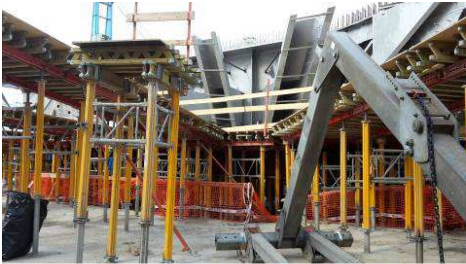
Foto 11 – Banchinaggio Travi intermedie e corte Ventaglio asse 25