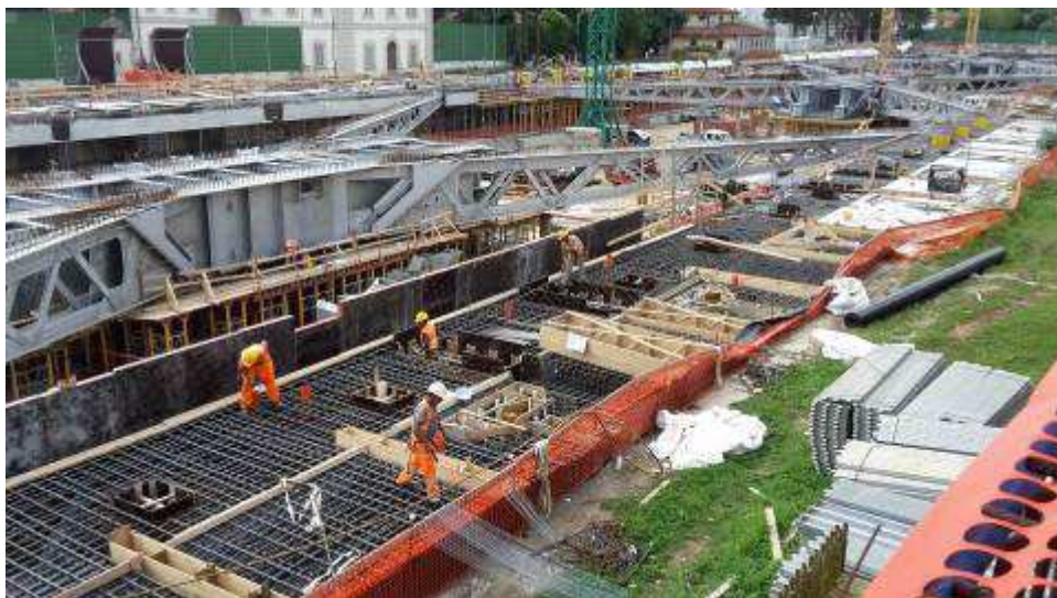
Foto 7 – Banchinaggio, Montaggio armatura e getto Trave cuscino Fili 21-29 lato Est ed Ovest