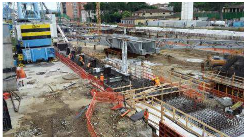
Foto 4 – Montaggio carpenterie metalliche Solaio Piano Terra – Cassone asse 9