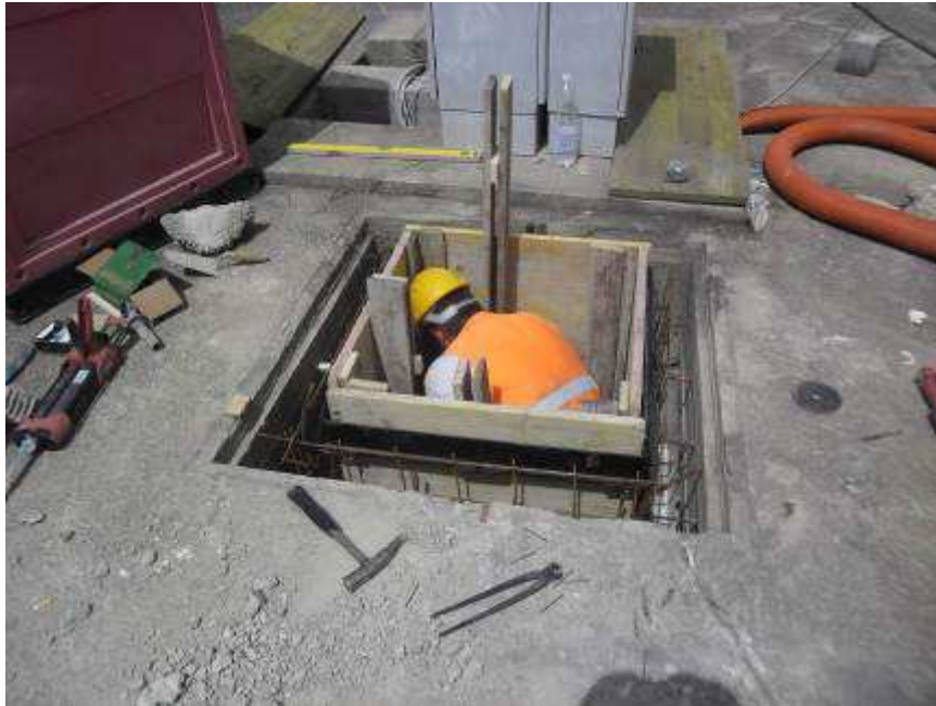
Foto 1 – Interventi per la Risoluzione della NC250 – Sostituzione chiusini Terminal