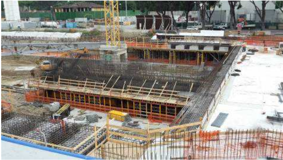
Foto 2 – Banchinaggio e montaggio armatura Cassone centrale Fili 4-5