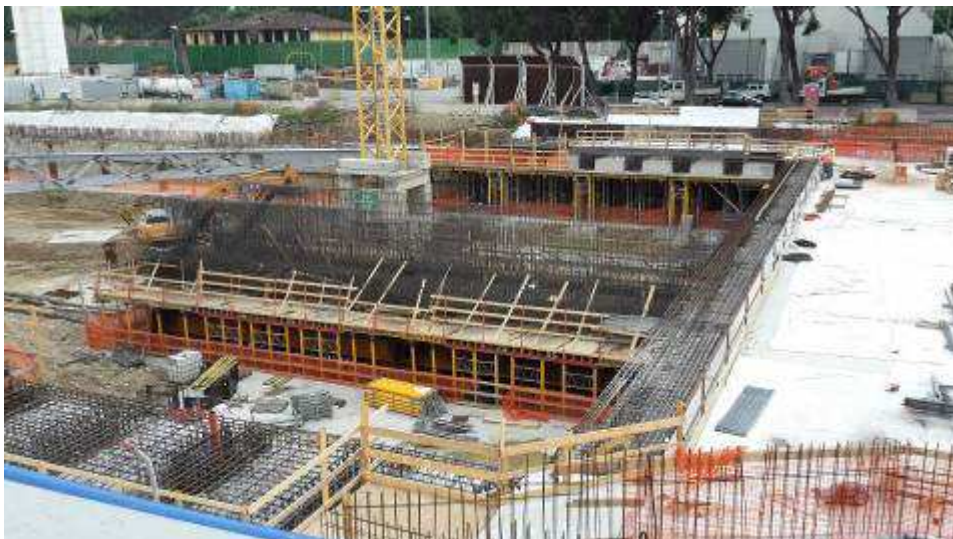
Foto 1 – Completamento getto Trave cuscino Fili 4-5