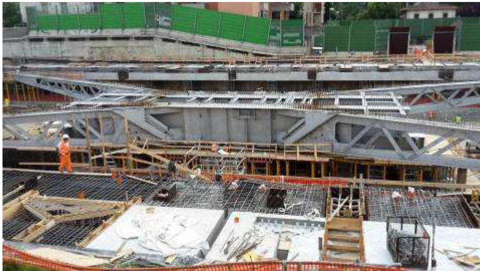
Foto 6 – Banchinaggio, Montaggio armatura e getto Trave cuscino Fili 21-29 lato Est ed Ovest