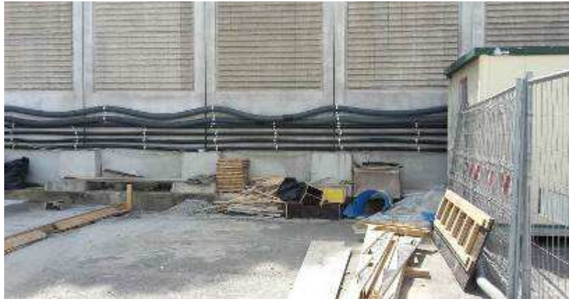
Foto 14 – Attività relative ai pozzi di continuità di falda – posa tubazioni