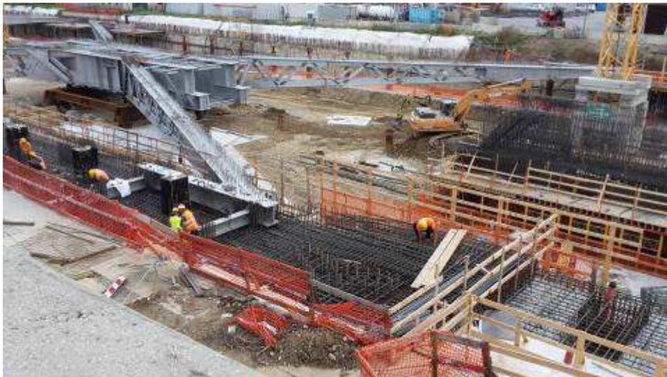
Foto 3 – Banchinaggio e montaggio armatura Trave cuscino Fili 5-13 lato Est