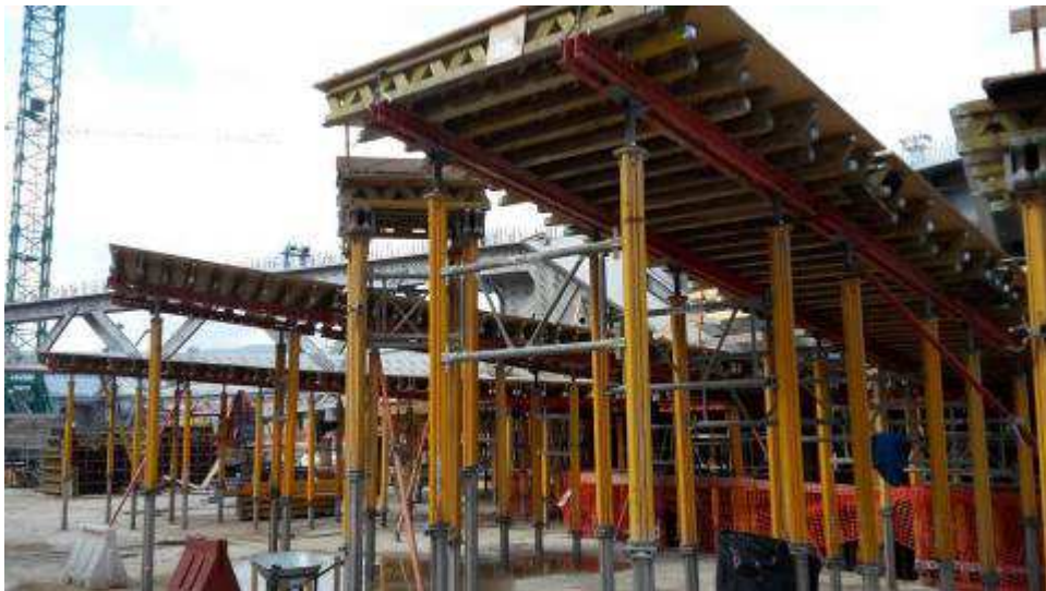
Foto 12 – Banchinaggio Travi intermedie e corte Ventaglio asse 25