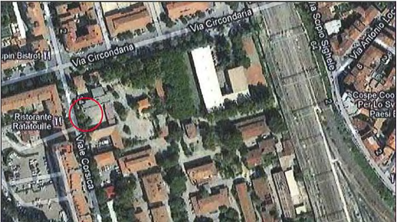
Allegato 1: Passo carrabile via di fuga Viale Corsica