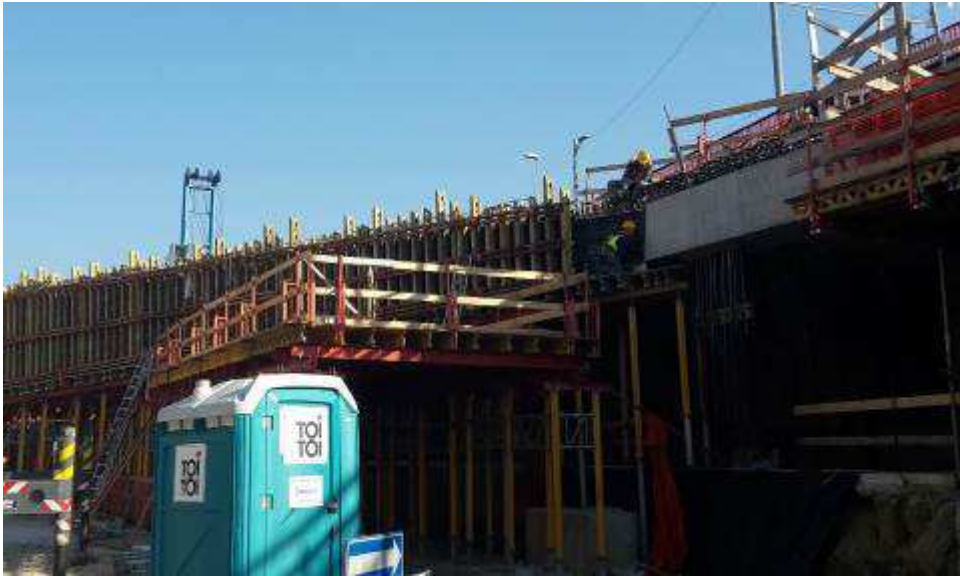
Foto 8 – Montaggio casseri Travi lunghe lato Est, Ventaglio Asse 25