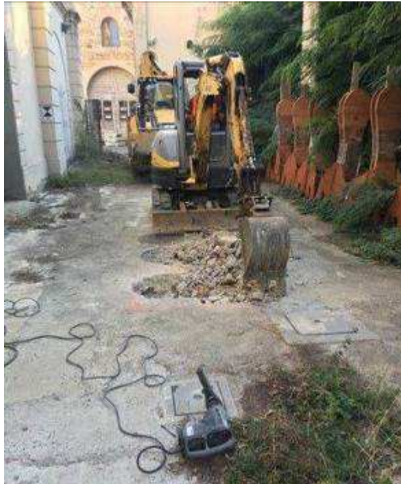
Foto 1 – Fortezza da Basso – Scavo per posa Cavidotto per impianti Nuovo Pozzo Opificio delle Pietre Dure