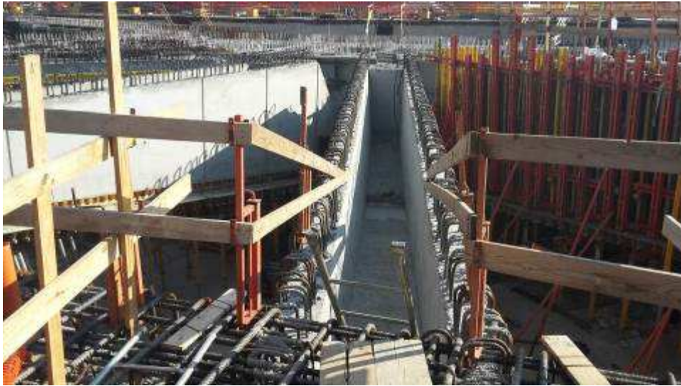
Foto 5 – Prima fase di getto del Foamcem all'interno delle travi lato Ovest, Ventaglio Asse 17