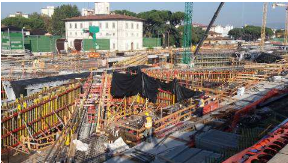
Foto 7 – Getto Travi intermedie e corte lato Est, Ventaglio Asse 25