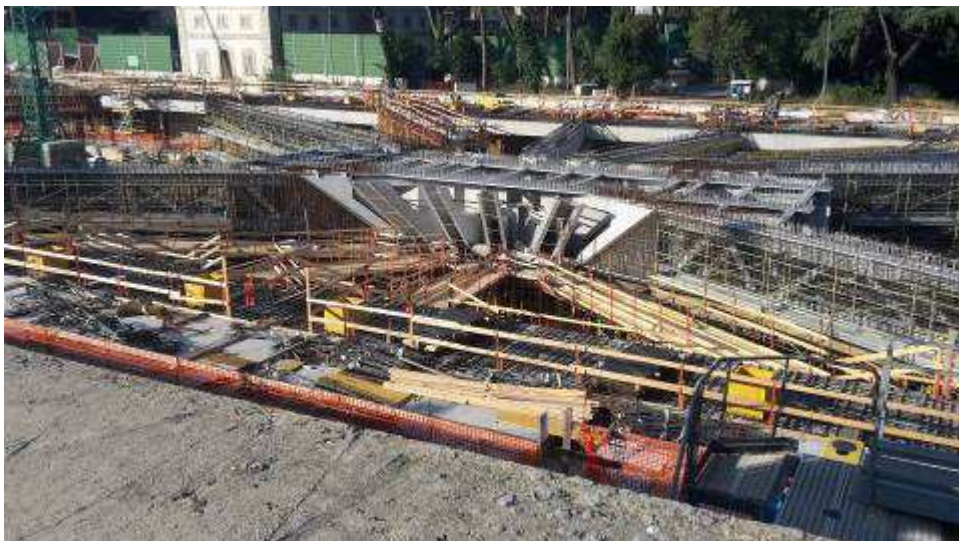
Foto 4 – Banchinaggio Travi intermedie e corte lato Est, Ventaglio Asse 17