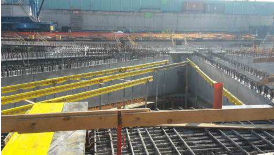
Foto 6 – Montaggio puntelli per appoggio casseri solaio lato Ovest, Ventaglio Asse 17