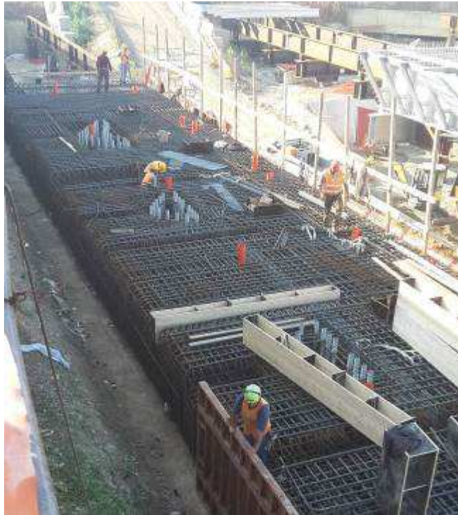
Foto 11 – Montaggio armatura e casseri Trave cuscino Fili 29-34 lato Est