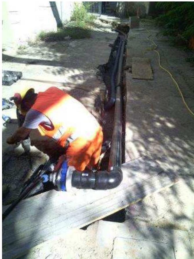
Foto 2 – Fortezza da Basso –Posa Tubazione di collegamento tra l'impianto di condizionamento ed il Nuovo Pozzo O.P.D.