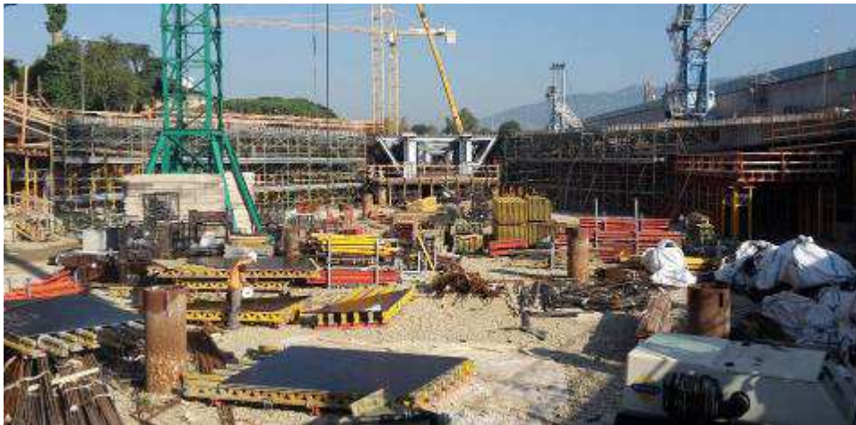
Foto 12 – Completamento “Tunnel” per passaggio dei mezzi sotto i banchinaggi