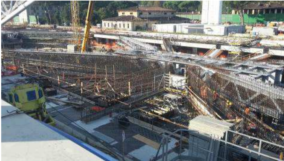
Foto 2 – Montaggio Armatura Travi intermedie e corte lato Est, Ventaglio Asse 9