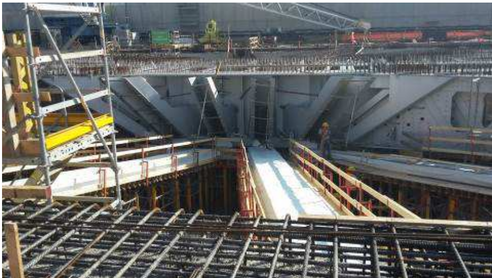
Foto 3 – Banchinaggio Travi intermedie e corte lato Ovest, Ventaglio Asse 9