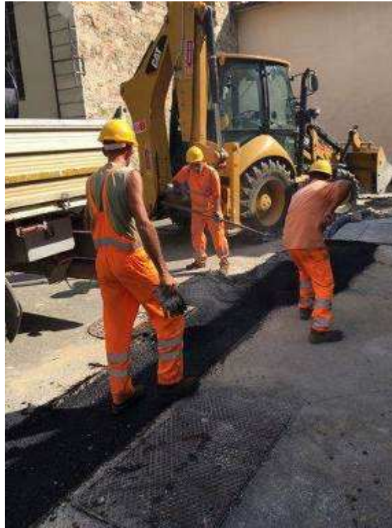
Foto 3 – Fortezza da Basso – Cavidotto per impianti Nuovo Pozzo O.P.D.