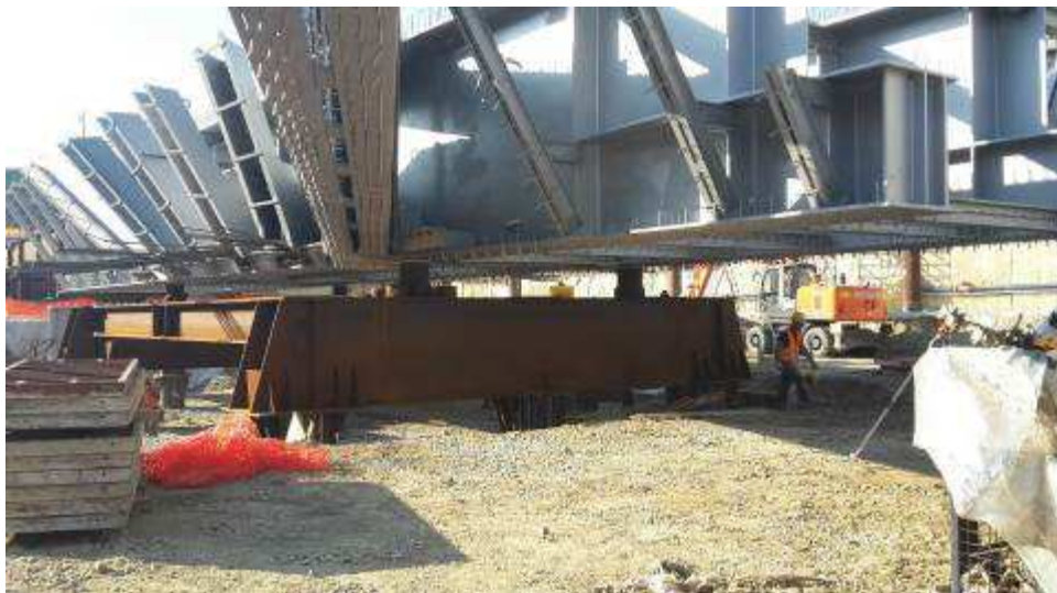
Foto 10 – Preparazione piano per getto magrone per appoggio casseri, Ventaglio Asse 33