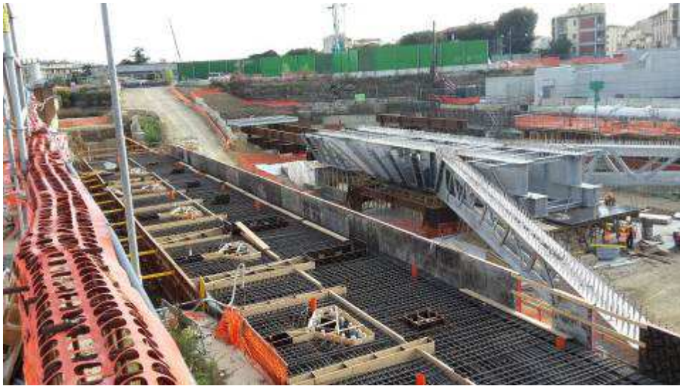
Foto 8 – Completamento Montaggio armatura e casseri Trave cuscino Fili 29-34 lato Est