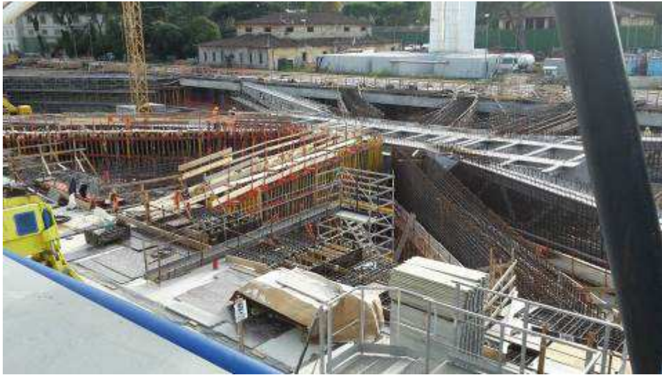
Foto 2 – Montaggio Armatura e cassetteria Travi intermedie e corte lato Est, Ventaglio Asse 9