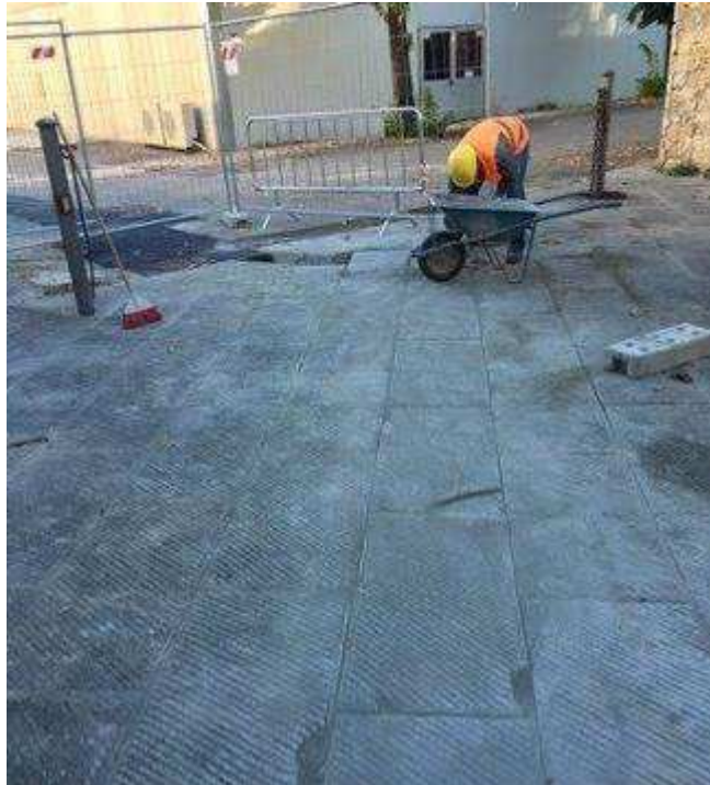
Foto 1 – Fortezza da Basso – Ripristino pavimentazione a seguito Scavo per posa Cavidotto per impianti Nuovo Pozzo Opificio delle Pietre Dure