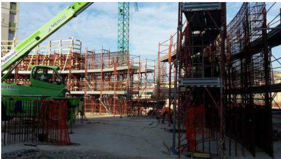
Foto 10 – Montaggio casseri Muro Rampa Kiss&Ride