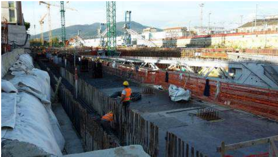
Foto 9 – Montaggio armatura e casseri Trave cuscino Fili 29-34 lato Ovest