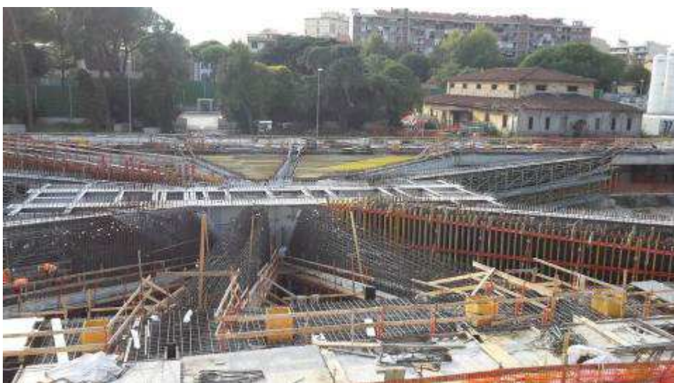
Foto 4 – Montaggio puntelli per appoggio cassetri solaio lato Ovest, Ventaglio Asse 17