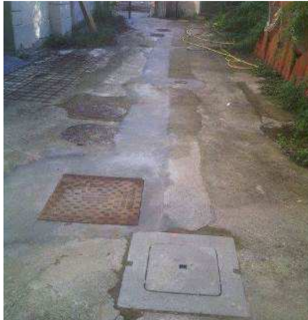
Foto 2 – Fortezza da Basso – Ripristino pavimentazione a seguito Scavo per posa Tubazione per impianti Nuovo Pozzo O.P.D.