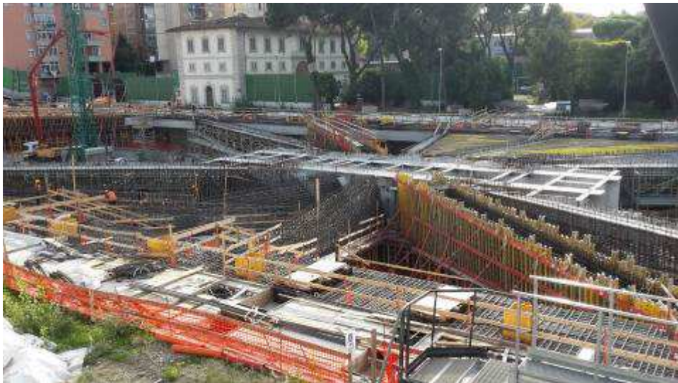
Foto 3– Montaggio Armatura e cassetteria Travi intermedie e corte lato Est, Ventaglio Asse 17