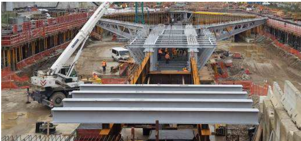
Foto 7 – Montaggio armatura Fondo Cassone, Ventaglio Asse 33