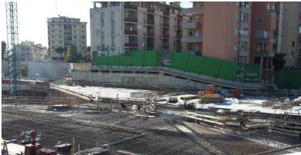
Foto 6 – Banchinaggio, montaggio armatura e getto solaio, Ventaglio Asse 25