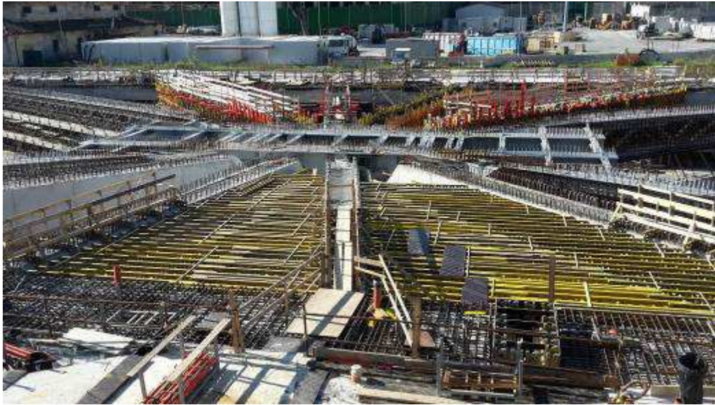
Foto 2 – Getto Travi intermedie lato Ovest e banchinaggio lato Est, Ventaglio Asse 9