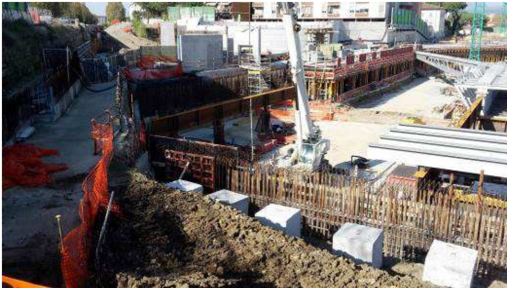
Foto 8 – Montaggio Armatura cordolo di Testa Diaframmi in Testata Sud