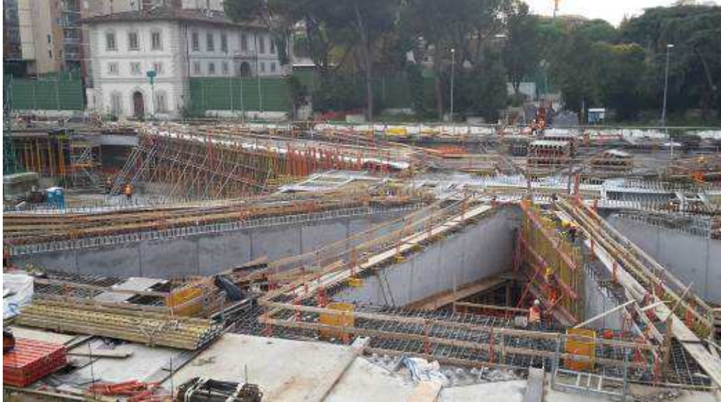
Foto 3–Getto Travi intermedie e corte lato Est, Ventaglio Asse 17