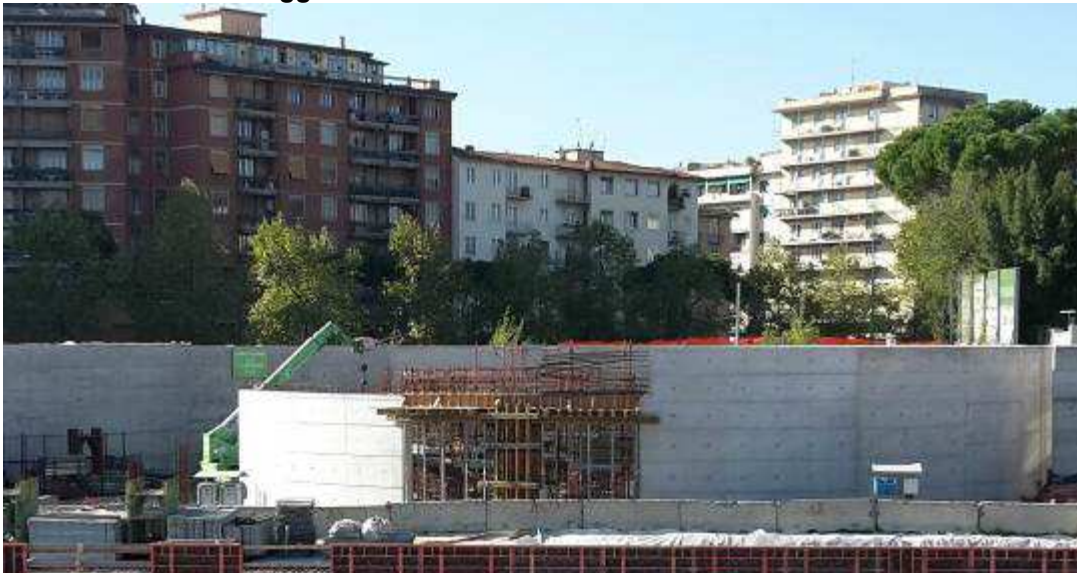
Foto 9 – Montaggio armatura Muro MU10 e Getto Trave e Pilastro MU4bis, Rampa Kiss&Ride