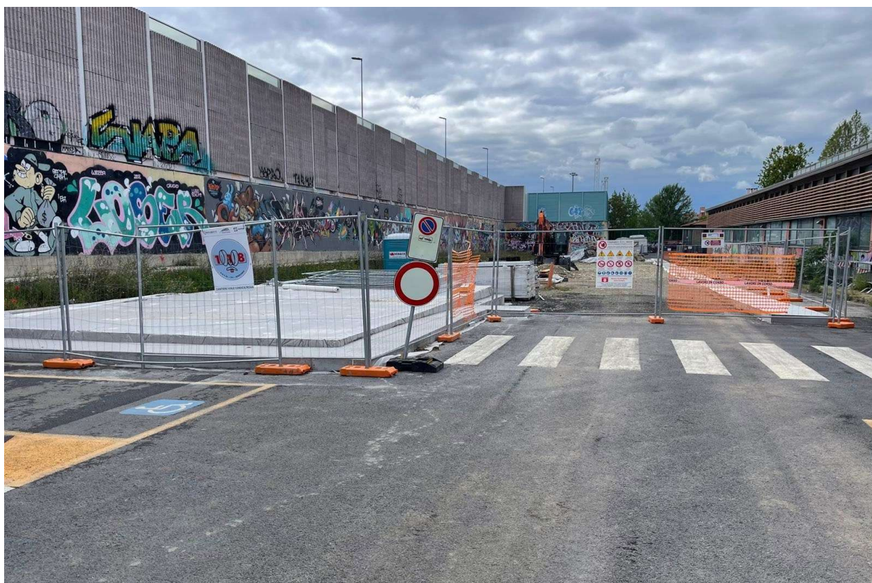
Figura 15 - Ottone Rosai