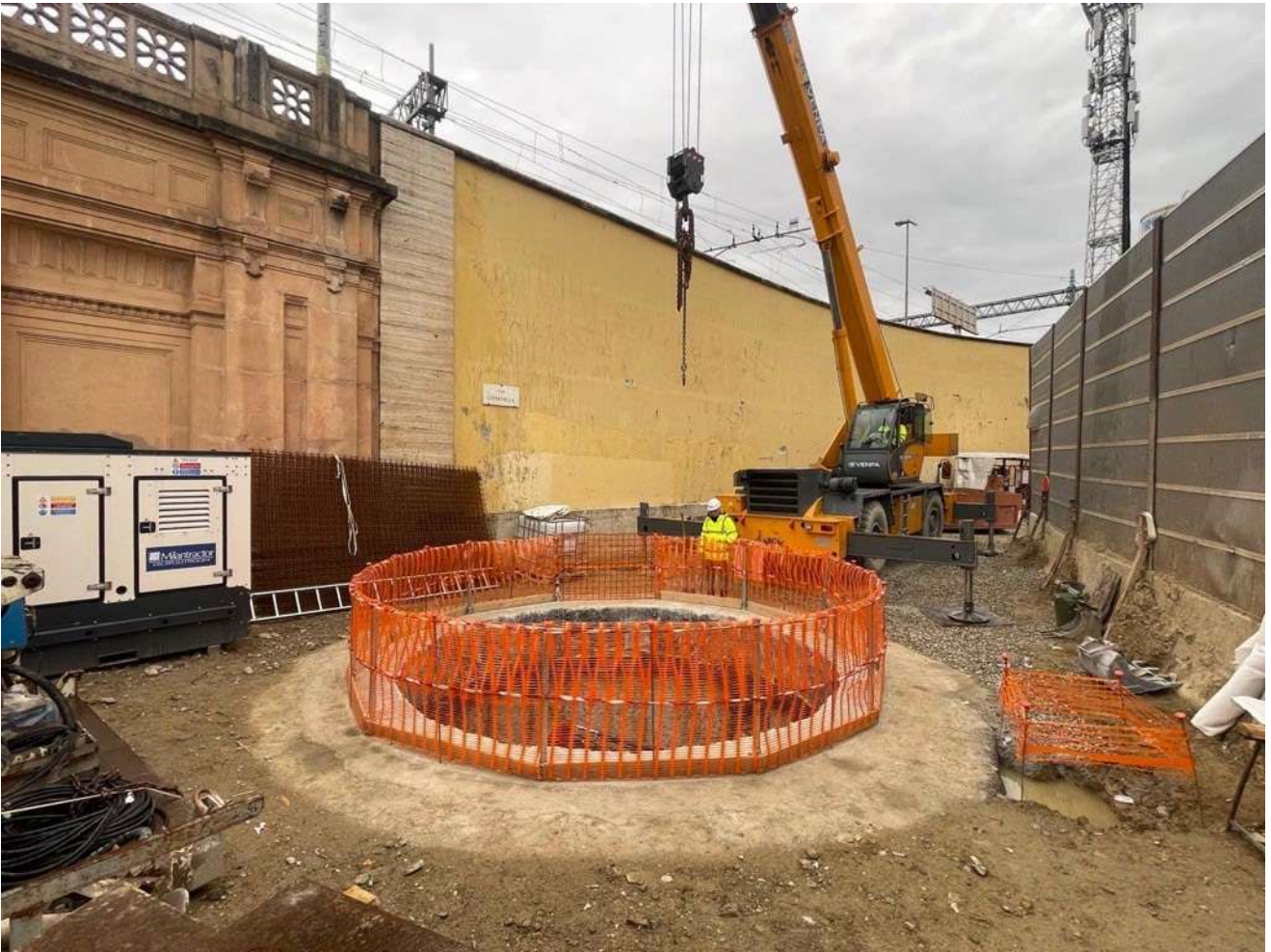
Figura 12 - Pozzo Via Cittadella