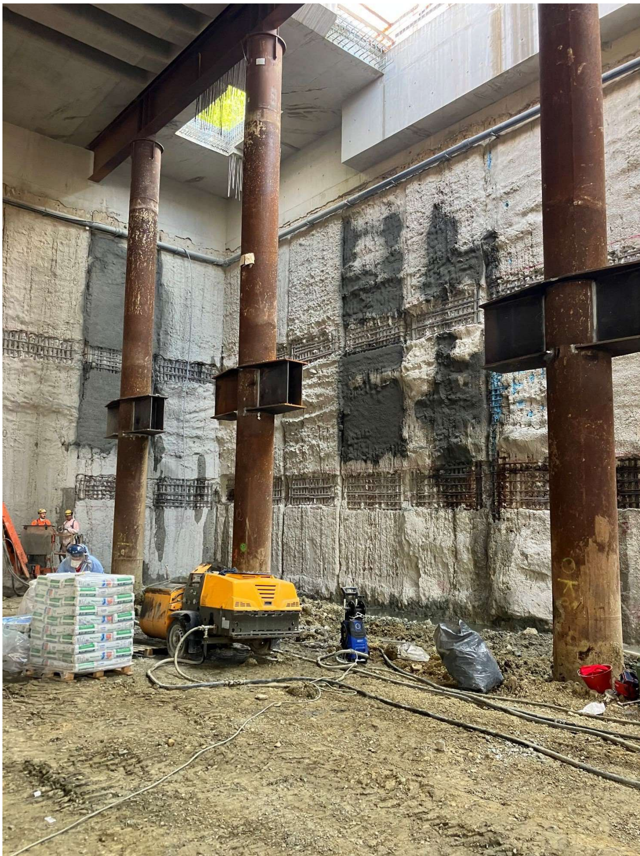
Figura 3 - Stazione AV