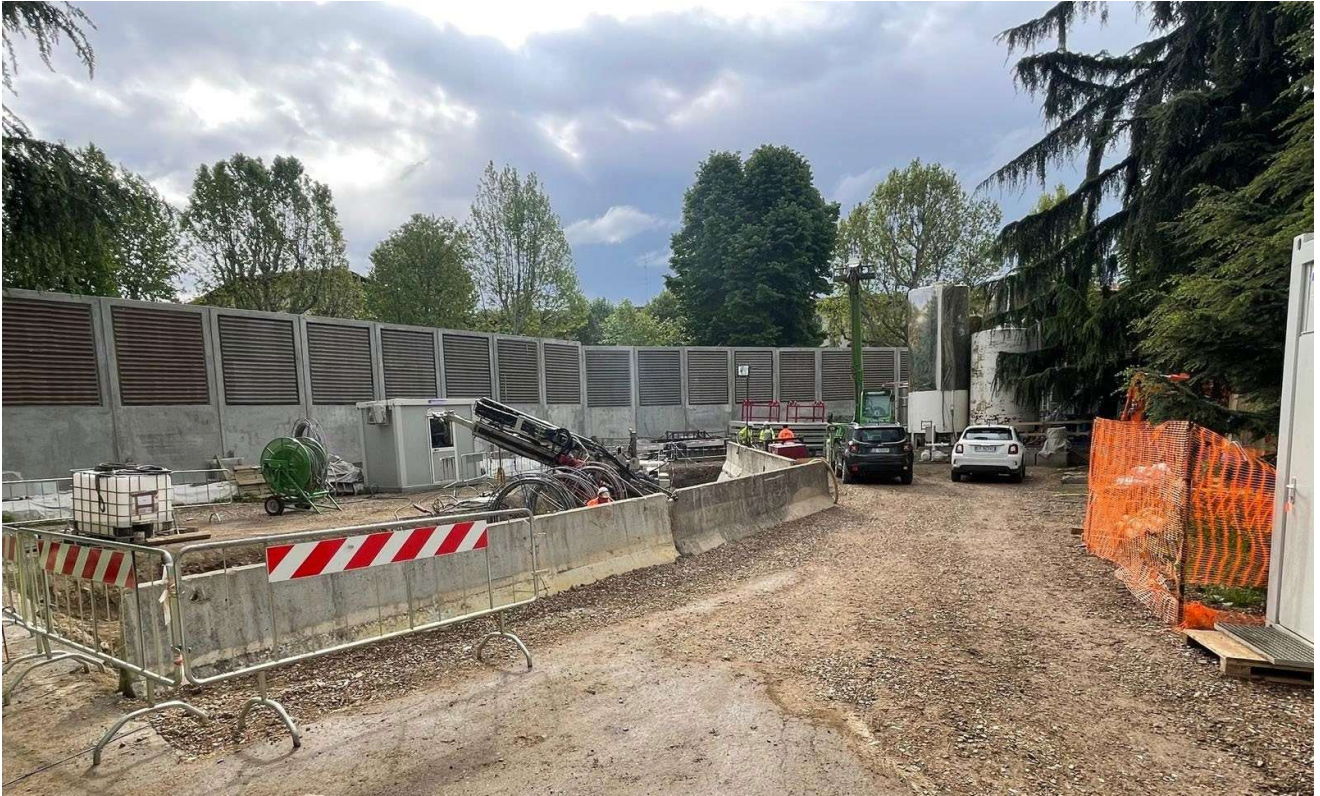
Figura 8 - Fortezza Area 1