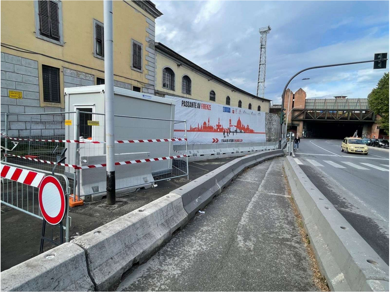
Figura 10 - Fortezza Area 3