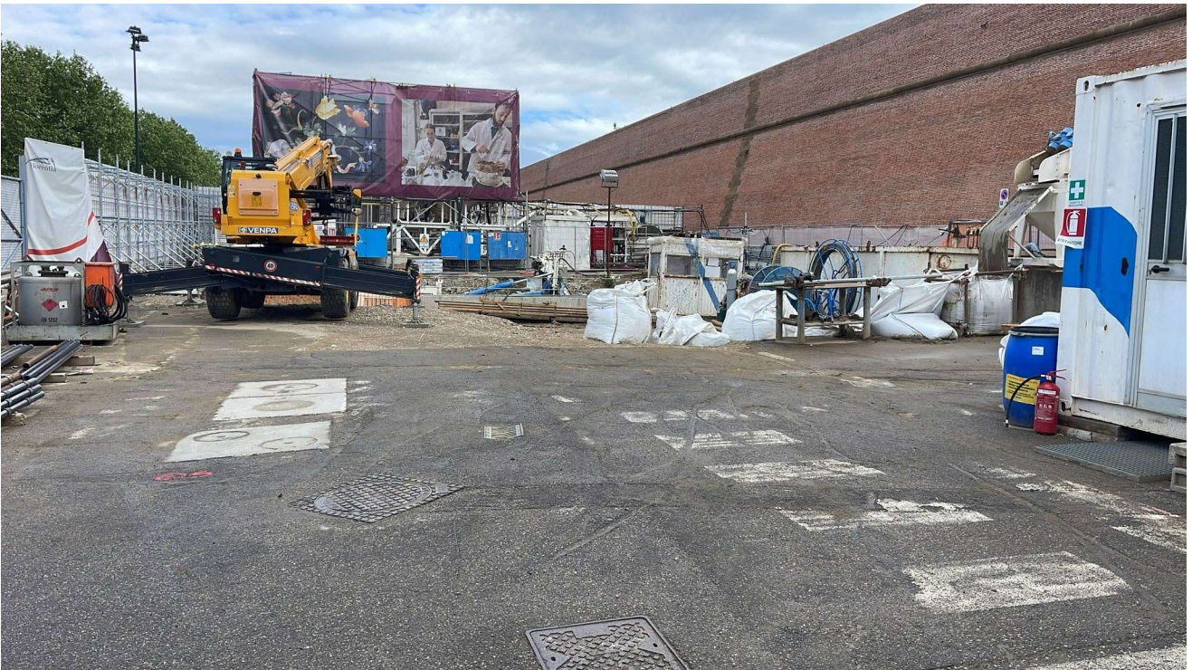
Figura 11 - Fortezza Area 4