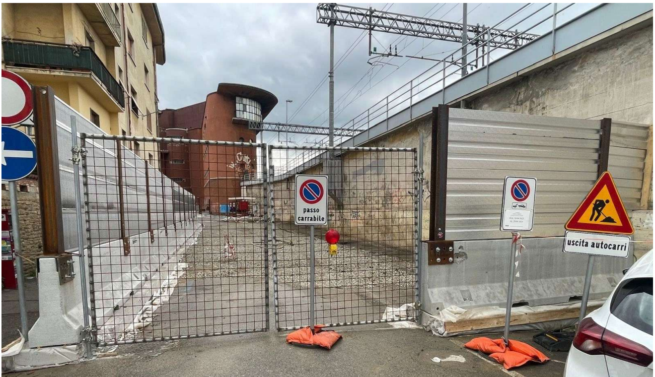
Figura 13 - Via delle Ghiacciaie Ed. 35