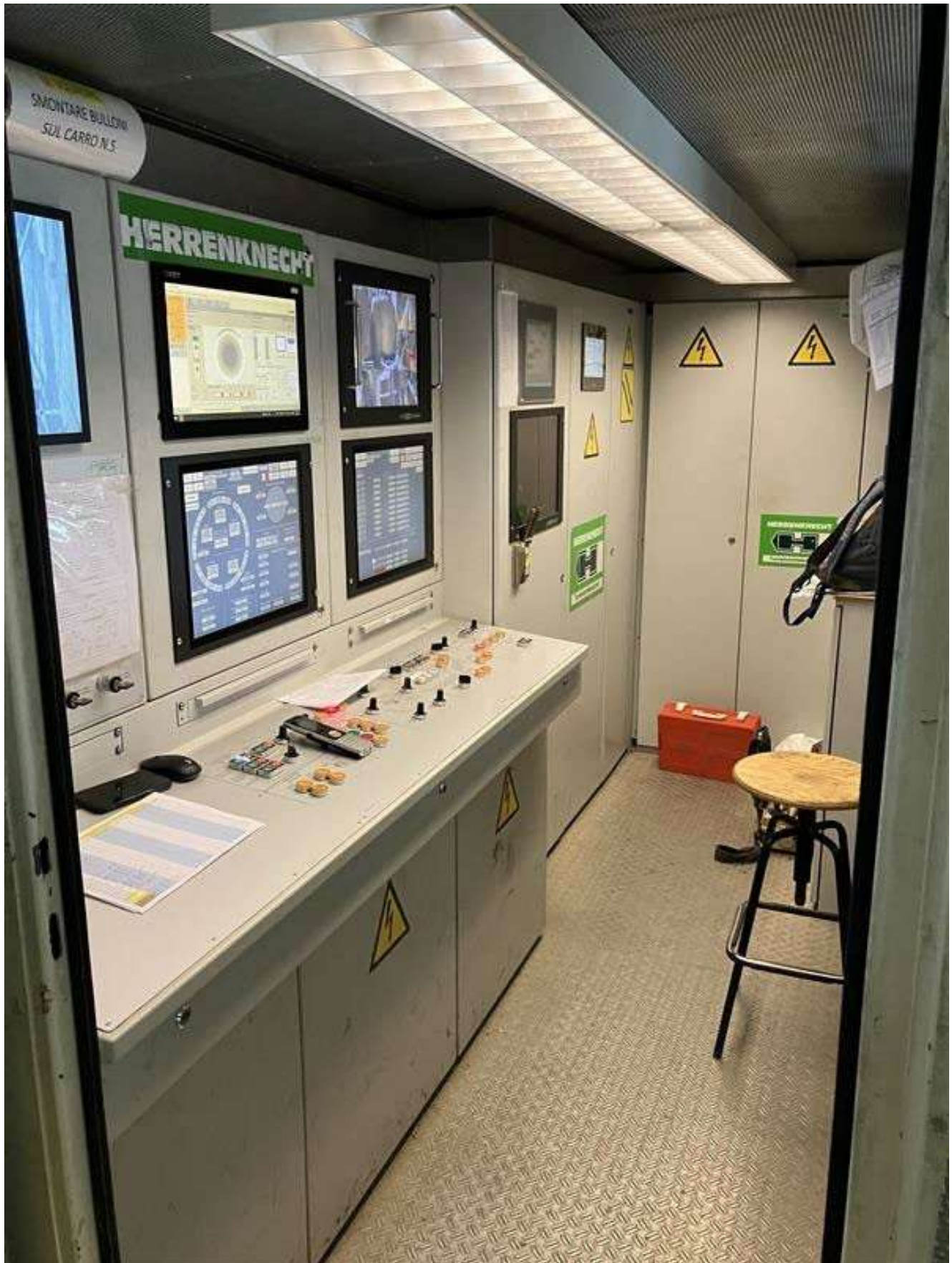
Figura 4 - TBM