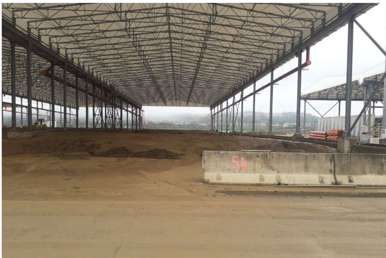
Figura 7 – Santa Barbara