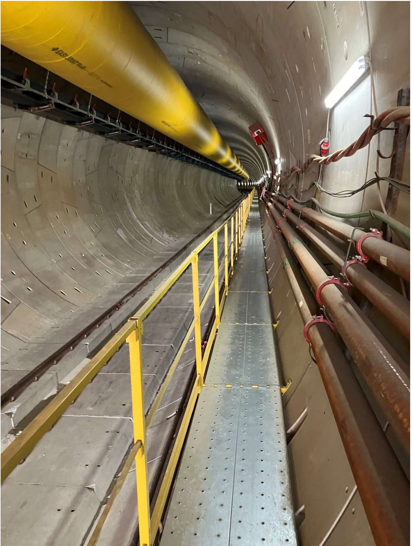
Figura 5 – Scavo Galleria Binario Pari