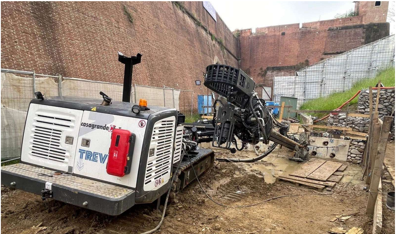
Figura 9 - Fortezza Area 2