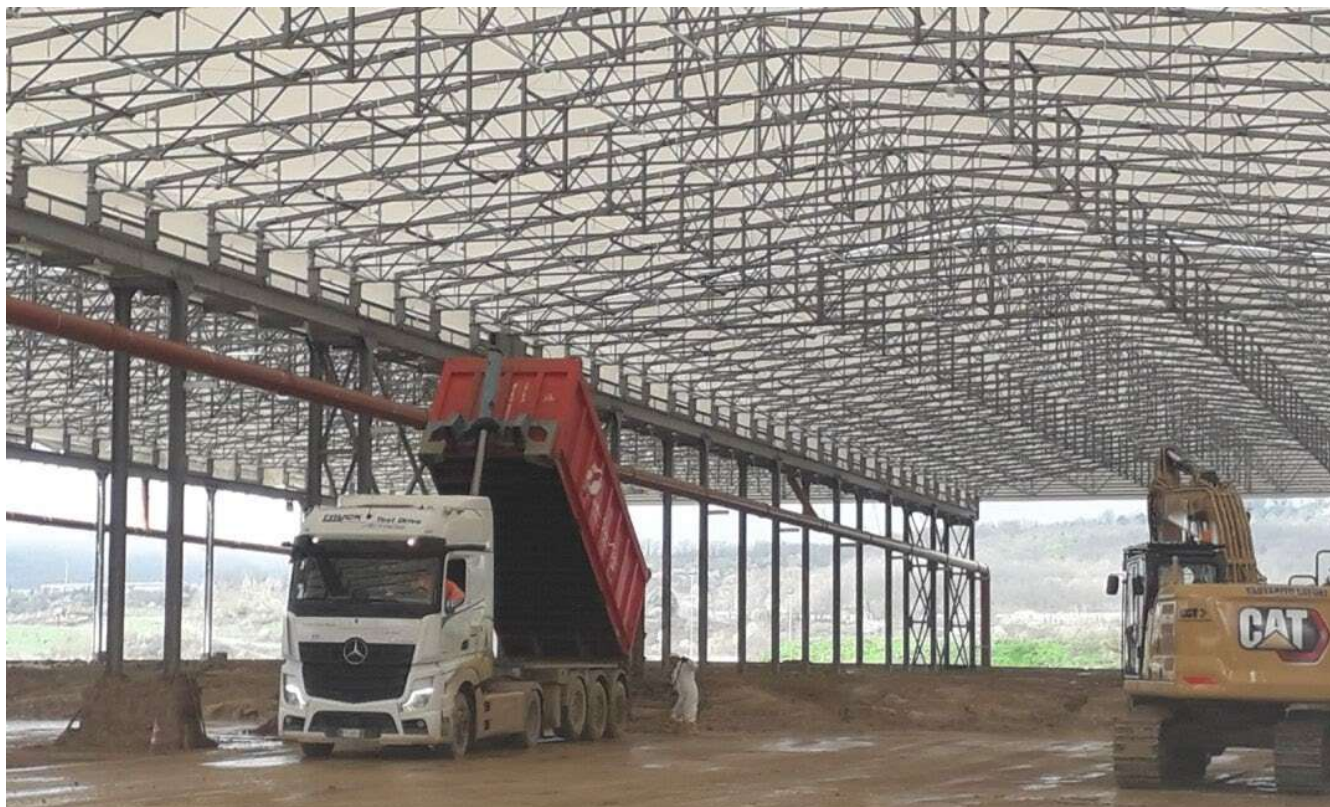
Figura 6 – Santa Barbara