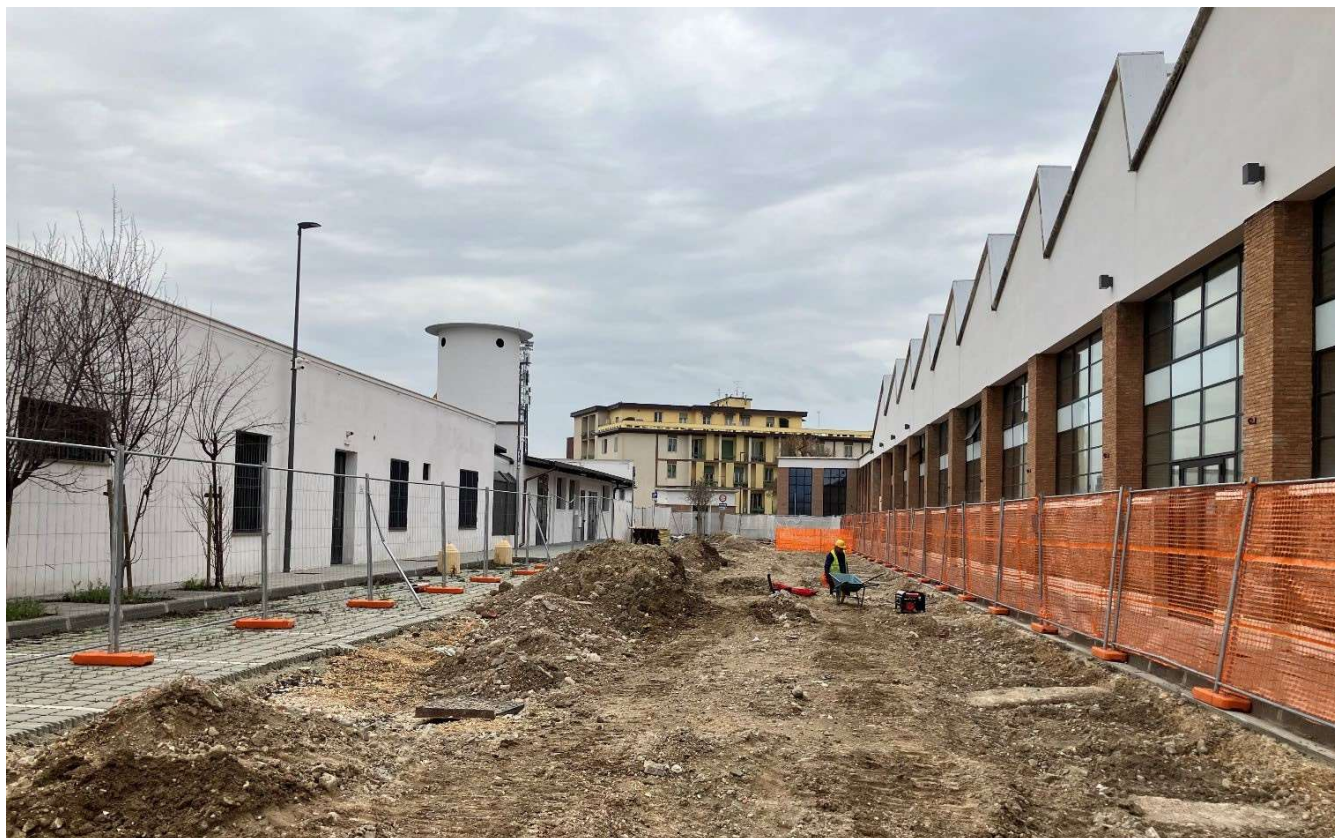
Figura 14 - Viale Redi