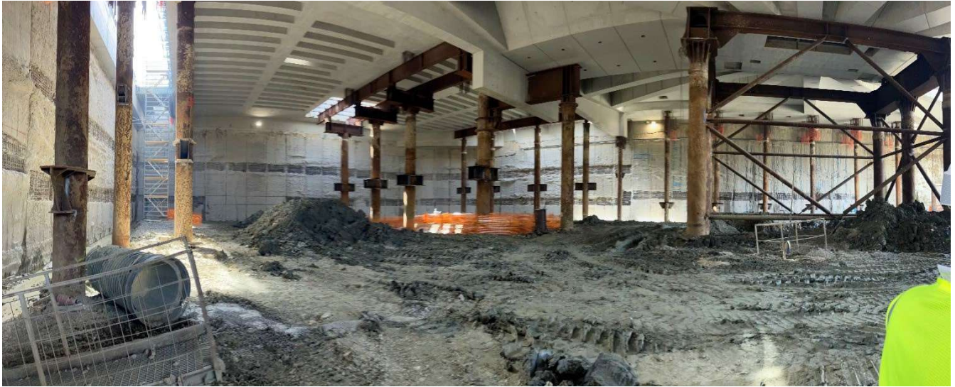
Figura 1 - Stazione AV