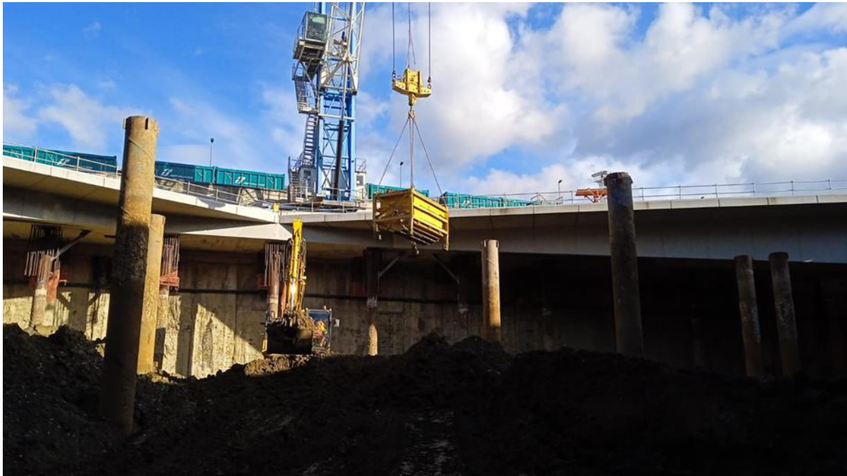
Foto 03 – attività di carico delle terre con l'ausilio delle Gru portuali