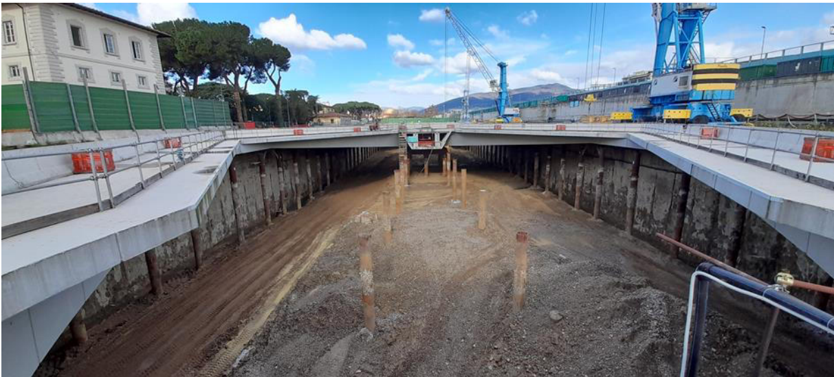
Foto 08 – abbassamento fondo scavo camerone quota c.ca 33 m s.l.m.