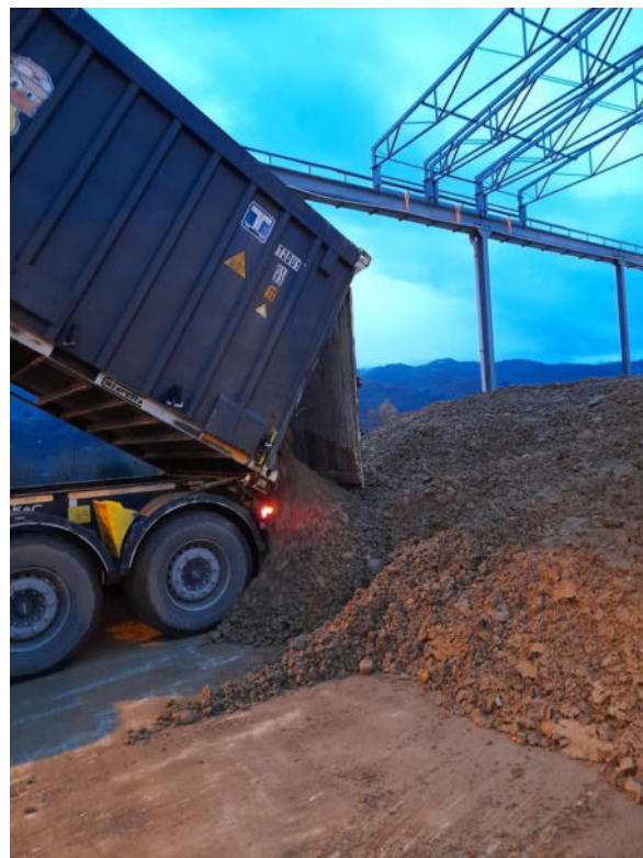
Foto 12 – scarico delle terre presso le piazzole di caratterizzazione