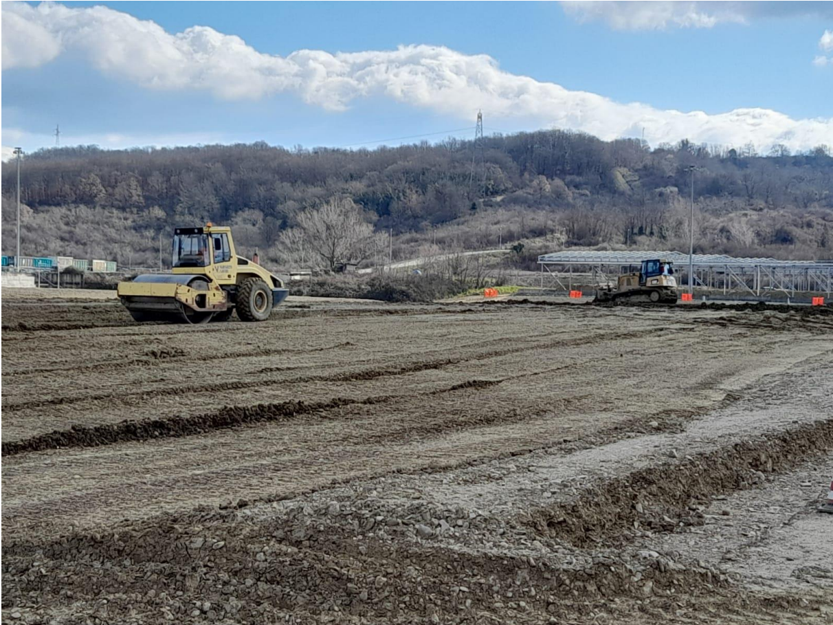
Attività di compattazione presso la collina