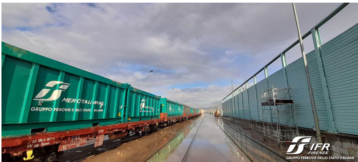
Predisposizione convoglio ferroviario presso il corridoio attrezzato