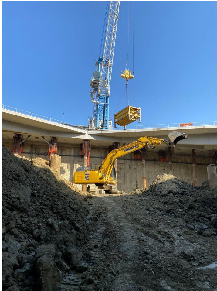
Attività di scavo e carico delle terre