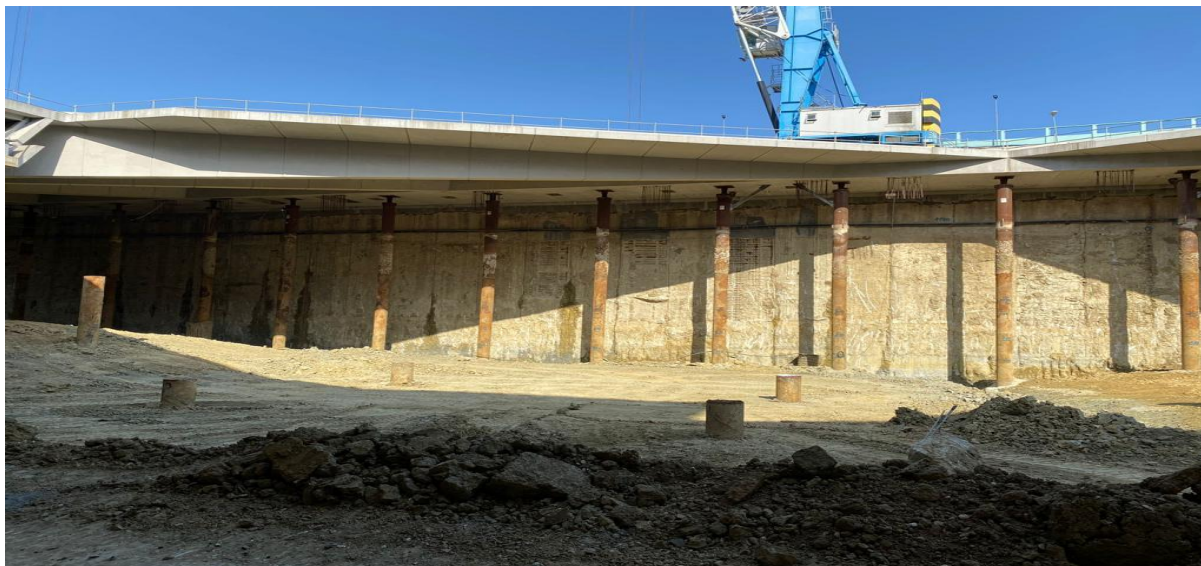
Abbassamento fondo scavo (quota 35 m s.l.m. - quota 33 m s.l.m.)