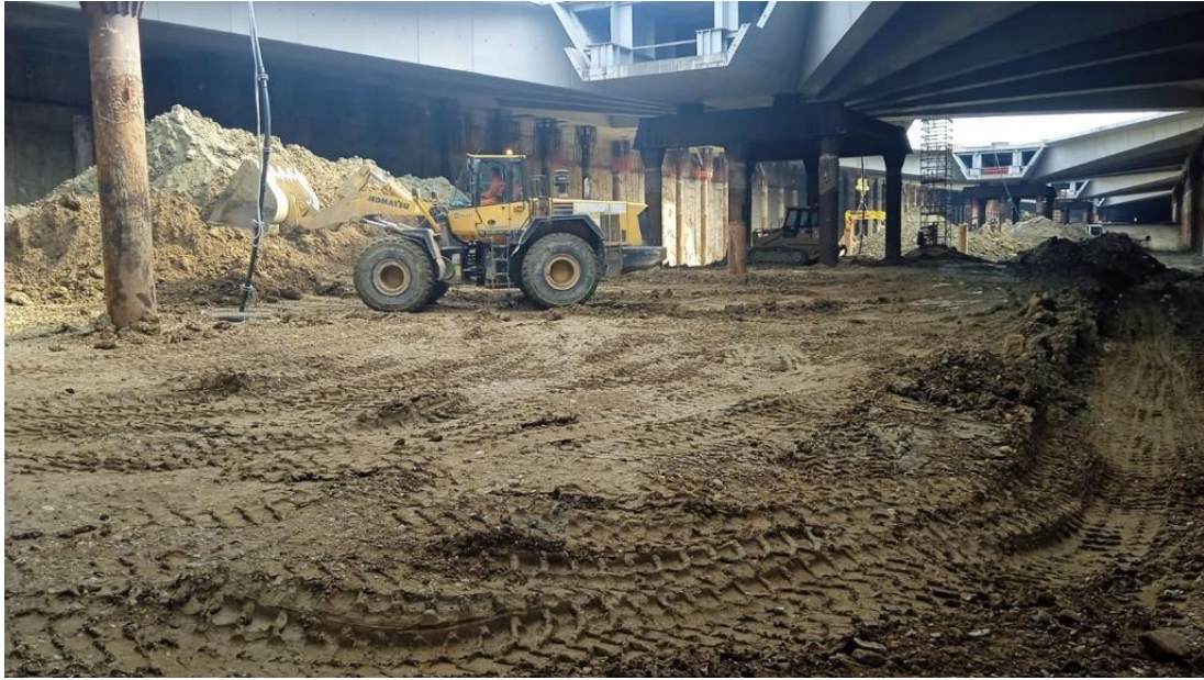
Movimentazione delle terre