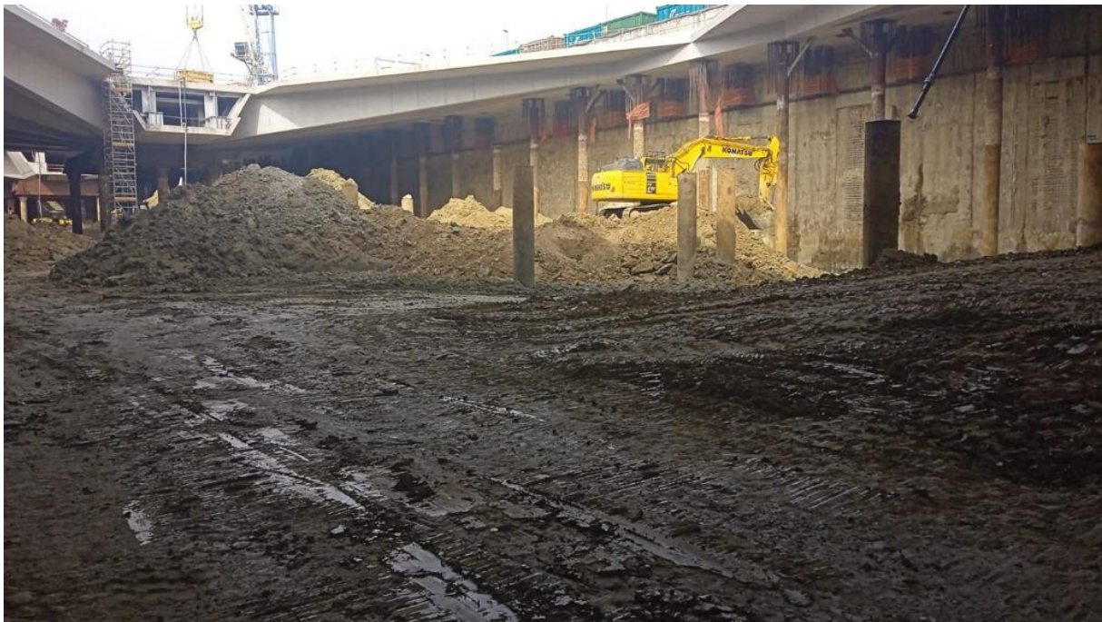
Creazione cumuli presso il camerone della Nuova Stazione AV