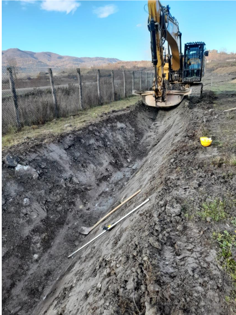
Realizzazione fossi di guardia presso la collina schermo