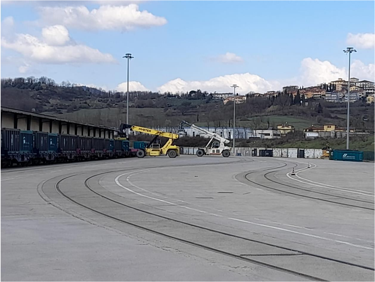
Attività di ricarica containers ferroviari con l'ausilio di mezzi stacker