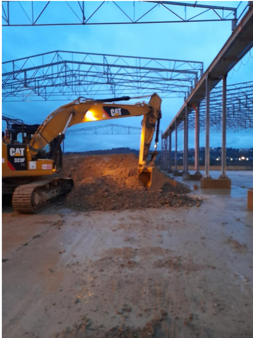
Scavo terra presso le piazzole di caratterizzazione