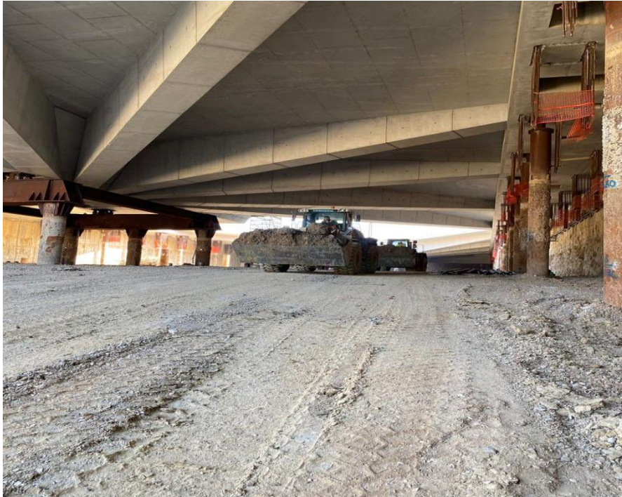
Movimentazione delle terre