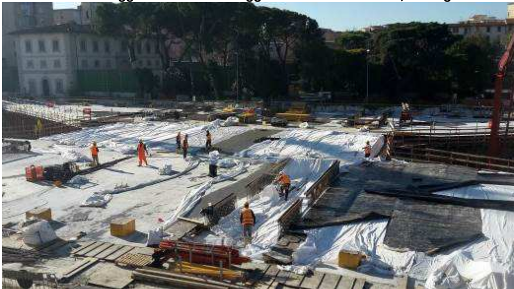
Foto 4 – Getto Soletta Solaio, Ventaglio Asse 17 lato Est e Zona Centrale