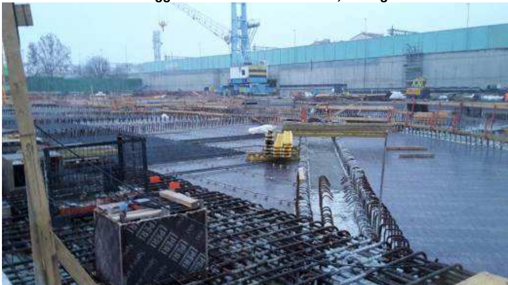
Foto 3 – Banchinaggio soletta e montaggio armatura lato Ovest, Ventaglio Asse 9