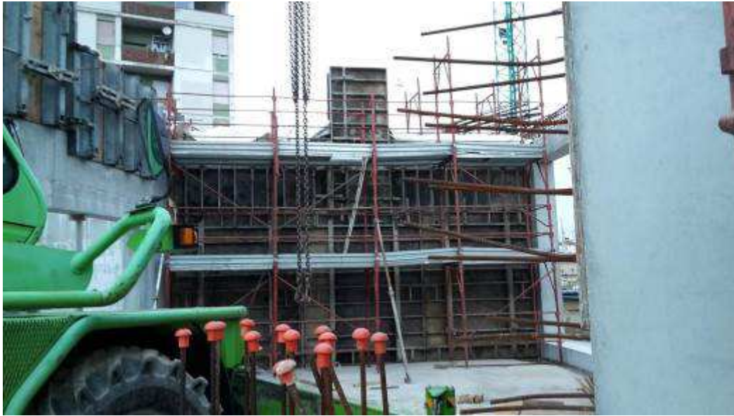
Foto 8 – Montaggio casseri e getto Muri Trasversali, Rampa Kiss&Ride