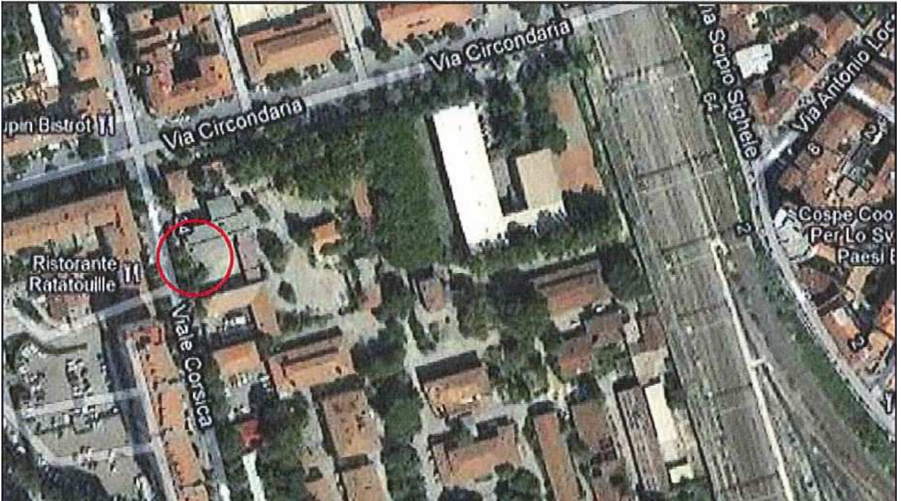
Allegato 1: Passo carrabile via di fuga Viale Corsica