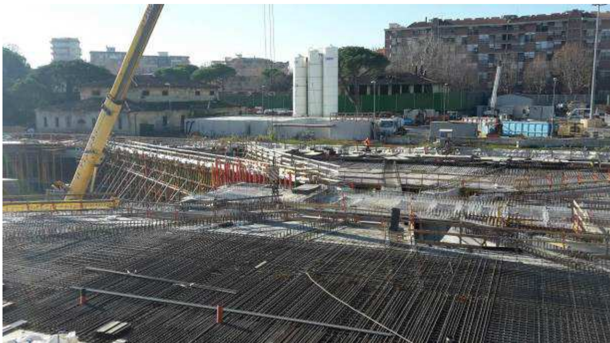
Foto 1 – Getto Trave lunga lato Sud-Ovest e posa predalles, Ventaglio Asse 9