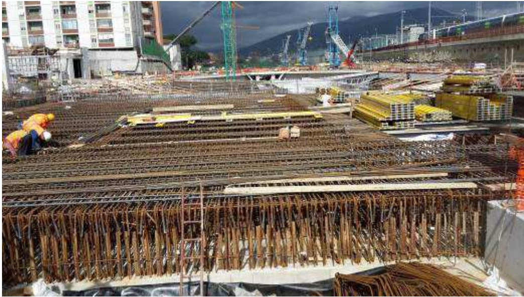
Foto 5 – Banchinaggio e Montaggio armatura Solaio liv. 00 Testata Sud - lato Ovest