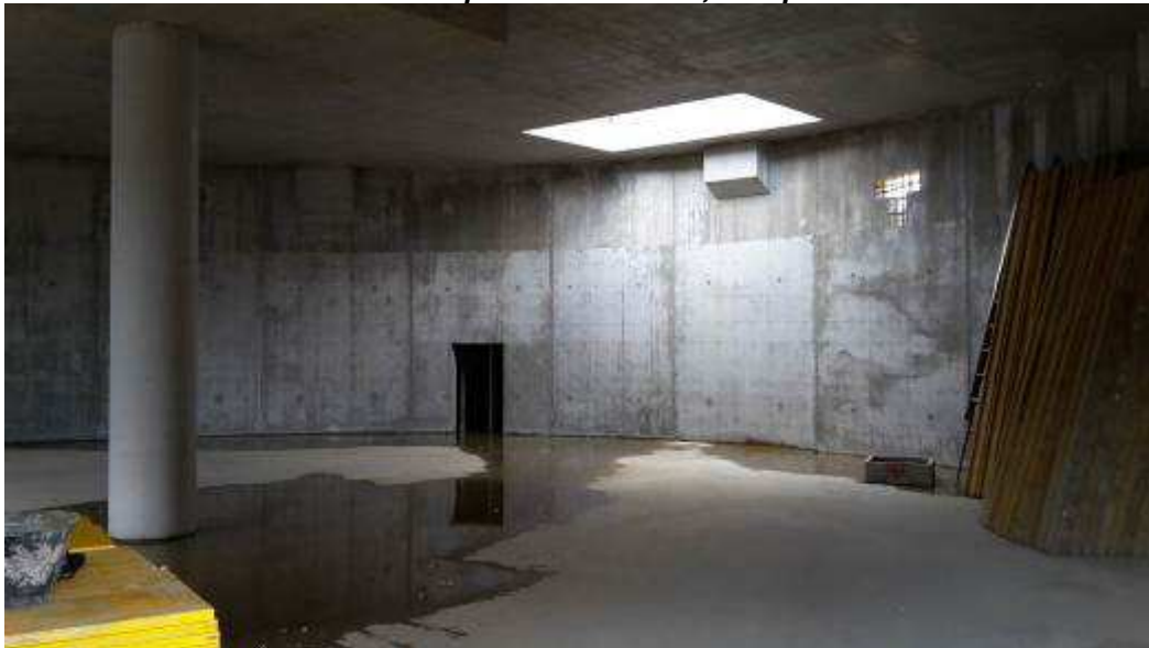
Foto 9 – Rimozione Banchinaggio Soletta centrale L0104, Rampa Kiss&Ride