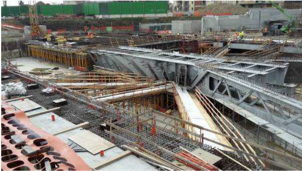
Foto 2 – Banchinaggio Travi Intermedie e corte, Ventaglio Asse 33 - Lato Est