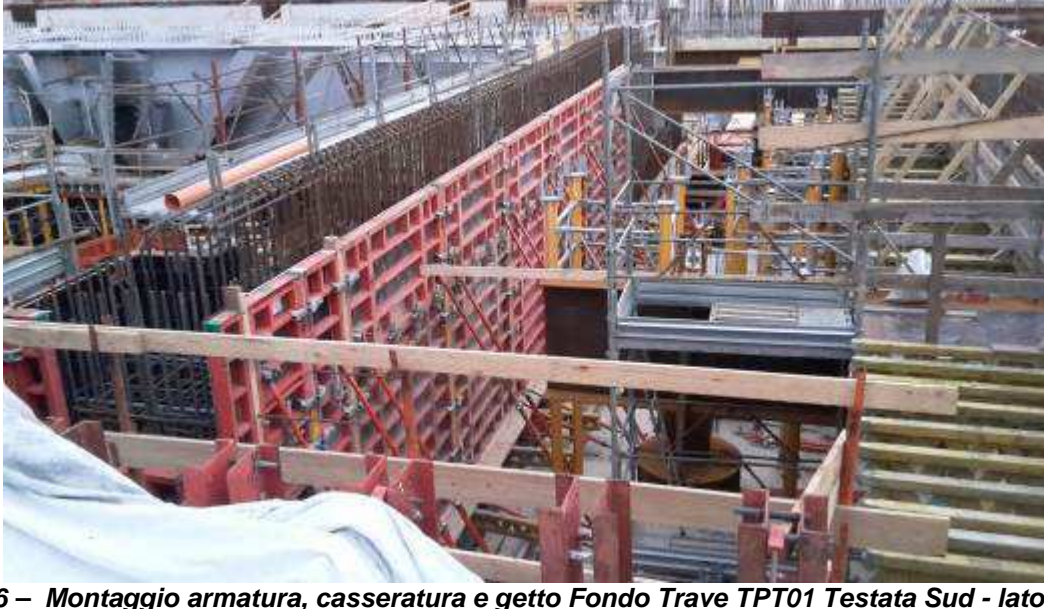
Foto 6 – Montaggio armatura, cassetteria e getto Fondo Trave TPT01 Testata Sud - lato Ovest