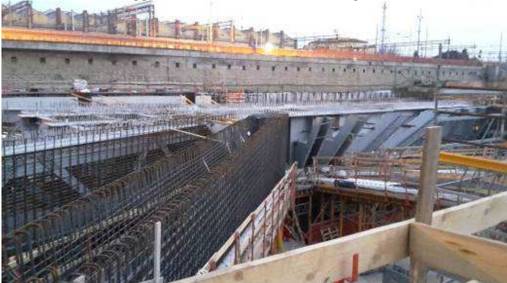
Foto 3 – Montaggio armatura Travi intermedie e corte, Ventaglio Asse 33 - Lato Ovest