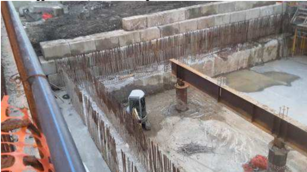
Foto 7 – Scapitozzatura Teste diaframmi Zona Testata Sud – Spigolo Sud-Est