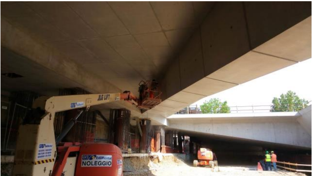
Foto 1 – Ripristino delle travi per la presentazione del faccia vista, ventaglio 9