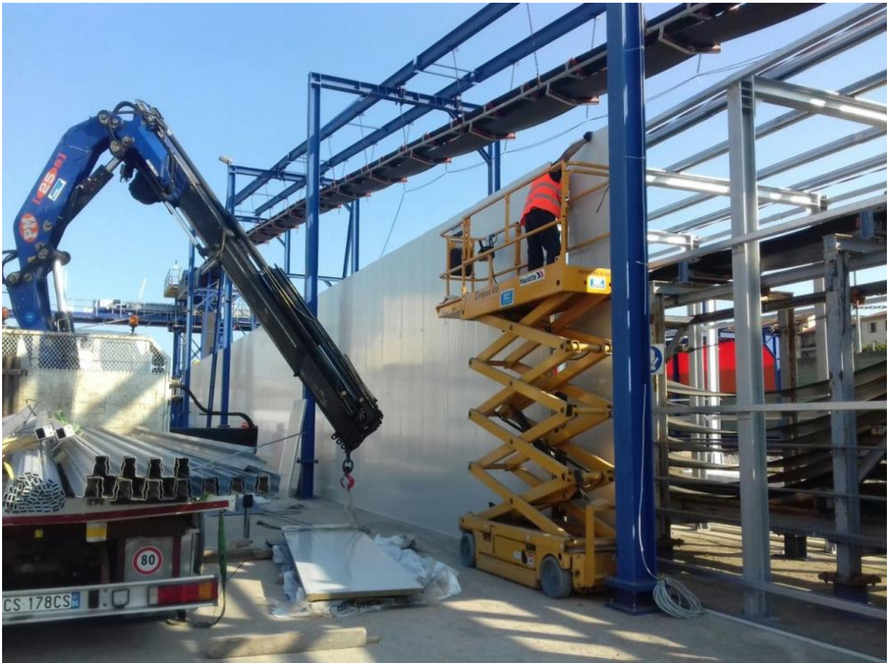
Foto 2 – Montaggio barriere antirumore per schermatura nastro – Area Campo di Marte