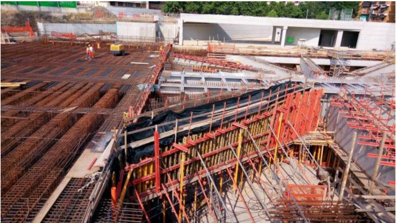
Foto 2 – Getto Trave T4 lato Est e cassera Trave T5 lato Ovest, Ventaglio Asse 33