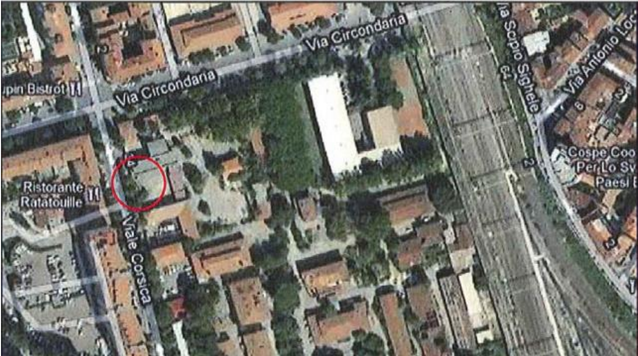
Allegato 1: Passo carrabile via di fuga Viale Corsica