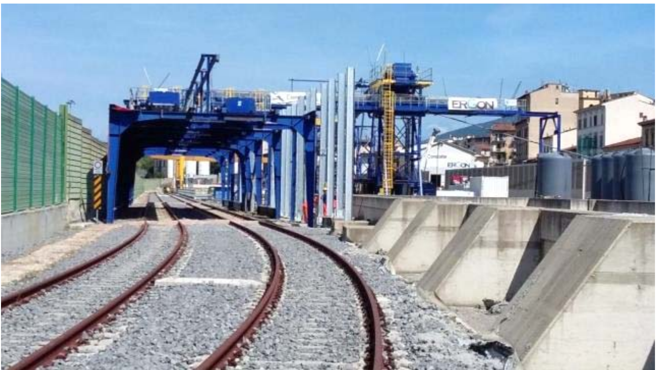
Foto 1 – Montaggio barriere antirumore per schermatura nastro – Area Campo di Marte