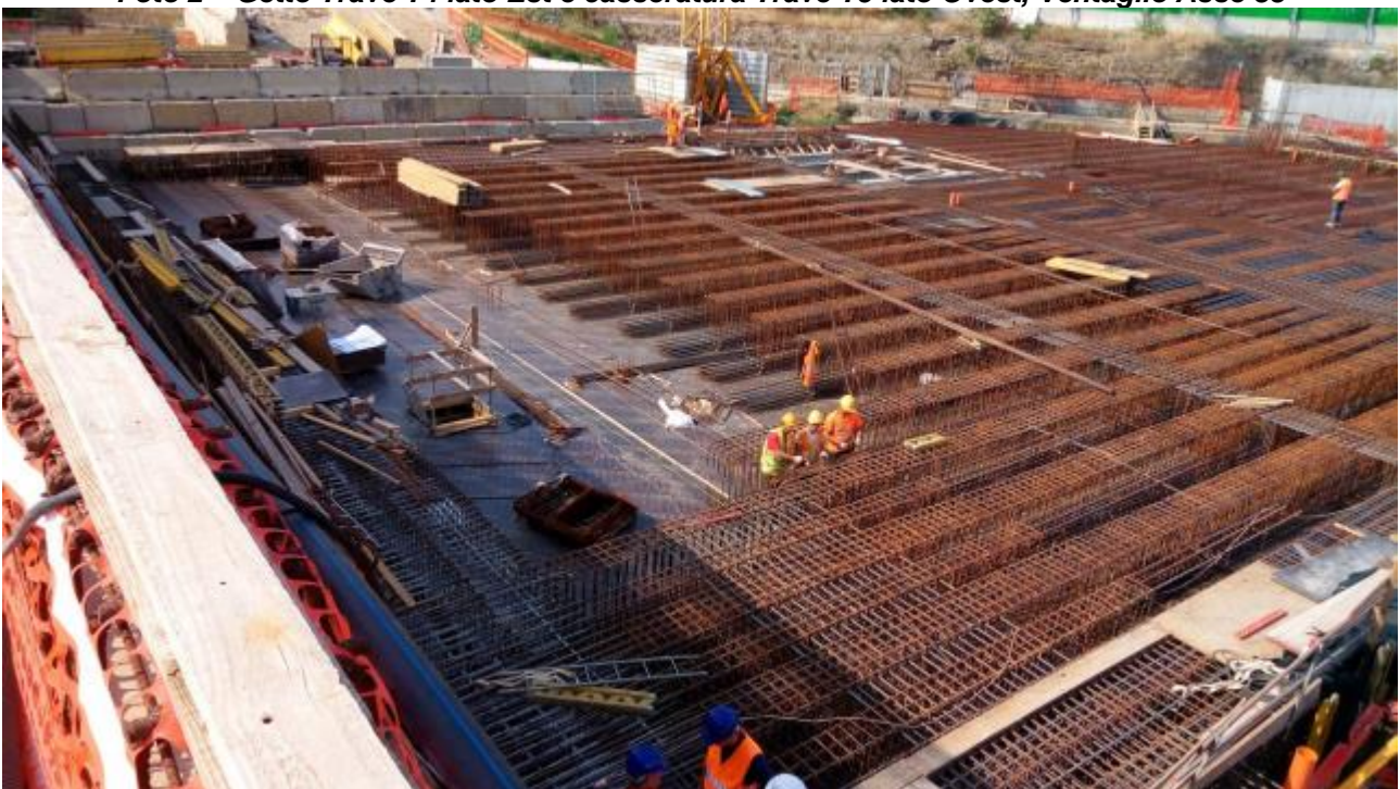
Foto 3 – Banchinaggio e Montaggio armatura Solaio liv. 00 Testata Sud - lato Est