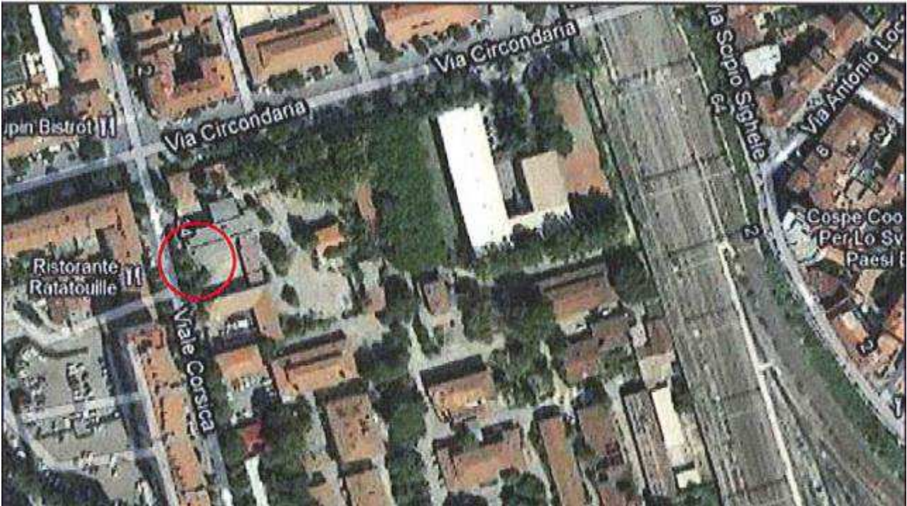
Allegato 1: Passo carrabile via di fuga Viale Corsica