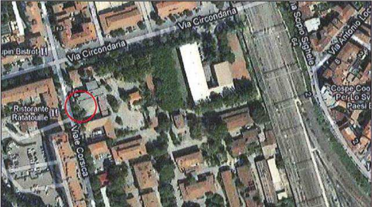
Allegato 1: Passo carrabile via di fuga Viale Corsica