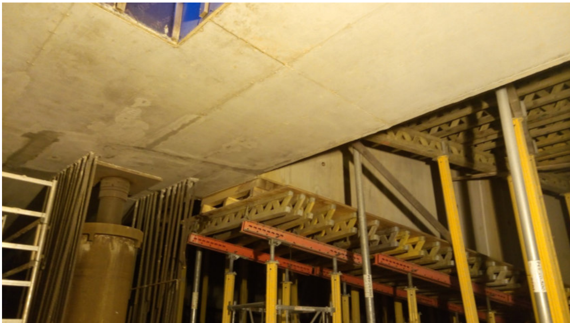
Foto 1 – Interventi di ripristino su trave cuscino ovest, Ventaglio33