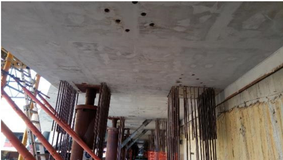
Foto 1 – Interventi di ripristino su trave cuscino ovest, Ventaglio33