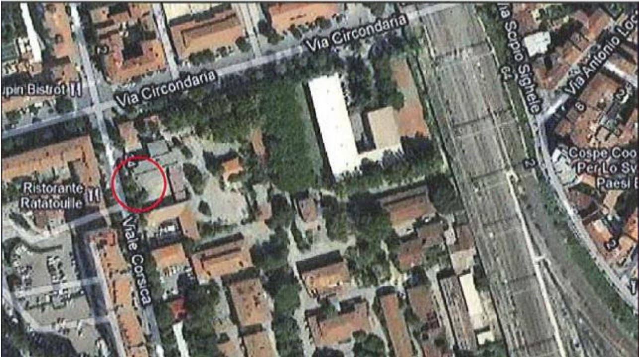
Allegato 1: Passo carrabile via di fuga Viale Corsica