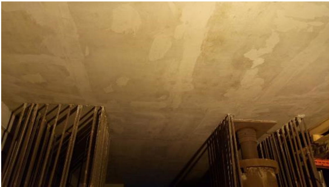
Foto 1 – Interventi di ripristino su trave cuscino ovest, Ventaglio33