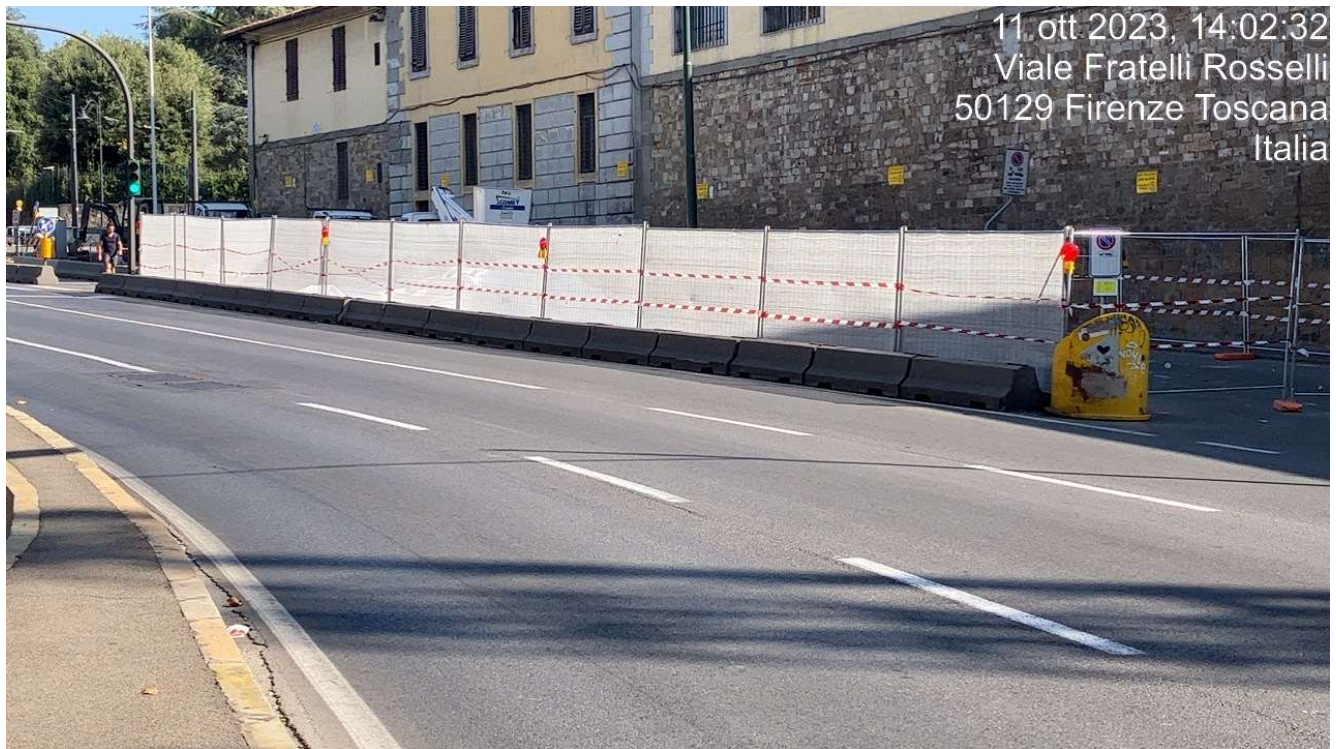
Figura 13 - Fortezza Area 3