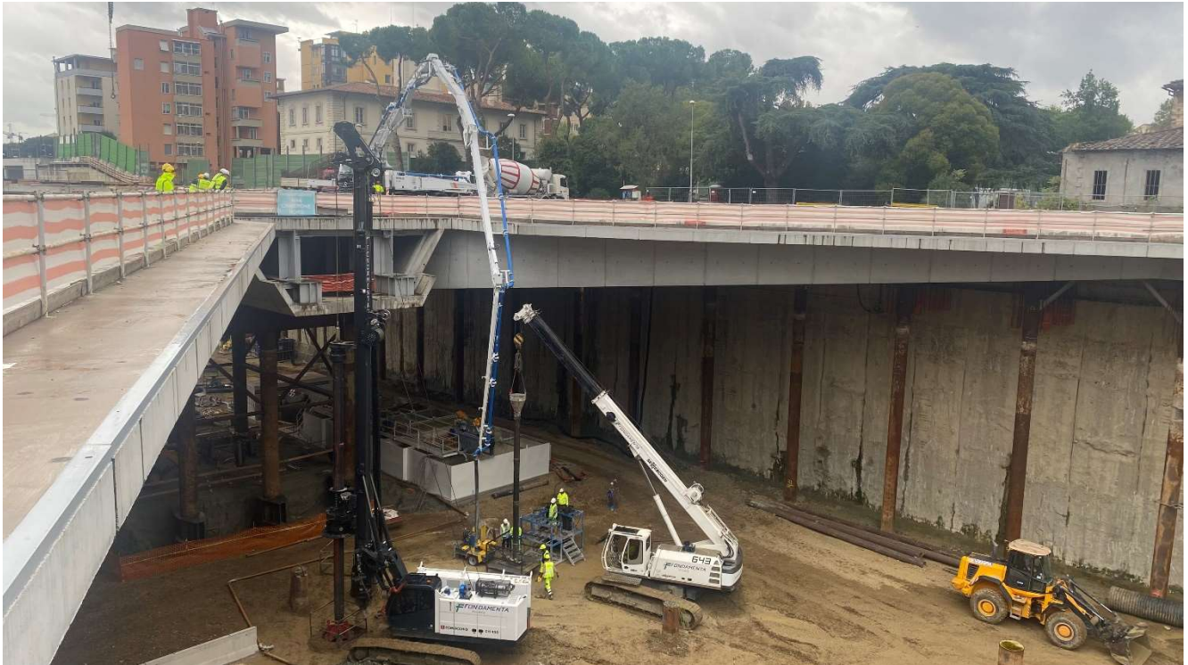
Figura 1 Stazione AV – Esecuzione pali integrativi