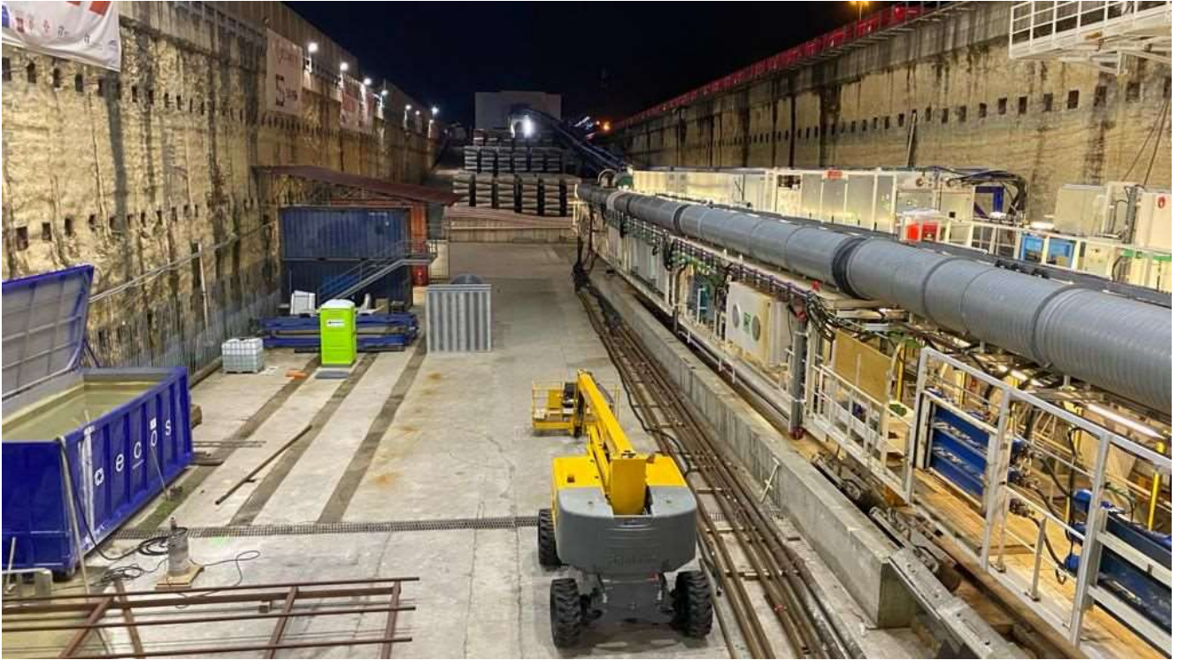
Figura 3 – TBM