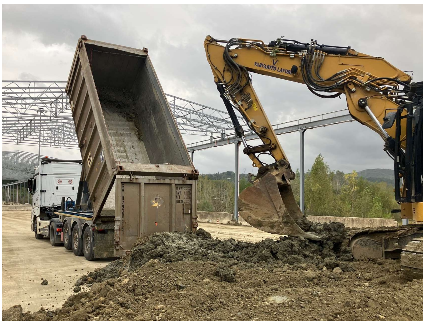
Figura 8 - Piazzole Santa Barbara