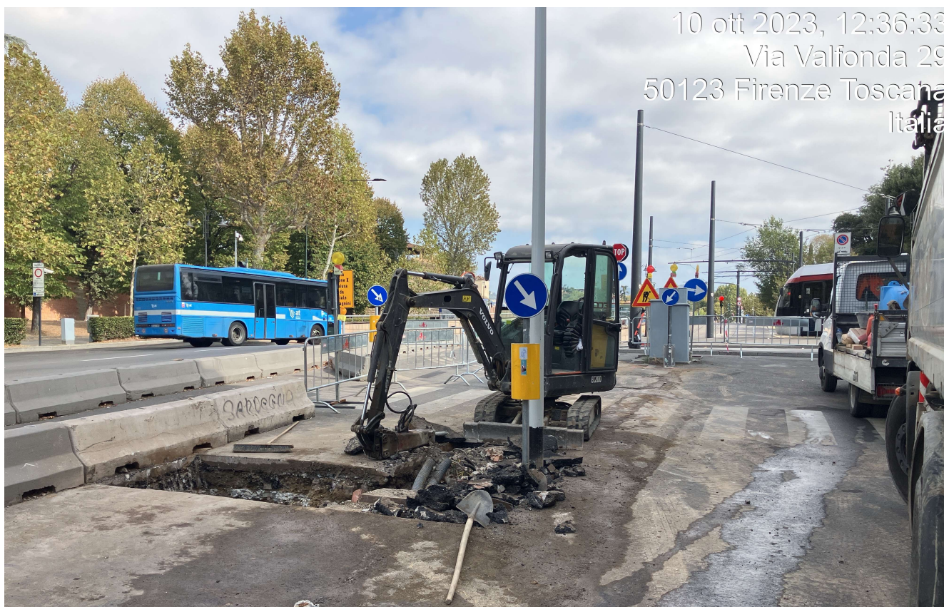
Figura 12 - Fortezza Area 3