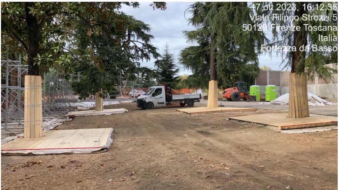
Figura 9 - Fortezza Area 1

17 ott 2023, 16:12:35 Viale Filippo Strozzi 5 50129 Firenze Toscana Italia Fortezza da Basso