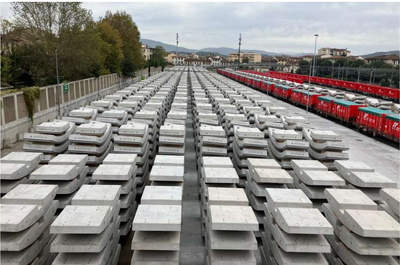
Figura 6 – Stoccaggio Conci (Campo di Marte)