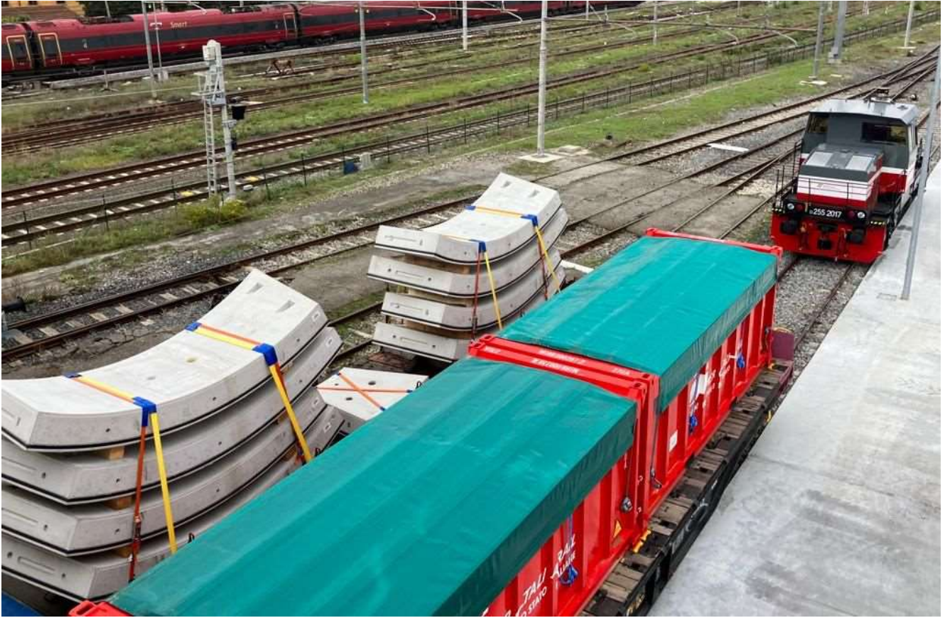
Figura 5 – Scarico Conci (Campo di Marte)