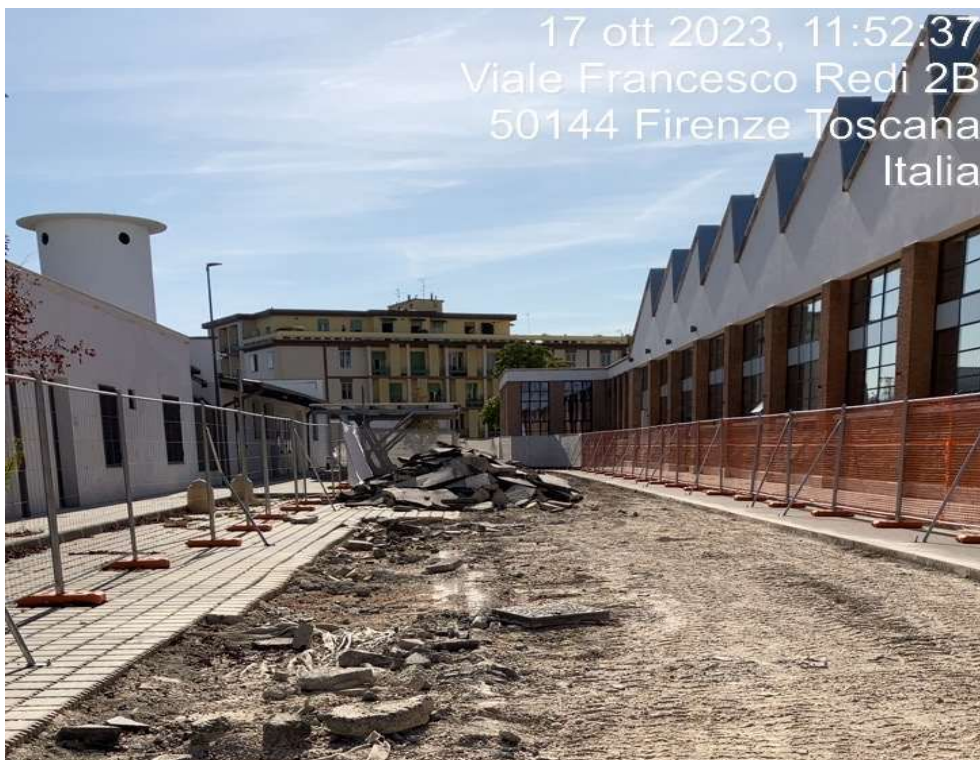
Figura 18 - Viale Redi