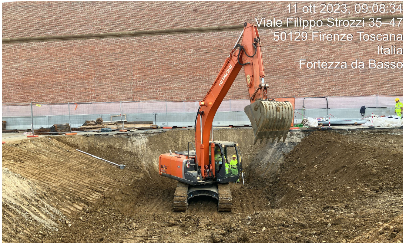
Figura 15 - Fortezza Area 4