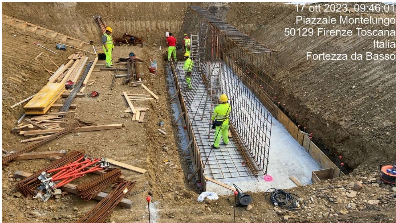
Figura 11 - Fortezza Area 2