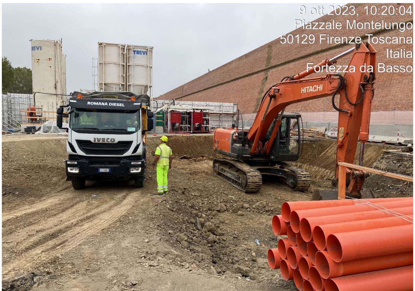
Figura 14 - Fortezza Area 4