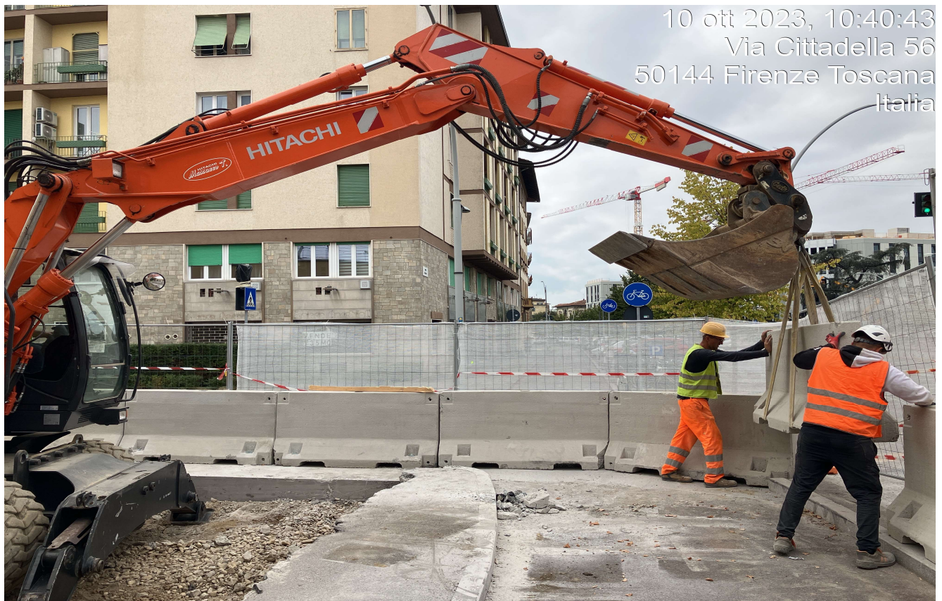
Figura 16 - Via Cittadella