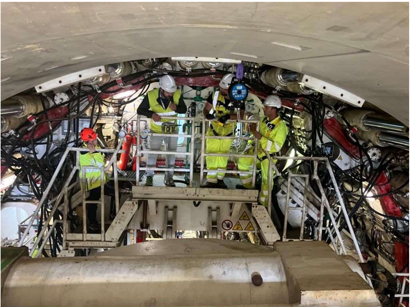
Figura 4- TBM