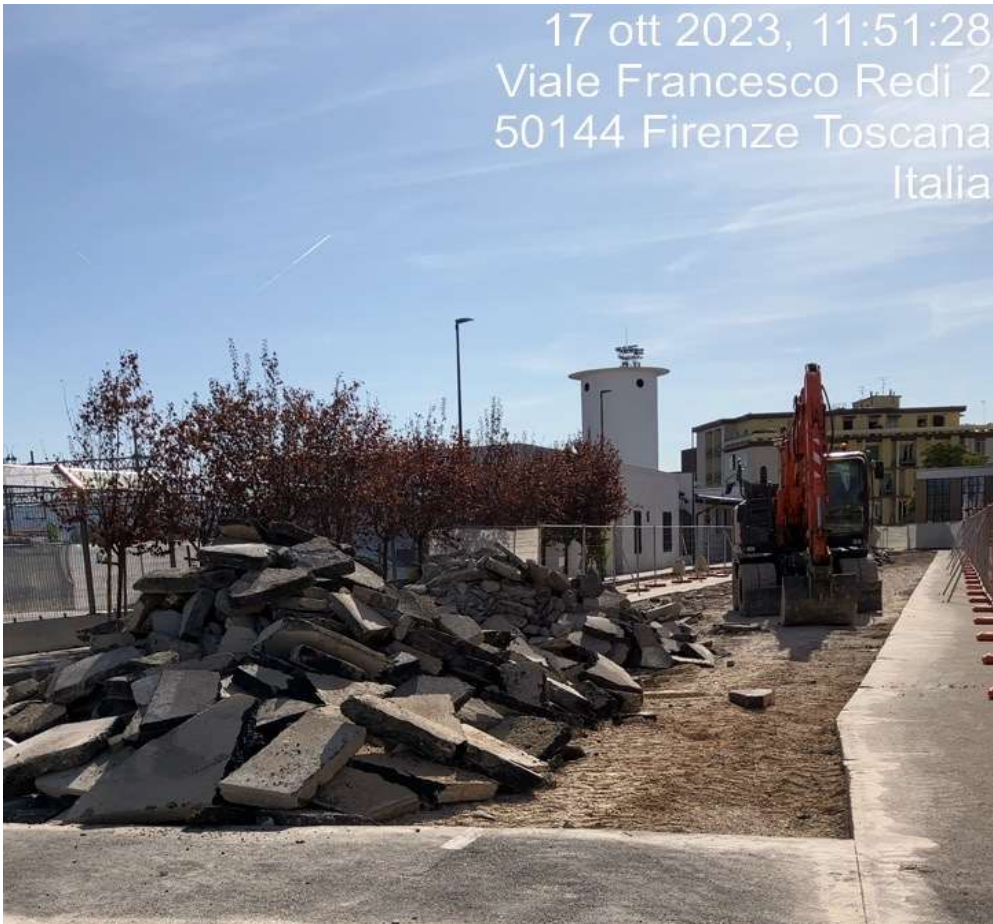
Figura 17 - Viale Redi